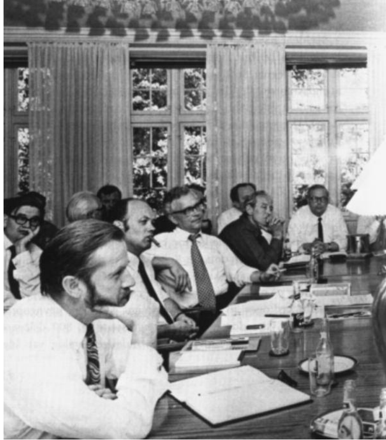
Illustration fra Kampens gang – LO 1898-1973

Ringegten for det kvindelige plejearbejde er et veldokumenteret træk i vor kultur, selv om denne ringegat går hånd i hånd med lysten til at nyde plejearbejdets frugter, således også i 1950'erne og 1960'erne. Det, der imidlertid er karakteristisk for holdningen der, er at man bryder med en århundredlang tradition for at prioritere den familiære pleje, idet man i så stor grad som muligt nu etablerer offentlige plejehjem og rationaliserer arbejdet i familien. Der kom skred