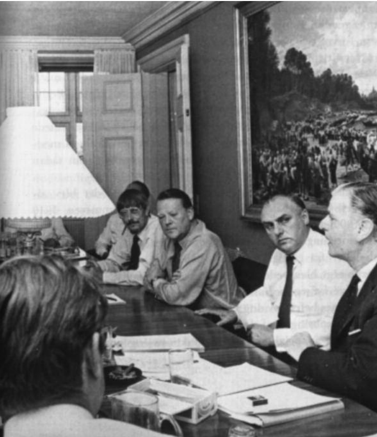
(red. Ib Koch-Olsen), København 1973

Mens det sidste var en fuldstændig utænklig tanke for de fleste mænd, var det vanskeligere at modsætte sig det første. Dels stred det jo mod de humanistiske menneskerettighedsbegreber at nægte kvinderne ligeret. Det var dog gået meget godt gennem mange år, blandt andet fordi de humanistiske retsidealer efter alt at dømme var – og er? – mindre rodfæstede end de traditionelle, patriarkalske kønsopfattelser og kønsholdninger. Det sted imidlertid også mod kernen i det nye mandlighedsideal. Selv om mændene måske ikke følte det sagligt-rationelle mandlighedsideal som et kønsmæssigt fremmedgørende ideal, så indbar det dog ikke blot, at den mandlige virksomheds kønsdimensioner blev skjult og frataget det synlige kønspræg, men også, at man tabte en række af de traditionelle