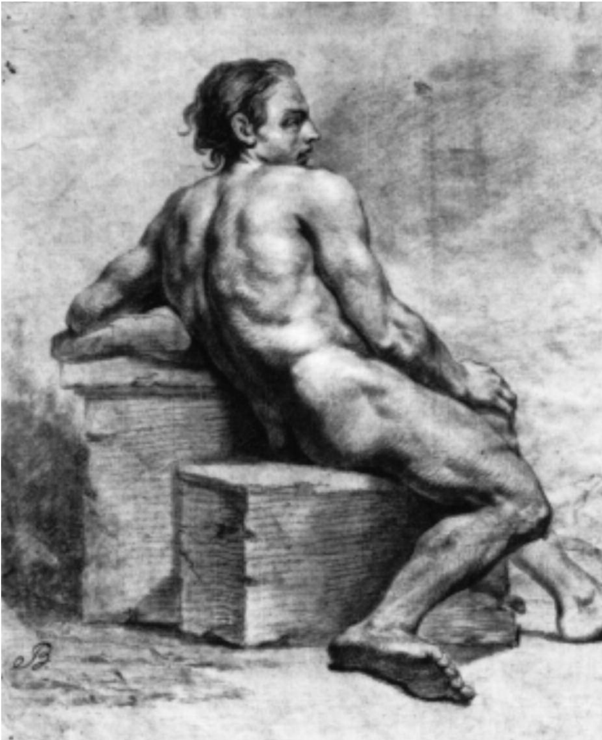
G.M. Fuchs, Elevtegning, 1755, sort og hvidt kridt