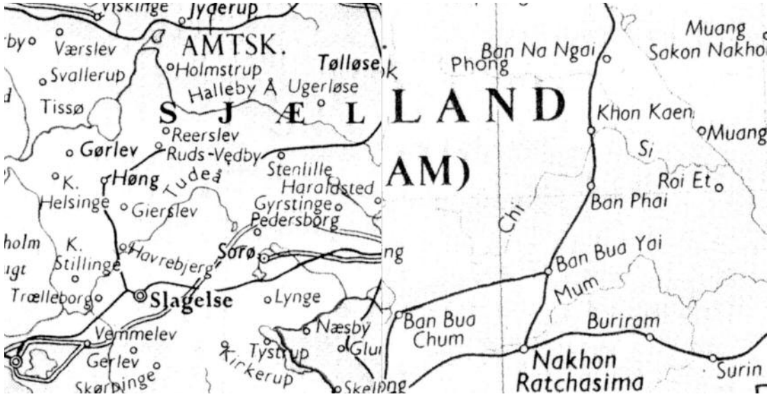
Collage af Ulla Sauerberg