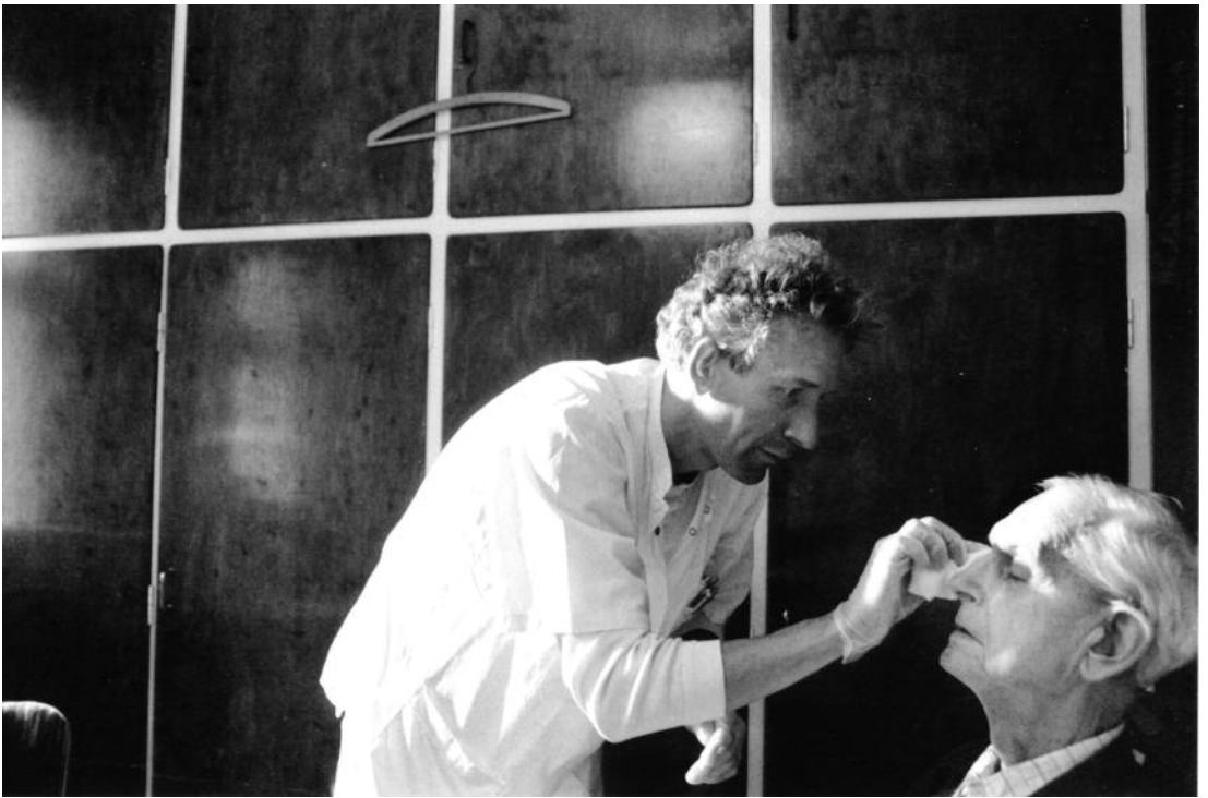
Hjemmesygepleje i København.

sen italesættes som værende bred, men bliver ikke beskrevet som så bred, at en professionsdiskurs bliver umulig. 15