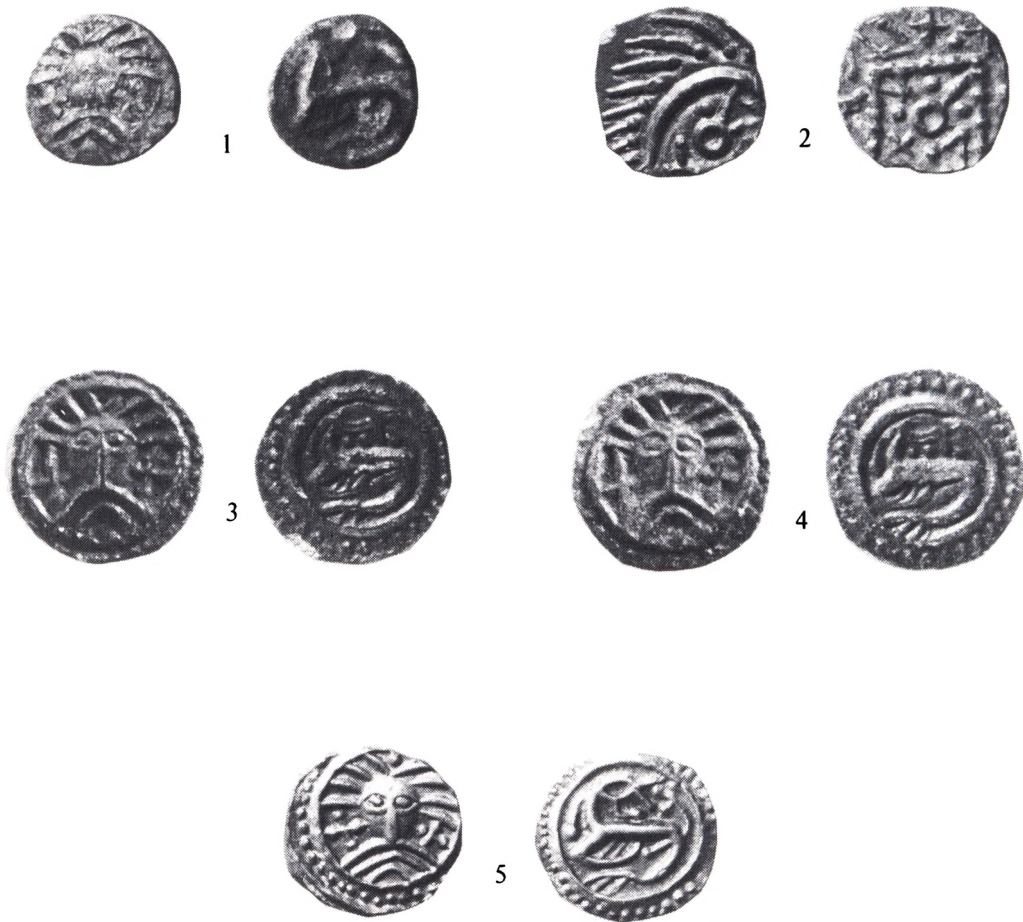
Fig. 1-5. Nyfundne sceattas fra Danmark og Skåne. Fig. 1. Holmsland klit, Vestjylland. Wodan/monster. Fig. 2. Gudme II, Fyn. Pindsvin. Fig. 3-5. Yngsjö, Skåne. Wodan/monster. Alle mønter er i dobbelt størrelse.