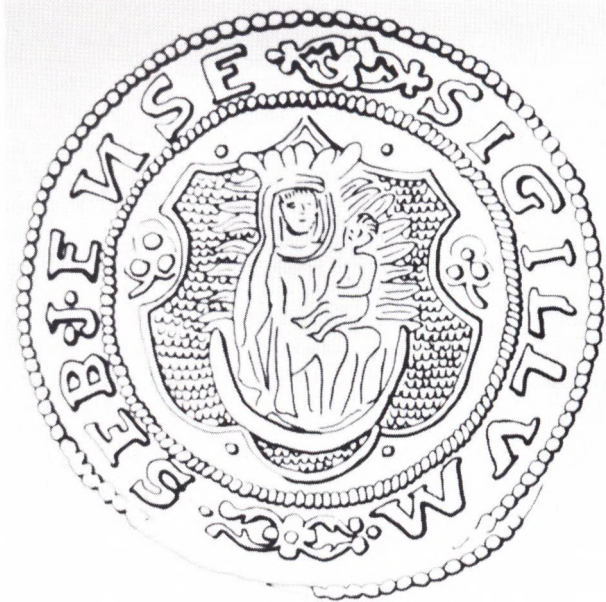
Fig. 4. Tegning af byens våben, kendt fra byens segl 1578. Seglstampen er udlånt til Sæby Museum fra Nationalmuseet. Efter P. Grandjean: Danske Købstæders sleg.

Vi har vel også rimelig grund til at mene, at Rhuus hentede sin Madonna fra »ehn liden gl. altertauffle, som maa ... hauffe været i brug førend dend, der nu ehr, blev funden«.