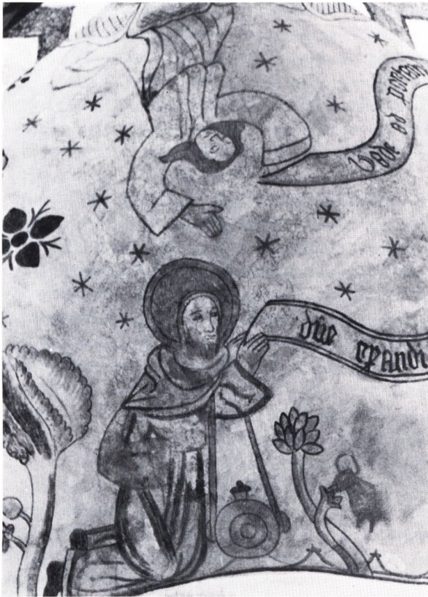
Fig. 3. Englen viser sig for den bedende Joachim.

stilling af den apokalyptiske kvinde. Dette må anses som en naturlig følge af motivvalget i hvælvet over altertavlen, hvor englen som før nævnt forudsiger Marias store hellighed.