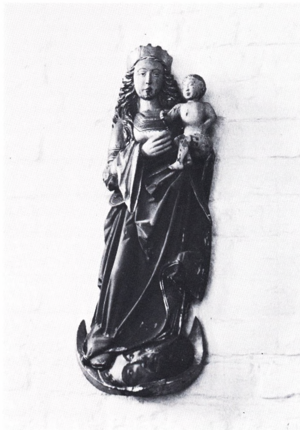
Fig. 1. Sæbymadonnaen hænger nu på korsarmens vestmur, hvor den blev flyttet over ved kirkens restaurering i 1906.

Francis Beckett gør Sæbymadonnaen til et tidligt arbejde fra Claus Bergs værksted, udført af en mester, hvis hånd Beckett mente at kunne spore til altertavlen i den nærliggende Torslev kirke samt til andre arbejder i Nordjylland og på Fyn (2). Men kun foldekastet i