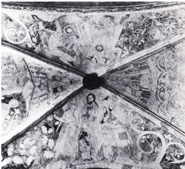
Fig. 3. Ängsö kyrka. Långhusets mellersta valv, västra kappan med en framställning av Kristus inför Pilatus, östra kappan med en framställning av Kristi gisslande. Knektan til höger bär en sköld med ett vapen som överensstämmer med den S K Vinstorpa-ättens.