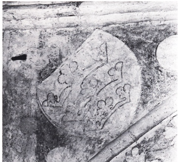
Fig. 4. Ängsö kyrka. Trekronor-vapen i det västra långhusvalvets norra kappas östra svickel. Vapnet ingår i en serie, som också omfattar Folkunga-ätten, Norges och drottning Blanche av Namurs vapen.