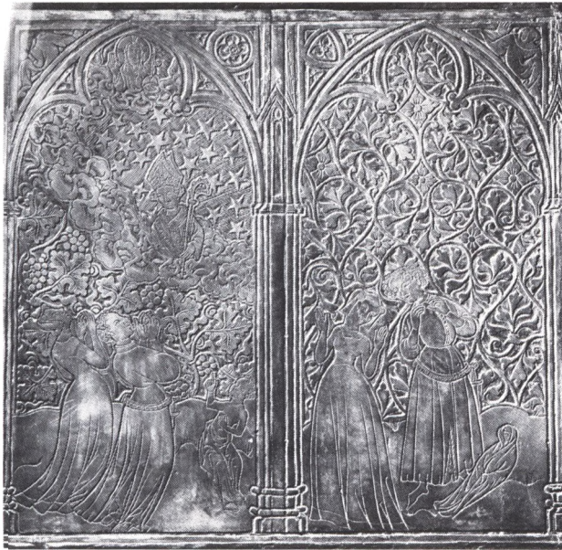
Nordsidan, bild 10-11. Ordningsföljden är här från höger till vänster. Illustrationer till en henrikslegend: föräldrar begråter sitt döda barn, som vaknar till liv på helgonets förbön.