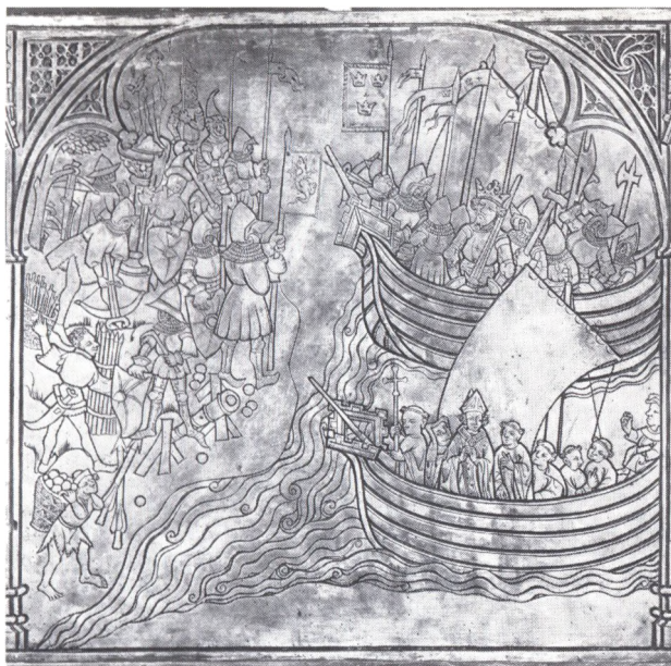
Sarkofagens sydsida, bild 1. Korsfararhären anländer till Finlands kust.