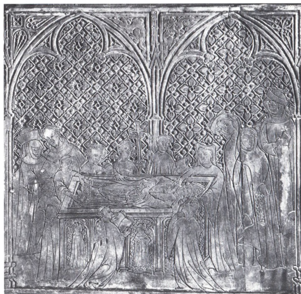
Nordsidan, bild 9. Biskopens lik läggs i sarkofagen inne i kyrkan.

sätter birettan , som fanns under den, på sitt eget huvud. På bild 7 kommer Lalli hem och möts i hemmets dörr av sin hustru Kerttu (Gertrud), som bär vil och viv samt förkläde över den fotsida kjolen. Hon synes ställa all balladdiktningens kärnfråga »Varför är din yxa så blodig, käre husbond min?«, medan enligt legenden Lallis svar avviker från de gängse: han säger sig ha nedlagt en björn. Bredvid dem ser vi Lalli ta av sig birettan , varvid huvudsvålen medföljer. Detta skulle man nog inte förstå om legenden inte hade upplyst om det. Kerttu lyfter förfärat händerna mot höjden. – Parets hem är ett sadeltäckt hus, med skorsten över sin eldstad.