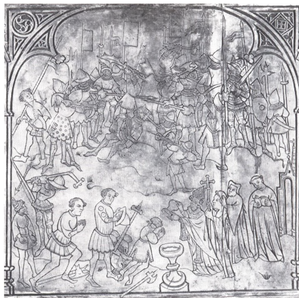
Sydsidan, bild 2. Finnarna besegras och mottar dopet.

i sin historiskt nyvärderande studie över »Östersjöväl- den«, där han uppfattar draken som symbol för ett tänkt sjöväld och statyn som en »Rolandssäule«, också den utvisande hednalandets »statskaraktär« (43) Det är knappast skäl att här kasta sig in i den spännande debatten kring dessa problem; för förf. förefaller det dock som om Klinge pressar sin tolkning av rätt allmänna konstkonventioner väl hårt.