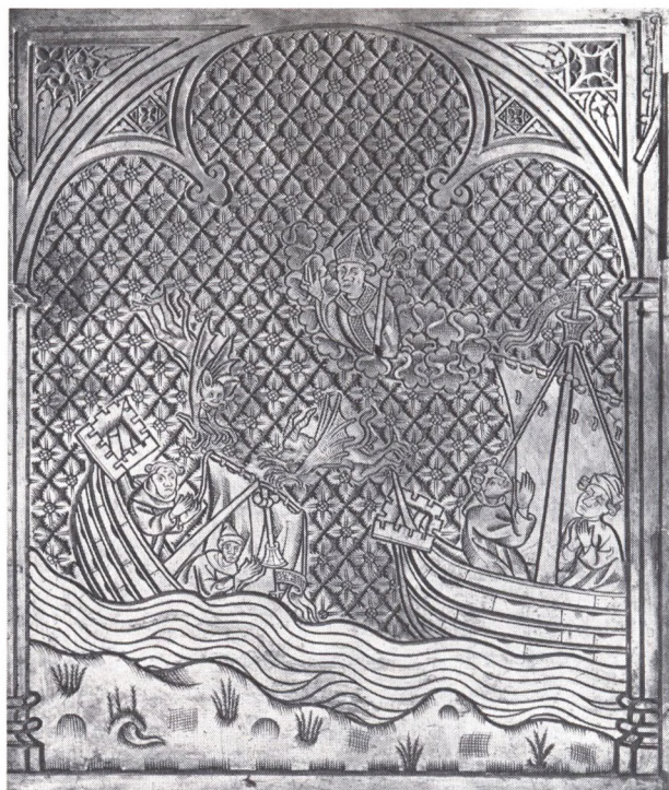
Sakofagens östgavel, bild 14. Fromma sällfångare i sjönöd räddas av Sankt Henrik.

finner en blind far och hans son vid en rodd på Kjulo träsk en korp, som på ett isflak hackar i biskopens avhuggna finger. Lalli hade förgäves sökt lösgöra biskopens ring och därför huggit av fingret, men tappat det. Den blinde återfår genom beröring med fingret sina ögons ljus. Mellan strandens träd ses en stämningsfull stjärnhimmel. Träden står redan fullt utslagna och bär ollon eller frukt. De utgör – liksom det lejon som smyger bak träden – ett ytterst exotiskt inslag i det finländska landskapet, medan en räv längre mot vän-