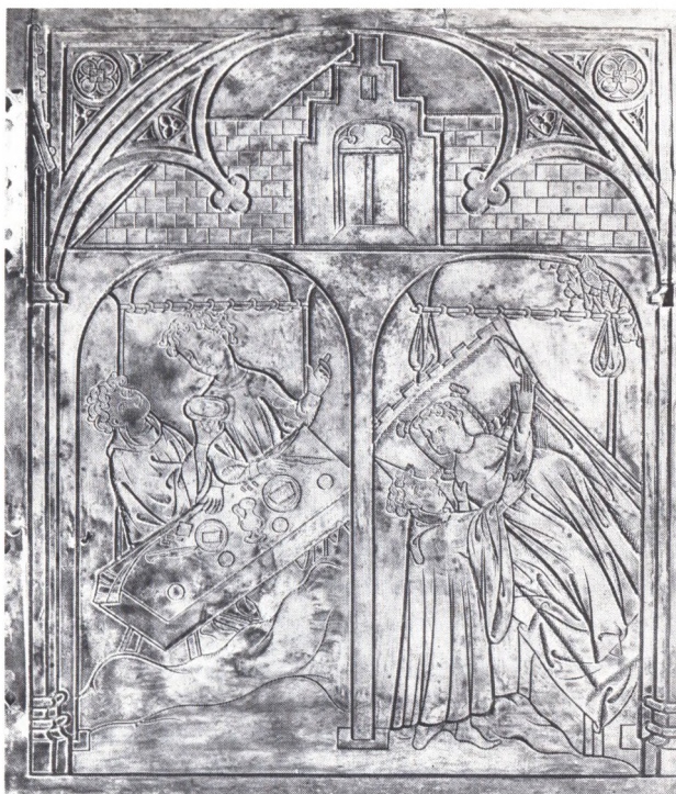
Sarkofagens östgavel, bild 13. Miraklet med den klenrogne prästen i Sandhem, vars plötsliga sjukdom botas genom helgonets ingripande.