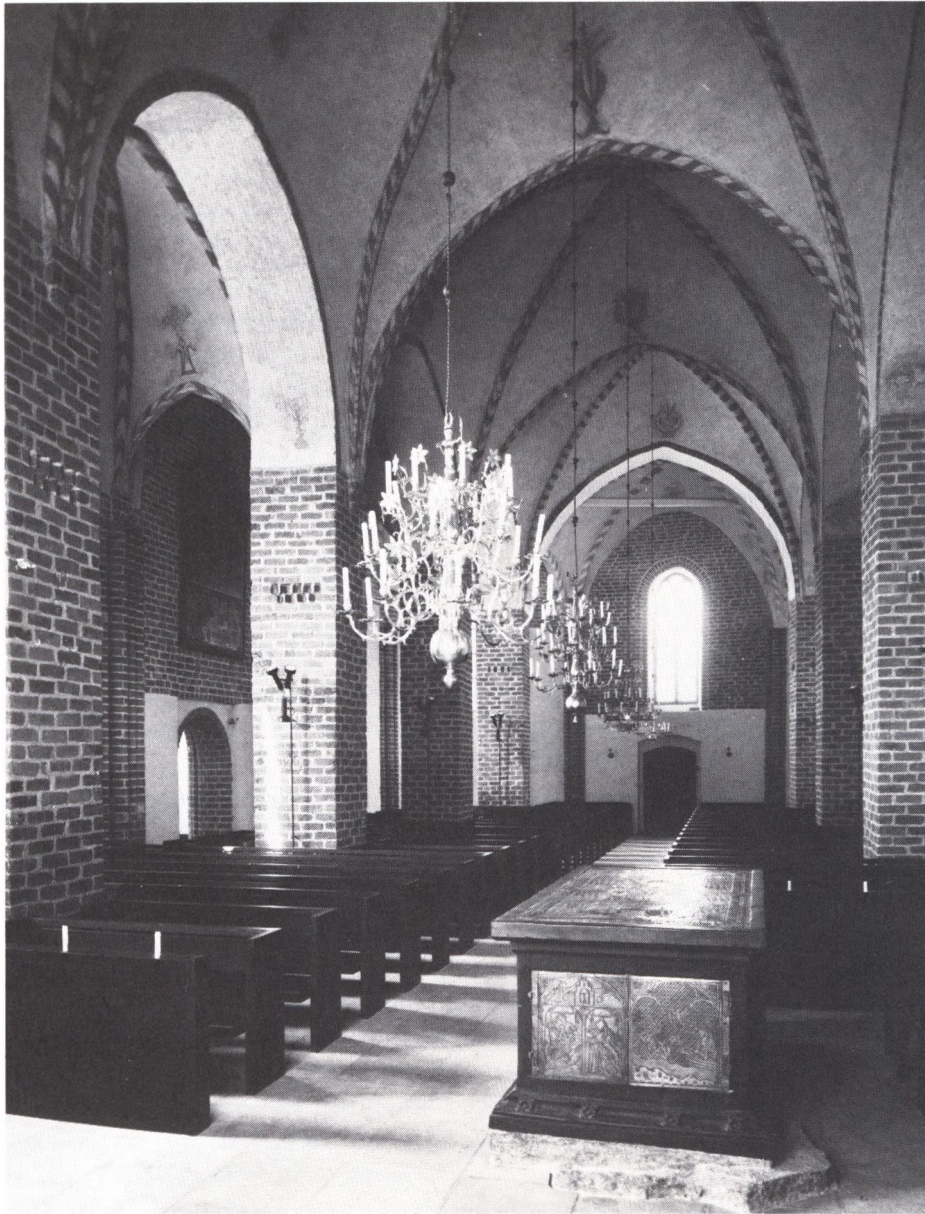
Sankt Henriks sarkofag på sin ursprungliga plats. Foto P. O. Welin, Museiverket 1969.