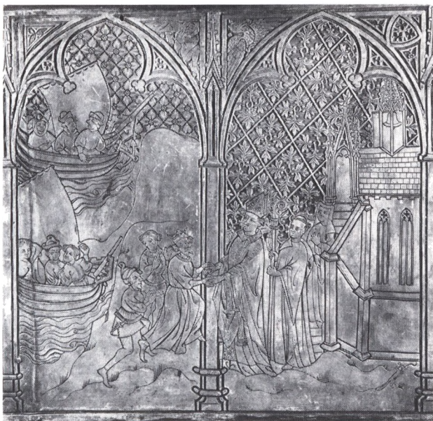
Sydsidan, bild 3. Erik den helige tar farväl inför återresan till Sverige.