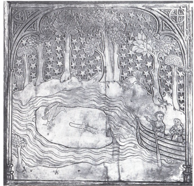
Nordsidan, bild 12. Sankt Henriks avhuggna finger med biskopsringen återfinns på ett isflak i Kjulo träsk.

spetsbågiga och de åtskiljs som vanligt av en pelare; uppe i innerhörnen har inplacerats två hopkrupna figurer sedda från ryggen. Dessa scener ursprungliga placering är i viss mån osäker, eftersom de på 1700-talssticket efter Alstrins teckning flankerar den bild, som nu är den sista i raden på nordsidan av sarkofagen (46).