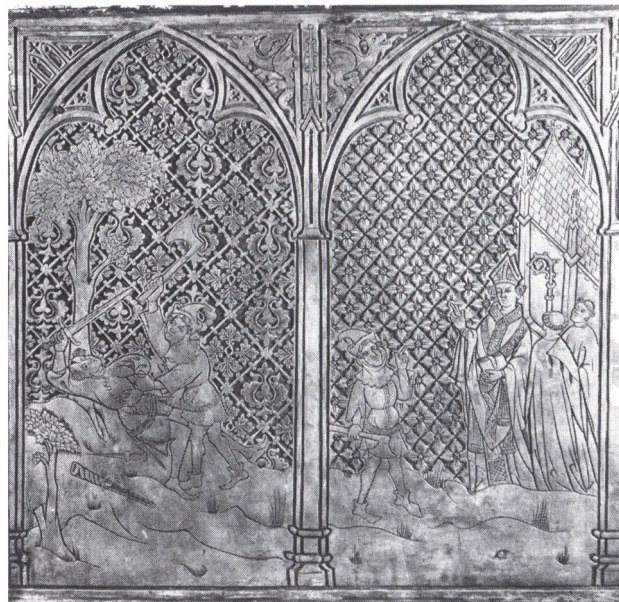
Sydsidan, bild 4-5. Lalli dräper biskopens man och lyses i bann av biskopen.

stanna i Finland räcker den nu civilklädde, halvt knäböjande kungen händerna till avsked tvärs över pelaren (44). Uppe i de två innerhörnen ersätts masverket av dels en hopkrupen man i huva, dels en fågel. Synvinkeln ligger något lägre än i fråga om de två första scenerna, och då bakgrunden heller inte är uppfylld av spjut och standar uppstår en tom yta, som utfyllts med stansade mönster. På det högra bildfältet är detta ett rombnät med inskrivna nästan naturalistiskt flikiga blad grupperade fyrapassvis på slät botten. På det vänstra fältet består det täta mönstret av fyrblad.