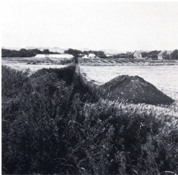
Fig. 4. Snit gennem området.

banke, hvor der måske kun var bevaret stolpehuller efter det tårn, vi troede, engang havde stået her. Sådan gik det ikke, for der var ikke noget voldsted i »Gravene«. Til gengæld fandt vi resterne af et lige ved siden af – gemt under tykke muldlag.