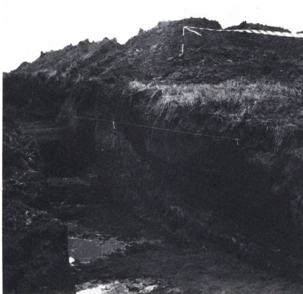
Fig. 2. I profilvæggen ses en del af borgbankens vold ud mod den brede voldgrav.

1955 af Vilh. la Cour og Hans Stiesdal. Alle mente at kunne iagttage en banke på ca. 500 m 2 omgivet af en dobbelt voldgrav, men da anlægget allerede i 1873 næsten var helt udjævnet, var der naturligvis ingen, der kunne give en sikker beskrivelse (1) (fig. 1).