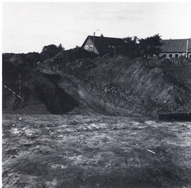
Fig. 3. Den brede voldgrav mellem forborg og borgbanke set fra forborgen.

De eneste, der havde større glæde af stedet, var børnene i Alsted. Efter den årlige juletræsfest i samlingshuset slæbte børnene altid juletræet ud til »Gravene« og kastede det i et af vandhullerne og en gang imellem kunne man også løbe på skøjter her. Efterhånden faldt børnetallet i Alsted og siden 1950-erne har skiftende ejere af »Bakkegården« med større og mindre held forsøgt at dræne »Gravene« og opdyrke stedet. Efterhånden er tørvejorden formuldet og terrænet har