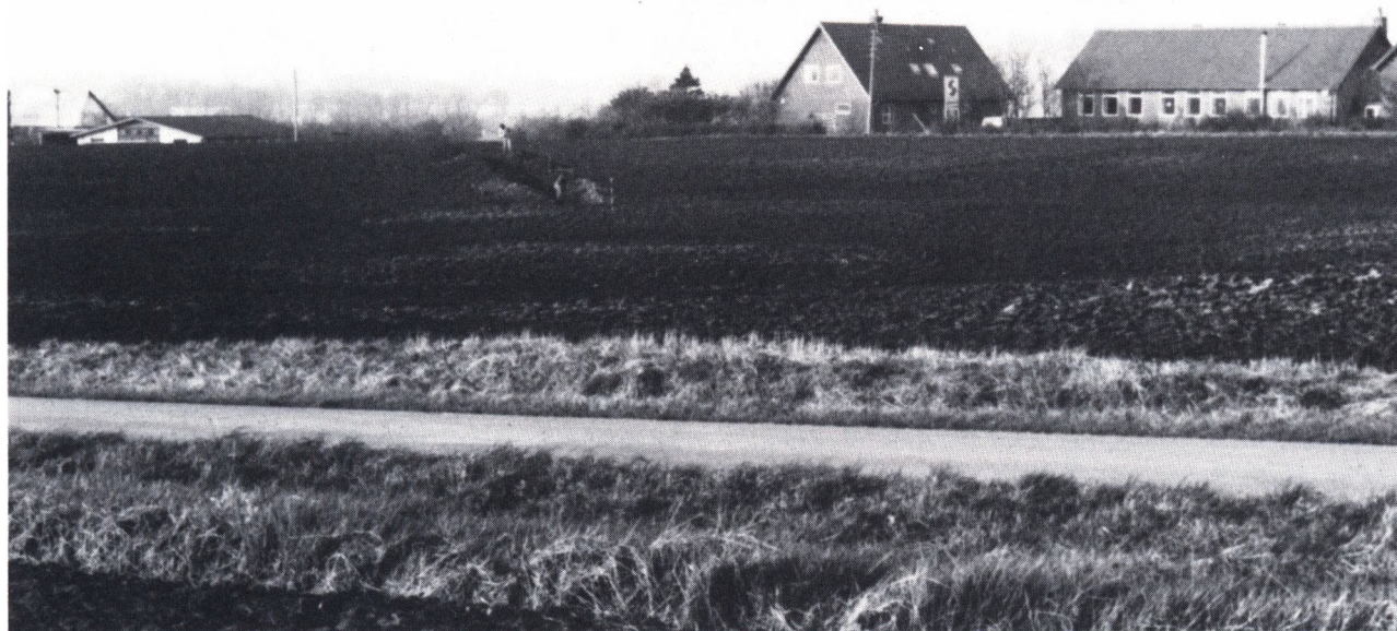
Fig. 1. »Gravene« ved Alsted. Det formodede voldsted ses i forlængelse af den lille prøvegravning.

Stedet blev beskrevet i 1873 af C. Engelhardt og Magnus Petersen, igen i 1900 af P. Hauberg og senere i