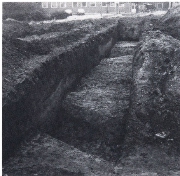
Fig. 5. Borgbankens sydvestre hjørne.

Der blev ialt udgravet ca. 2500 m 2 fordelt på to-meter-brede søgegrøfter og egentlige felter. Resultaterne fra en lang søgegrøft fra kirken i øst, over »Gravene« til »Bakkegård« i vest kombineret med flere kortere grøfter og egentlige felter viste forbausende nok, at der ikke var stolpehuller eller kulturlag bevaret på banken, men derimod vandafsatte lag. »Gravene« har derfor