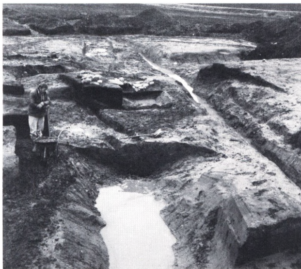
Fig. 6. En del af de dobbelte voldgrave på borgbankens sydfront. Kaj Benny Knudsen står med sin trillebør på vejen op til borgbankens port. I baggrunden ses rester af den gård, der engang rykkede ind på tomten af voldstedet.

ne« fra 1873 vises der på forborgens plads et område med piksten, måske rester af en bygning eller gårdsplads (fig. 3). På forborgen blev der ikke fundet spor efter palisadehegn eller volde.