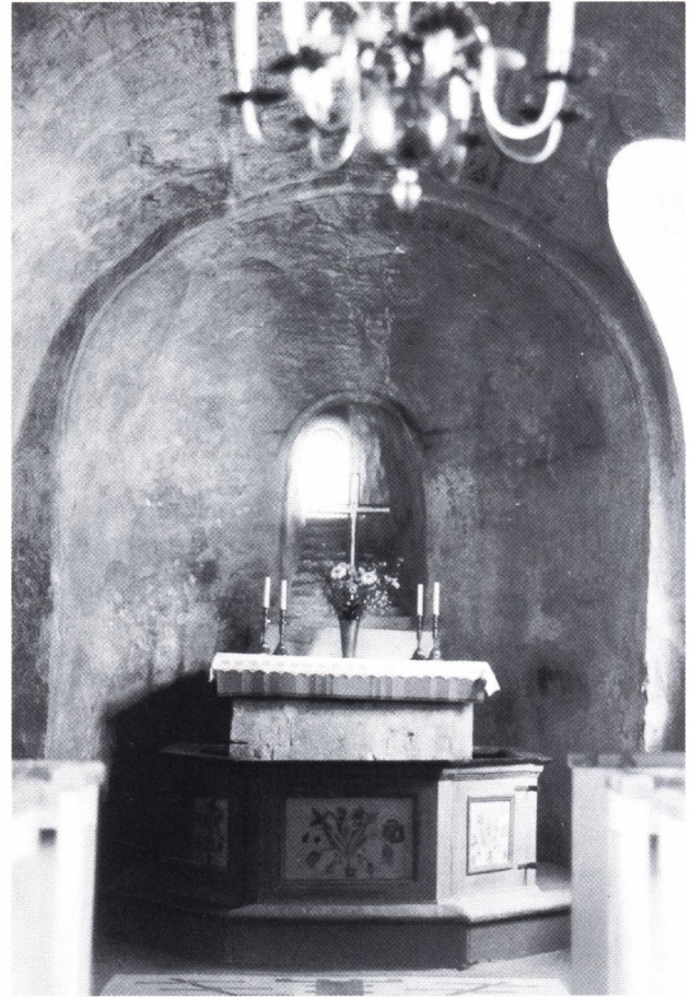
Fig. 3. Koret med romanska målningar och det treppstegsformade absidfönstret.

Kyrkans kor är täckt av ett tunnvalv, vilket fortsätter rakt ut i triumfbågen, som därmed bör vara ursprunglig och ovanligt bred. Långhuset har ett platt trätak, men ursprungligen har takstolarna varit synliga. De har en ålderdomlig konstruktion och bör