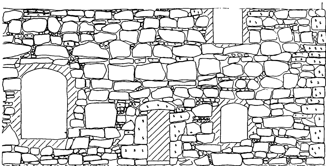
Fig. 5. Uppmätning av murverket vid en omputsning.

denna plats och han anser också att bynamnet Eriksberg bör vara betydligt äldre och dessutom är ett vanligt förekommande ortnamn. 5