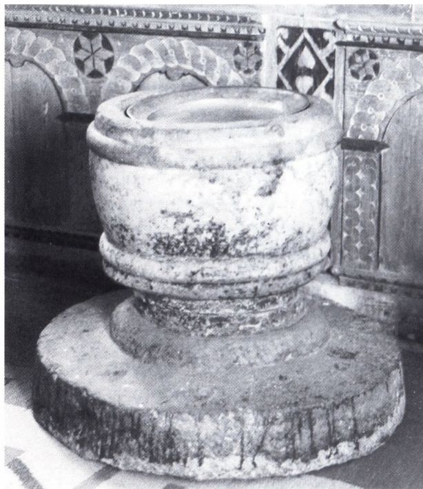
Fig. 6. Dopfunten har en ålderdomlig karaktär med engelska förebilder.

Hernfjäll anser att målningarna är påkostade och håller hög klass. Målningarna sätts i samband med benediktinskt och engelskt inflytande och dateras till omkring 1170. Den högra kungen antas vara Erik den helige, som genom sonen Knuts försorg börjat