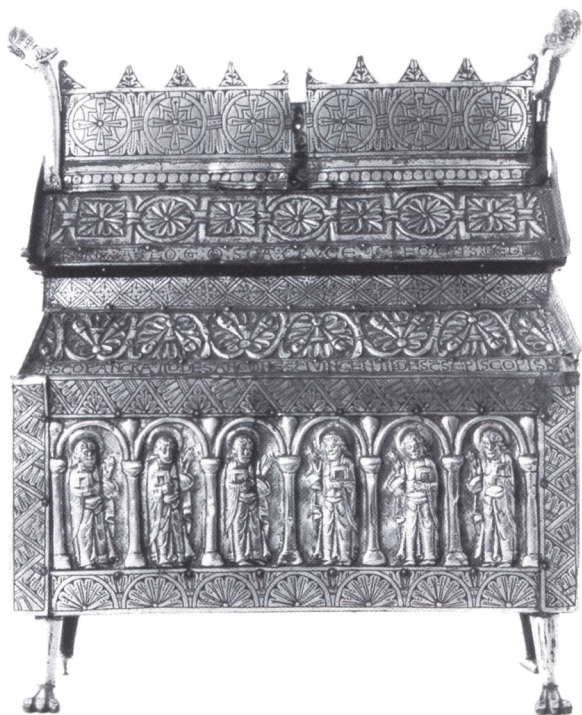
Fig. 4. Det märkliga relikvinskrinet från Eriksberg.

sprunglig ljusöppning finns i absidens östvägg och fönstret är format som en trappa med tio steg, vilken har tolkats som en Jacobsstege till himlen (fig. 3).