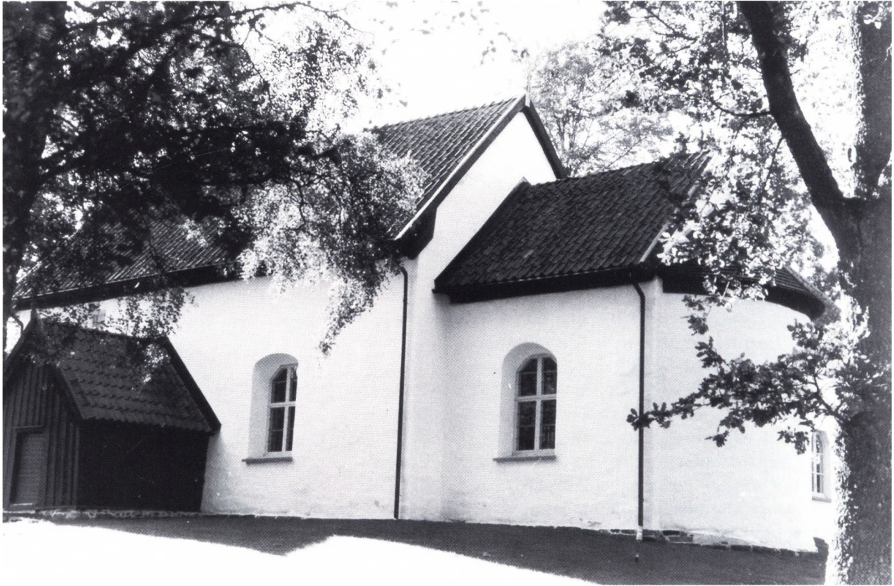
Fig. 1. Eriksbergs gamla kyrka från sydöst.

Kyrktätheten är ganska stor, vilket tyder på ett relativt tätbefolkat område.