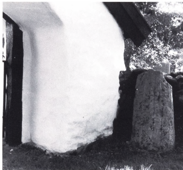
Fig. 7. Romansk gravhäll uppställd mot bogårdsmuren vid en stiglucka.

En historieforskning som endast ägnar sig åt källkritiska dekonstruktioner har nog kommit in i en återvändsgränd. Vi kan aldrig med full säkerhet få reda på var Erik den helige kom ifrån, men någon-