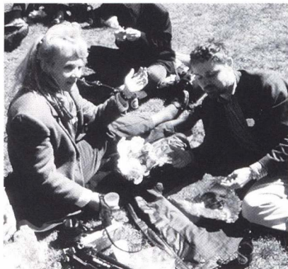
Artikler i hikuin 24 blev holdt som foredrag ved det sjette symposium »Kirkearkæologi i Norden« i Skåne 25.-27. april 1996