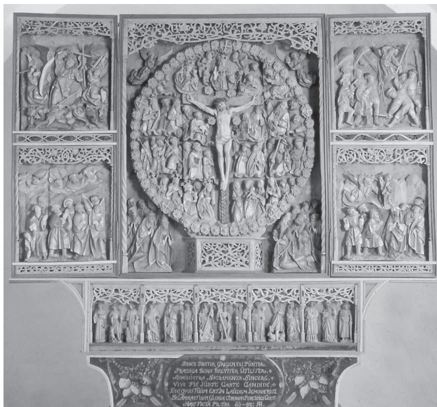
Fig. 1. Altertavlen i Hviding. Foto: Torben Nielsen, Institut for Kunsthistorie, Aarhus Universitet, 1998.