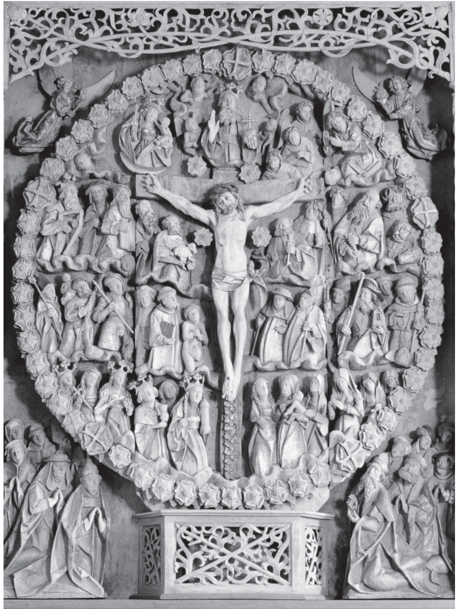
Fig. 2. Hvidingtavlen midtskab. Foto: Torben Nielsen, Institut for Kunsthistorie, Aarhus Universitet, 1998.