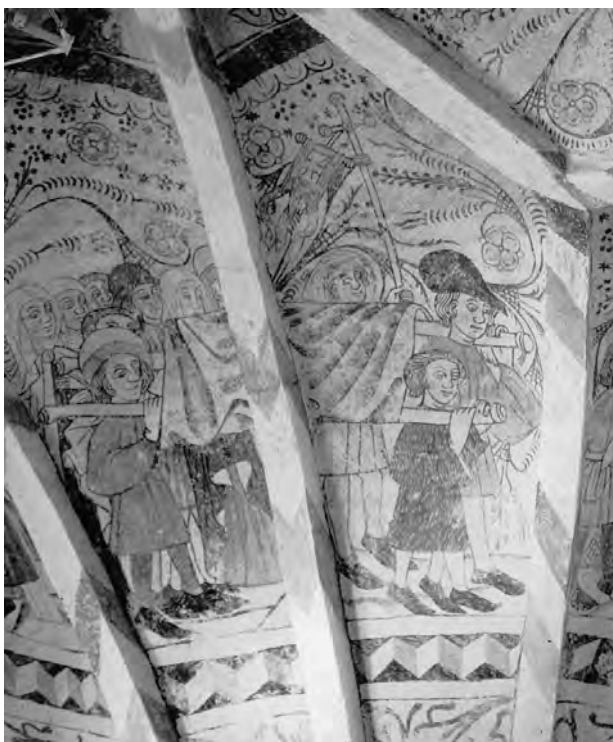
Fig. 2. Adams ligfølge. Det første menneske, Adam, bæres til graven ledsaget af et følge af mænd og kvinder. Den døde er lagt på en bære og dækket af et bæreklæde. Bemærk også at alle bæverne er sømmelig påklædt, ingen af dem er barfodede. Kalkmaleri Norra Strö kirke, Skåne, dat. 1450-75. Foto: Hanne Dahlerup Koch, august 2000.

Det er i forbindelse med ligfølget, at afgiften med det ejendommelige navn ligskud omtales. Det er usikkert, hvad den nærmere dækker. Skomagerne i Odense er de mest præcise. De skriver, at pengene skal bruges til fattigt folk, førend graven skydes til. 11 Det afspejler formentlig, at man skattede en bøn i en fattig mands hjerte særlig højt, og man gerne gav en