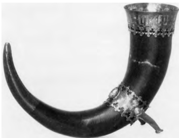
Fig. 1. Køge skomagerlavns drikkehorn fra senmiddelalderen. Hornet har et forgyldt messingbeslag med to fødder, så det kan stå selv. På randbeslaget er en plattysk indskrift i minuskler. Dets indhold er religiøst og lyder: "Helf Maria m[utte]r dat". Hornet er formentlig blevet brugt i forbindelse med ihukommelsen af døde medlemmer, herunder også nyligt afdøde. Se videre Bisgaard 1999. Efter Johansen 1986 s. 60.

om tre forhold: 1. at våge for den døde, 2. et ligfølge fra hjem til kirke og igen fra kirke til grav samt 3. særlige aftaler med hensyn til valg af lejersted.