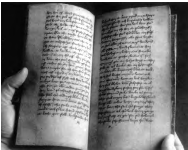
Fig. 5. Skomagersvendenes skrå fra Odense, 1400-1405. 1400-tallets svendegilder har ofte formfuldendte skrår indført i egne pergamentsbøger med sirlig skrift. Landsarkivet for Fyn. Efter Odense i middelalderen s. 10.

På nær et enkelt tilfælde er gilder ikke nævnt i landskabslovene, og set i det lys er det vanskeligt at forestille sig, at slægten ikke har haft noget begravelsesansvar. Undersøger man skrårne ud fra, hvad de ikke omhandler, vil man opdage, at arv f.eks. slet ikke er berørt. Den intime omsorg for liget som at tvætte og gøre det i stand er heller ikke omtalt. Her er det rimeligt at forudsætte, at det var opgaver for den nære familie. Gildets opgaver begyndte da også i al væsentlighed uden for brofjælen til den dodes hus. Man tør derfor antage, at skrårne forudsætter en række forhold om begravelsen bekendt. Det gælder for en række andre områder i skrårne. Skråen er kendetegnet ved en fast opbygning af den enkelte