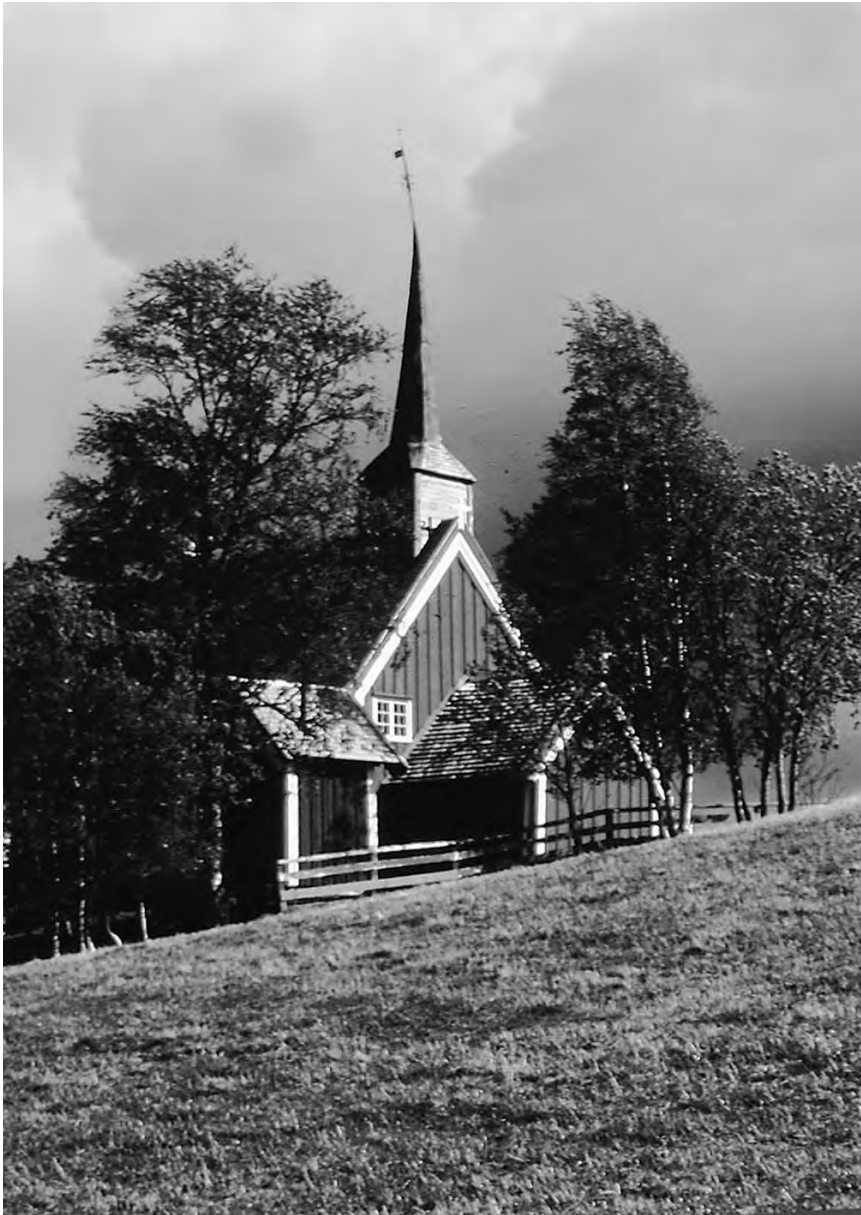
Fig. 3. Gløshaugen kirke i Grong i Nord-Trøndelag ble tømret opp i løpet av 9 uker i årene 1691-92, på tuftene av en stavkirke som var blitt revet kort tid i forveien. Her hadde samene etter tradisjonen "til alle tider" utrettet sine kirkelige forretninger, så da samemisjonen startet tidlig på 1700-tallet var det naturlig å knytte en kapellan til sogneprestembedet i Snåsa kort vei sør for Grong.