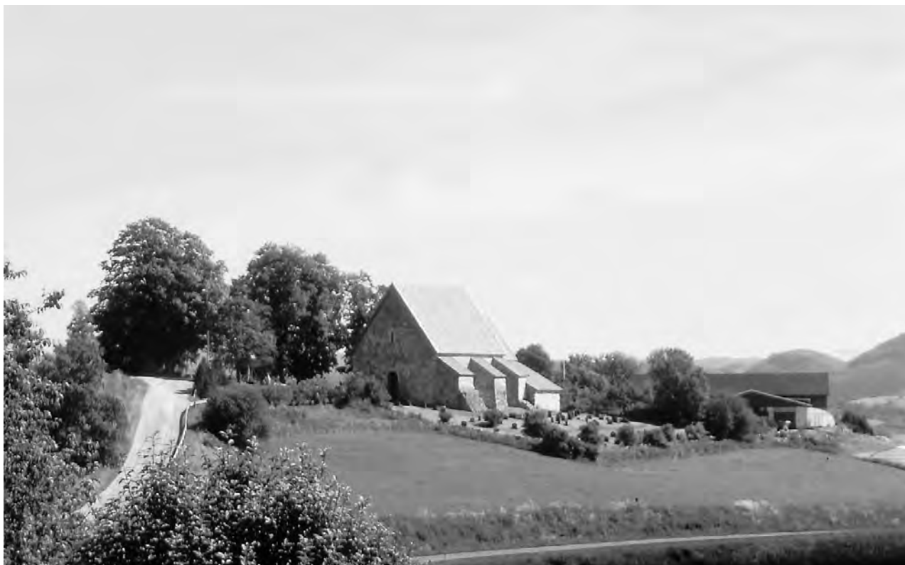
Fig. 2. Sakshaug kirke i Nord-Trøndelag regnes å ha vært fylkeskirke i middelalderen. Kirken ble reist i første halvdel av 1100-tallet, med et vesttårn som senere ble revet. Støttepillarene på skipets sørside ble bygd før ca. 1400 av stein fra det revne tårnet. Rundt 1450 ble det bygd til et sakristi på sørsiden av koret.

Frostatingsloven, sognekirke eller sogneprest finner vi derimot ikke. Diplomatariet og de sentralkirkelige jordebøkene har ved noen få anledninger fra 1350 og utover omtale av kirkesogn, mens uttrykk som sognekirke eller sogneprest knapt benyttes før utpå 1500-tallet. Dette viser trolig at et dekkende system med sognekirker ble seint utviklet i Nidaros bispedømme.