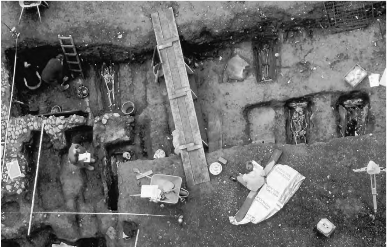
Fig. 7. Plassen foran Nidaros domkirkes vestfront ble på slutten av 1500-tallet omgjort til kirkegård. Etter hvert ble dette området ømerket for soldater og for sognets fattige. Flere av de gravlagte hadde hjemstavn utenfor sognets grenser. Foto: Bruce Sampson, NIKU, 1995.

undersøkelse av sognedannelsen i Norden med at denne prosessen ble slutført i tiden 1100-1300 men at det var store regionale forskjeller. 34 I Danmark blir sogn som begrep vanlig først i løpet av 1200-tallet. 35 I Trøndelag blir begrepet sogn som nevnt benyttet på 1200-tallet i Frostatingsloven, men da ikke entydig i betydningen av et fast geografisk avgrenset område. Først fra andre halvdel av 1300-tallet og på 1400-tal-