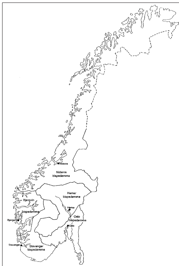
Fig. 1. Bispedømmegrensene i Norge ca. 1100-1300.

holder flere unntak fra hovedregelen, og at disse unntakene er særs viktige å merke seg fordi de kan gjøre det vanskelig for kulturhistorikere å operere med et begrep som "sognekirkegård" i middelalderen, i betydningen en kirkegård der de døde representerer et demografisk speilbilde av den stedfaste