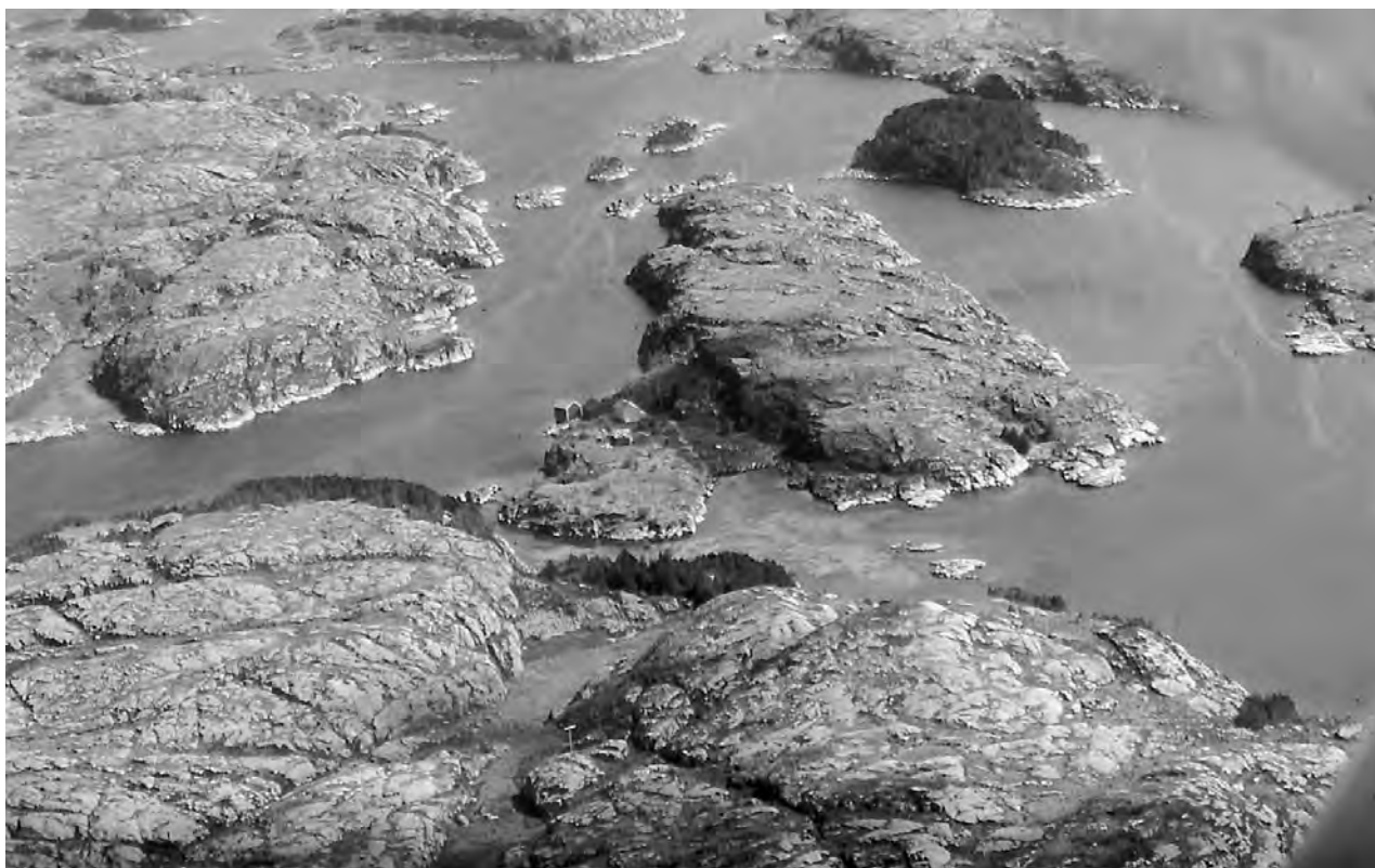
Fig. 4. Kvenvær kirkested på Hakbuøya i fiskeværerne utenfor Hitra i Sør-Trøndelag. På odden midt på bildet stod det i middelalderen et kapell. I sesongen ble det holdt messe her for fiskerne. Først i 1732 ble det anlagt gravplass ved kirken og i 1909 ble kirkestedet nedlagt. Den stående kirkebygningen, reist i 1763, ble på 1930-tallet flyttet inn til Forsnes på Hitra og gjenoppsført her.

erkebiskop Øystein (1161-88), men kampen om å råde for kirkene fortsatte gjennom hele middelalderen. Vi bør således kunne oppfatte de trønderske fylkeskirkene som en parallell til de kontinentale baptismal churches eller minsters , 23 som et tiltak for å sikre de kristne tilgang til de kirkelige handlinger og for Norges del trolig med erkebiskopen i Nidaros som viktigste pådriver. 24