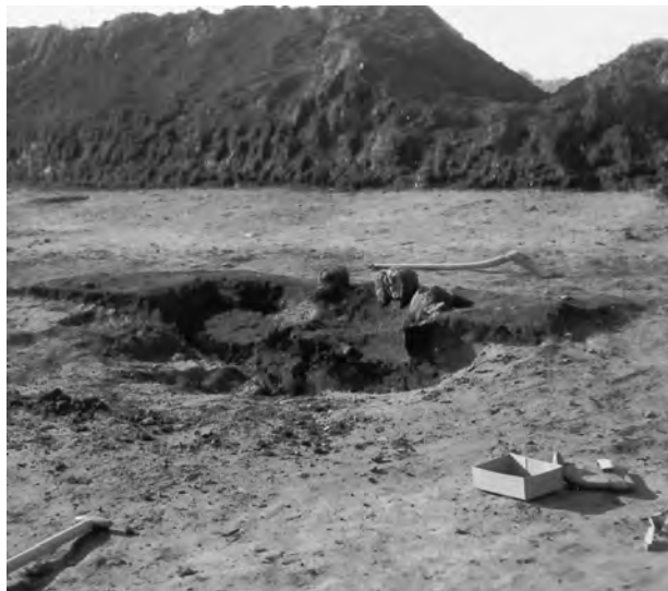
Fig. 5. Længdesnit gennem ovnen. Set fra NØ.

riode, der konstruktionsmæssigt kan sidestilles med Fredsøovnen.