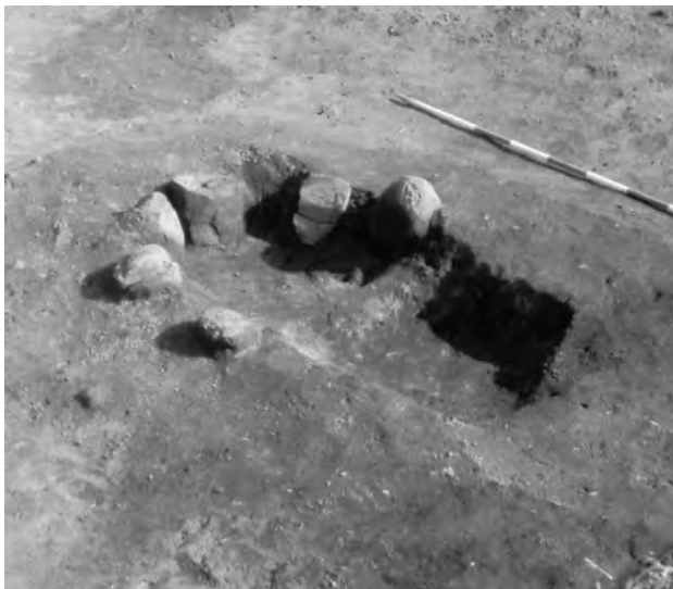
Fig. 4. Ovnens frilagt. Set fra SV.