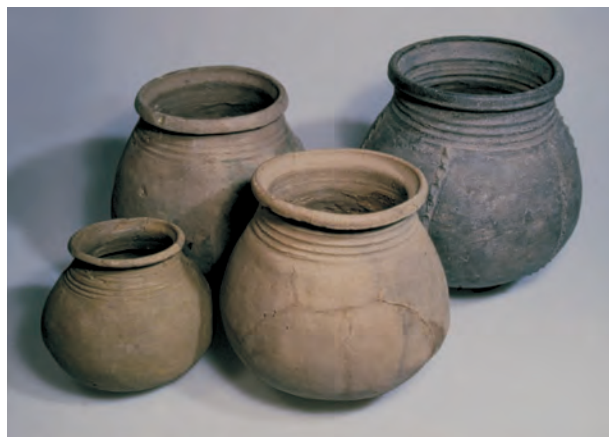
Fig. 2. Kuglepotter fra fundet ved Cecilieøst. Højde forrest t.v. 16,5 cm; t.h. 24,5 cm; bagerst t.v. 26,0 cm og t.h. 29,5 cm. Foto: Annali Bork, Haderslev Museum 2001.

Efter undersøgelsen var det muligt at samle fem hele potter. Resten af skårene fik lov at ligge. Ved en fornyet undersøgelse af fundet i 1980, opgjorde man de bevarede skår til 60 kg. Den altovervejende del var meget ens i godset med en fin magring, reduceret brændt og fremtrådte med en lys grå farve. Derudover var der en mindre gruppe af oxideret brændt lertøj med en gulrød skærv. Alt må karakteriseres som fuldbrændt. Alt var uglaseret, kun på en enkelt potte konstateredes enkelte pletter af blyglasur. De få glasurpletter kan skyldes, at der tidligere er blevet brændt glaseret keramik i pottemagerens ovn. Kuglepotter var langt den mest dominerende gruppe, dernæst var der skår af skåle (fig. 2). Hanke og karakteristiske rand- og bundskår viste, at der også indgik kander i fundet. Endelig var der forskellige variationer af tæer og ben, foruden ører. Kuglepotterne var med udbøjning, fortykket og profileret rand. Halsene på potterne har på flere en tendens til at være noget strakte med en vandret furing fra opdrejningen. Bugen var oftest noget sækformet. Selv om karrenes profiler varierer en hel del, er der tale om et ensartet materiale. De få tæer, ben og ører i fundet må stamme fra nogle af kuglepotterne. Få af potterne har på