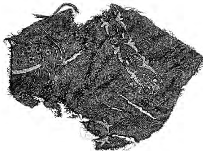
Fig. 2. Broderier fra Mammen-graven. Efter Worsaae 1869.