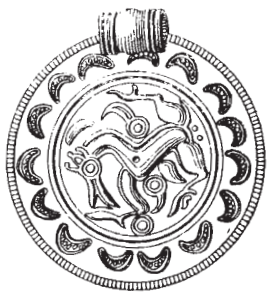
Fig. 3. Guldbrokat. Efter Antiquariske Annaler II .

bånd af slanger langs kanterne, er sendt af Antikrist og forudsiger hans komme«. 6