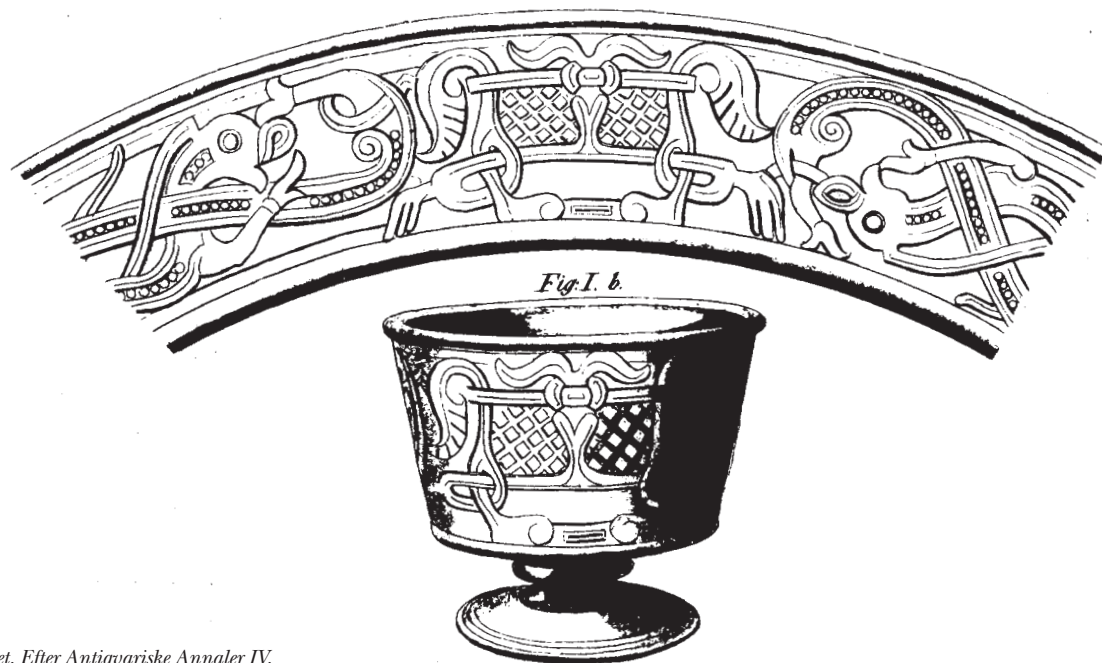
Fig. 4. Jellingbægeret. Efter Antiquariske Annaler IV .