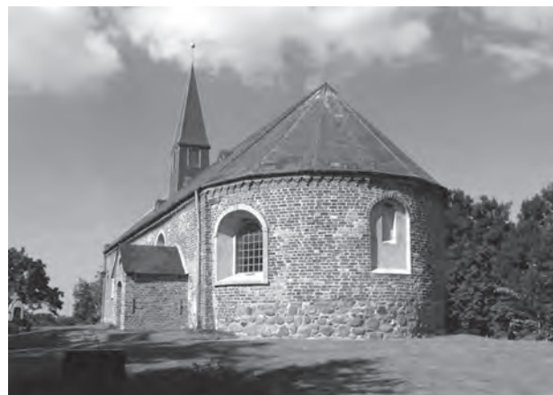
Fig. 10. Vollerwieck kirke, en af Gardings datterstiftelser.

En anden mulighed er imidlertid, at krøniketeksten kan have været inspireret af en levende tradition omkring særrettigheder, som moderkirken enten endnu var i besiddelse af, eller som havde eksisteret så langt op i tid, at man stadigvæk i 1400-tallet kunne huske dem på egnen. En sådan sejlivethed for gamle ordninger mellem kirkerne ville ikke være uden paralleller i det øvrige Europa, og herunder i England hvor kapellerne under de gamle minsters af og til måtte fungere uden begravelserettigheder helt frem til reformationen, således at man måtte transportere sine døde over ganske store afstande for at få dem i jorden ved den gamle moderkirke. 48 Ligeledes fra England kendes der også til ordninger gennem hele