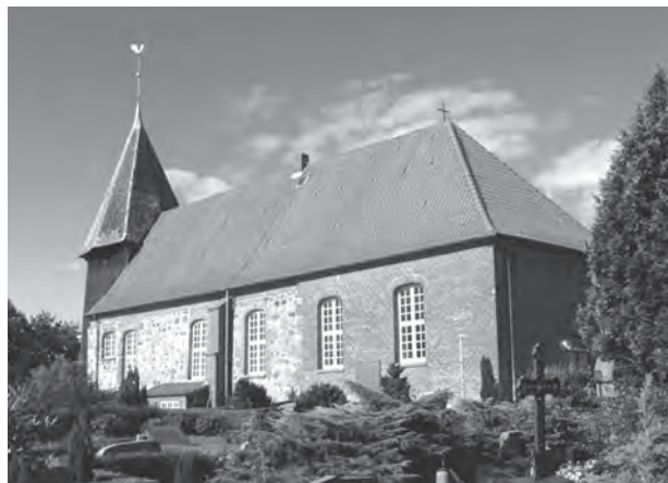
Fig. 13. Sehested kirke.

Dermed er der faktisk også bidraget til diskussionen af Catalogus Vetustus' overlevering frem til den kendte afskrift fra starten af 1600-tallet. I lyset af, at nogle af listens kapelbetegnelser efter alt at dømme er hæftet på kirkerne som følgevirkninger af indtægtsnedgange i sognene i 1300-tallet, kan listen således se ud til at være resultatet af et forløb, hvor en gammel fortegnelse over stiftets kirker – med de gamle nav-