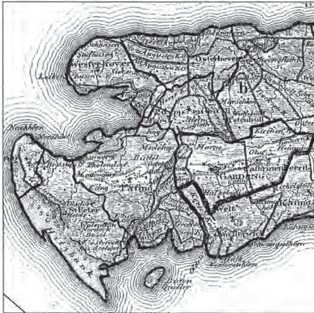
Fig. 7. Udsnit af Theodor Gliemanns kort fra 1829 over amterne Husum og Bredsted, landskaberne Eidersted og Nordstrand.

niketeksten, at Wenni Sywens blev sat til at forny. 40 Det gør sig f.eks. gældende med en malerisk beskrivelse af, hvordan en røverslægt i 1360'erne opførte en borg ved Vesterhever yderst på Ejderstedts vestlige spids, hvor de holdt skønne jomfruer indespærret og foretog røveriske overfald på omegnens befolkning. Af teksten fremgår det således, at stalleren Ingwer for at komme uvæsenet til livs stormede borgen og dræbte hele slægten, samt at begivenhederne derefter blev dokumenteret: »...unde dar makeden se besegelde breue up, wo dat alle Dinck fahren was«. 41 Det dokument så Epe Wunneken måske, da han arbejdede i stallerens arkiv ca. 100 år senere. Andre passager i krøniken giver imidlertid snarere indtryk af at være mundtlige