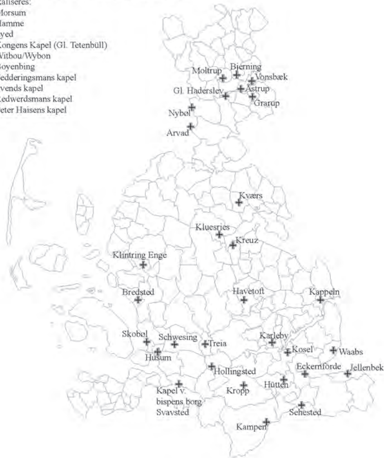
Fig. 1. Oversigt over fritliggende stiftelser i Slesvig Stift, der omtales som kapeller i de middelalderlige skriftlige kilder. Andre vidnesbyrd om over- og underordningsforhold (uden brug af kapelbetegnelsen) som f.eks. i Ejderstedkrøniken (se nedenfor) er ikke medtaget. Ud over de navngivne stiftelser meddele kilderne om tabet i stormfloder i 1300-tallet af 3 unavngivne kapeller i Sønder- og Nørre Gøs herreder og dertil fra provstierne Strand og Vidå om henholdsvis 24 og 5 unavngivne ecclesia og capella. Hertil blev provstevisitationen i hele stiftet organiseret ud fra opdeling i ecclesia og capella (se nedenfor). Illustration: MP 2005.

en slags facitlister for forklaringen af de af høj- og senmiddelalderlige kildesteder, har nøjere analyser af materialets udsagn om sontringen mellem kirkerne faktisk ikke været inde i billedet. Både i indhold og konsekvens har de tyske fremstillinger på den måde placeret sig på linie med det overordnede retshisto-