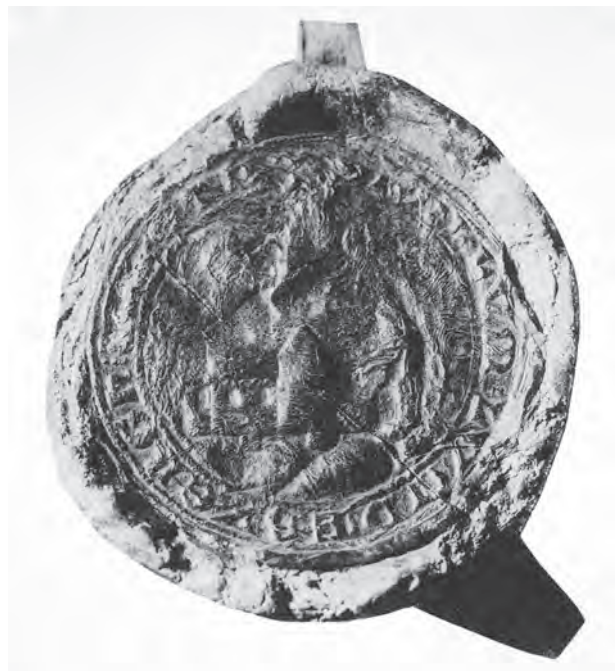
Fig. 11. Lundenberg herreds segl.

Det mest detaljerede – men også yngste – vidnesbyrd om eksistensen af gamle moderkirker med grupper af underordnede kapeller stammer imidlertid fra den lokale præst og kronikør Walter Anton Heimreich, der i 1666 udgav sin Nordfresisches Chronick . Heri beskriver han således, hvordan der i Utland fra første færd havde været et antal såkaldte