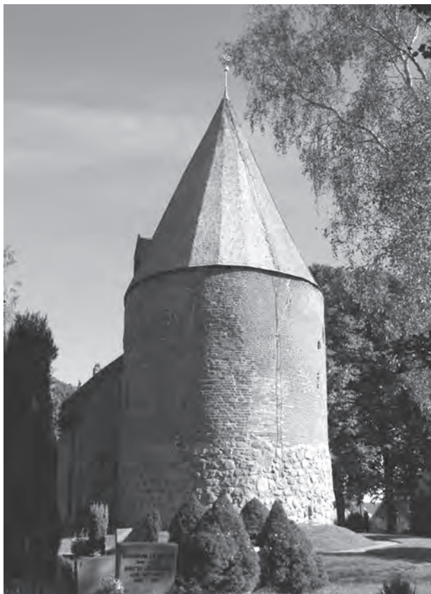
Fig. 12. Kospel kirke.

De tilsyneladende modstridende vidnesbyrd mellem Catalogus Vetustus og de arkæologiske kildegrupper har paralleller ved andre af områdets kirker, bl.a. Sehested, Kropp og Kampen, hvor alene 'kapel-sogdenes' beliggenhed op og ned ad hinanden gør det vanskeligt at pege på mulige udgangspunkter for et forløb med sogneudskillelse. Heller ikke kirkernes fremtræden eller niveauet for cathedraticum afgifter