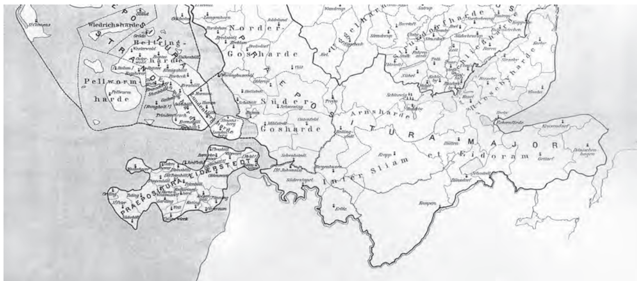
Fig. 5. Udsnit af Willers-Jessens kort over Slesvig Stift ca. 1450. Mod øst ses Waabs og afløseren for Jellenbek kirke, Krusendorf. Nordligst ud mod Vadehavet ses Bredsted. Sognegrænserne i området er i dag ændret flere steder; bl. a. er det middelalderlige Kampen sogn i nyere tid opdelt mellem Rendsborg og Hohn sogne. En række lokaliteter i områder, der blev hårdt ramt af stormfloder i løbet af især 1300-tallet, er skematisk rekonstrueret. Tegning: Willers-Jessen 1894.

status glider ud af fortegnelsen, må tilskrives sløsethed hos en af dens afskrivere. 31 Hans opfattelse finder en vis underbygning, hvis nogle af listens relativt få kapelbetegnelser for stiftets nordligere dele betragtes isoleret. Her ser capella nemlig kun ud til at være medtaget, hvor særlige forhold kan have besværliggjort en udeladelse ved en afskrift. Mest iøjnefaldende er det tilfældet med angivelserne af » Redwardsmanns Capell. « og » Peter Haisens Capell « i Beltring herred, » Schwens capell « i Pelworm herred og » Fedderingsmans Capell « i Edoms herred, der alle er sætningskonstruktioner med genitivformer af slægts- og mandsnavnene 'Redwardman', 'Peter Haisen', 'Svend' og 'Fedderingsman'. 32 I disse tilfælde har kapelbetegnelsen ikke kunnet udelades, fordi person-