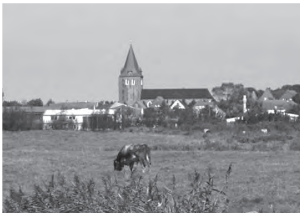
Fig. 9. Garding kirke.

punkt. Et sådant dokument kan eventuelt have været et sognevidne, men det kan også tænkes, at optegnelser af en sådan art kan have stået i messebøger, der ud over teksterne til gudstjenesten ofte blev brugt til at anføre oplysninger af almen interesse for sognet og kaldet. 47