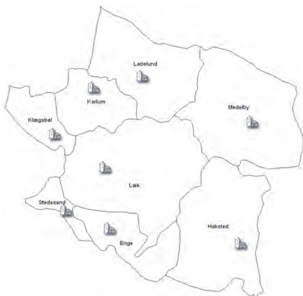
Fig. 4. Sognegrænser og kirker i området omkring Læk og Klintring Enge. Illustration: MP 2003.

Kapellet i Bredsted blev formentligt betjent på den måde frem til omkring 1510, hvor man kender den første i en ubrudt række af selvstændigt fungerende præster, og hvor det dermed ser ud til, at sogneudskillelsen så at sige er blevet ført helt ud i livet. 24 I forbindelse med, at man supplerede indtægterne til præstebordet i 1539, blev det anført, at indtægtsforøgelsen var nødvendig, »eftersom kirken ikke længe har været sognekirke« . 25 Det nye kapel fik altså på flere måder stramme tøjler i sine første år, og som ved stort set alle høj- og senmiddelalderlige danske byer gav det sig også udslag i den sammenhæng, at det nye sogn kom til at bestå af et lille areal, der – med Anders Andrén's terminologi – lukker sig omkring byarealet. 26