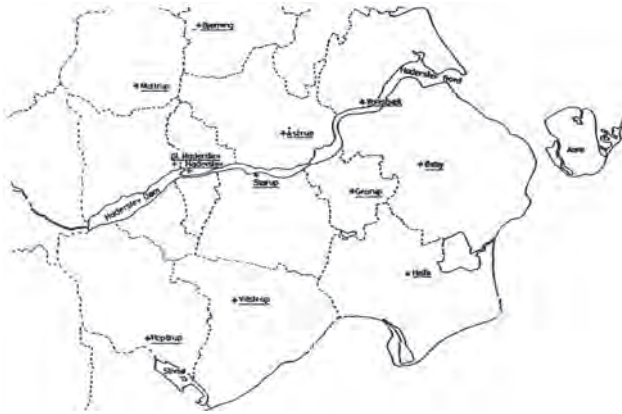
Fig. 14. Sognegrænser og kirkeplaceringer i området omkring Haderslev Fjord. Efter Fangel 1978.

der i forbindelse med holstenerkrigene i starten af 1400-tallet synes at have været tilløb til en selvstændig stiftsdannelse omkring Haderslev (fig. 14). 93