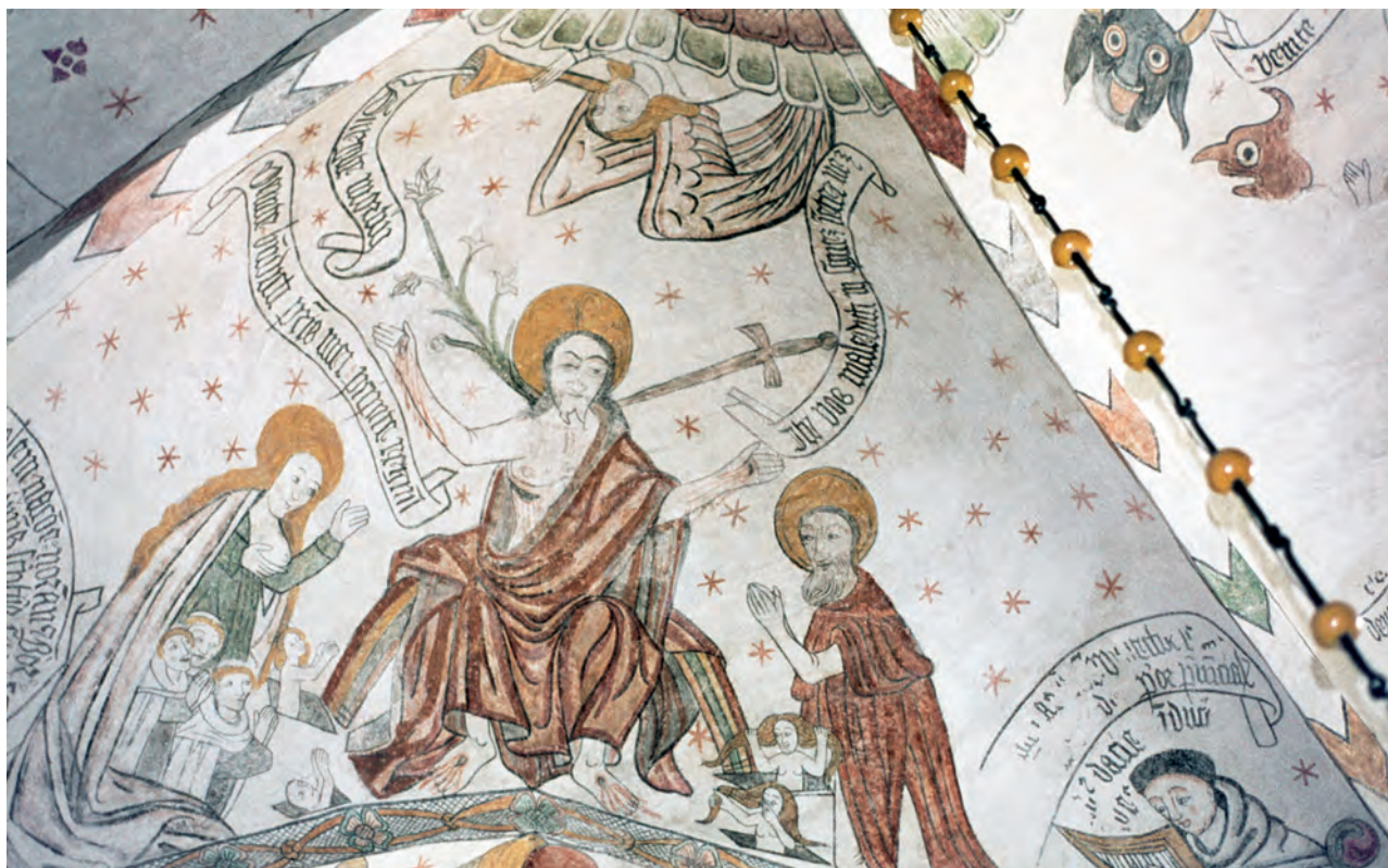
Fig. 1. Dommedag. Til venstre ses tre karmelitermunke under jomfru Marias beskyttende kappe (3. fag, østkappe)

et mere traditionelt scenario med dommedag, himmerigets borg og helvedesgab over tre kapper. Otte munke optræder i disse scener. I første fag knæler to munke, der efter ordensdragten at dømme må være franciskanere, under templet i Jerusalem, i andet fag står tre karmelitermunke under jomfru Marias beskyttende kappe – en indikation af ordenens tilknytning til Himmeldronningen (fig. 1). Desuden går en karmelitermunk i forreste række blandt de salige, der skal modtages af St. Peter, mens der allerede befin-