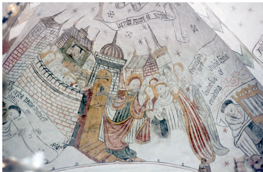
Fig. 2. De saliges ankomst til himmerigets borg. Forrest ses en karmelitermunk og inde bag himmelborgens mur endnu to, der nyder frelsens lyksalighed (3. fag, nordkappe).

der sig to kronragende munke inde bag himmerigets borgmur (fig. 2).