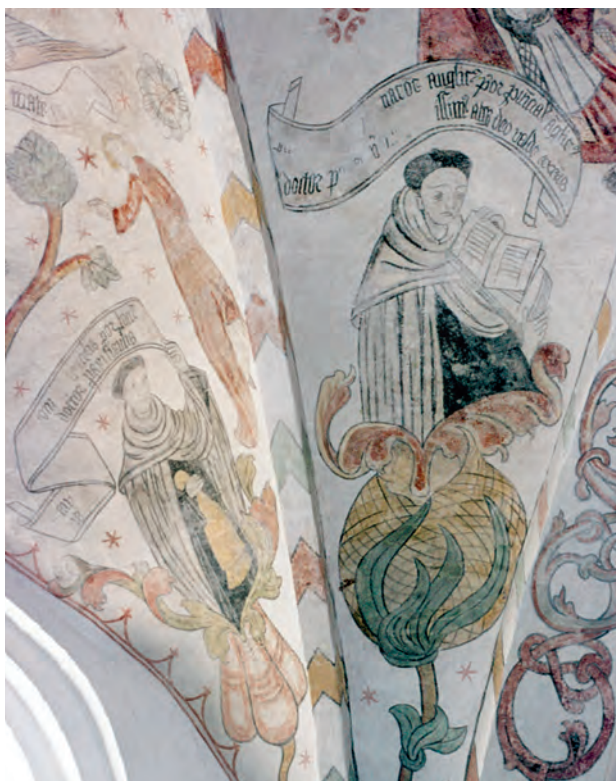
Fig. 3. Til venstre Gerhard fra Bologna med indsamlingspose, til højre John Baconthorpe med bog. Den første var doktor fra Paris, skolastisk forfatter og generalprior 1297-1317, den anden doktor fra Paris, provincialprior for England 1327-1333 og ordenens største skolastiske teolog.

logna, den elvte generalprior for hele ordenen, doktor i teologi fra Paris, skarpsindig med hensyn til åndsevner, en elsker af sin orden og en meget berømt leder)