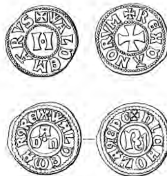
Fig. 10-11. Valdemar Sejrs, udmøntninger efter 1234. Fig. 10 viser den såkaldte rigsdmøntning, der antages udmøntet adskillige steder i landet, møntstederne angives ved diverse punkter (ikke afbildet her). Forsidens indskrift foreslås læst som »Valdemar II«, mens bagsiden har »Danskernes Konge«. Fig. 11, som er fra Roskilde, har på forsiden »Valdemar Dan(skernes) Konge«, mens bagsiden har »Nicolaus Ep(is)c(opus) R(oscildensis)« for »Bisp Niels af Roskilde«. Roskilde-bispen havde andel i møntindtægterne.