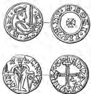
Fig. 3-4. Udmøntning fra Knud den Hellige (1080-86) fra Lund og fra Viborg. De jyske mønter er lidt større og noget tyndere end de skånske og sjællandske, ligesom også lødigheden er ringere.

Går vi frem til Knud den Hellige (1080-86), bliver forskellen endnu mere markant. De østdanske mønter er små og forholdsvis tykke, øjensynligt af godt sølv (fig. 3), de vestdanske er lidet lødige, men de er hvad møntblanketterne angår lidt større (fig. 4). Danmark var jo ét rige, og der har på dette tidspunkt været en massiv kongelig beskatning i form af renovatio monetae , »møntfornyelse«. Man skulle med visse mellemrum indveksle de kurserende mønter mod nye mønter, som så skulle bruges ved officielle betalinger. 4 Man, dvs. møntherren, kongen, kunne på denne måde få en massiv fortjeneste, dels ved at forringe mønternes sølvindhold og dels ved at lade udlevere færre ny mønter end der blev indleveret gamle. På et tidspunkt nåede man jo betænkeligt nær et nulpunkt for sølvindholdet. Men så kunne man – som i Norge under Magnus Barfod (1090-1103) – foretage en form for revaluering, således at penningen blev udmøntet efter en halvpenning-standard, det vil sige med en vægt, der svarede til den tidligere kun sjældent udmøntede halvpenning. Mønten havde