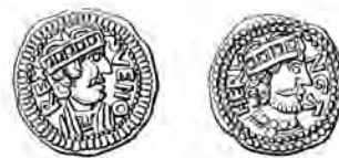
Fig. 7-8. Jyske brakteater, ensidige mønter, præget efter tysk inspiration i årene omkring 1150. Mønten til venstre angives at være præget af kong Svend, det vil sige Svend Grathe, mens mønten til højre angiver møntstedet, Heringa. Det er den eneste mønt, der vides præget i Hjørring.

En meget speciel udmøntning fra Svend Grathe, Knud V og Valdemar den Store, altså groft sagt tiårene omkring og efter 1150, er de små jyske brakteater, som kunstnerisk set er meget fremragende, og som samtidigt viser, at der var en række byer, hvor der var møntsteder: Horsens, Randers, Viborg, Hjørring (fig. 7-8). Mønterne kendes fra nogle store nordjyske fund, som stammer helt tilbage fra slutningen af 1600-tallet, 15 og ganske få enkeltfund – formentlig er mønterne så skrøbelige, at de dårligt kan overleve i jorden som enkeltfund (vægt 1/5 gram og derunder!). Hvordan disse meget omfattende udmøntninger reelt har fungeret som betalingsmiddel ved vi ikke. De er uden tvivl tysk påvirkede, og de må opfattes som en udløber af de meget store mængder brakteater, der i de samme tiår blev udmøntet, bl.a. i Sachsen. På grund af navnefællesskab mellem Liutger, mesteren for det danske Gunhildkors, der af Harald Langberg tolkes som udført for en datter af Svend Grathe (død 1157), og en brakteatkunstner Luteger fra Altenburg, foreslog Harald Langberg forsøgsvis, at der kunne være tale om én og samme mand. 16 Dermed være ikke sagt, at det også skulle være samme Luteger, der har udført de smukke jyske brakteater, men vi har antydnet den kreds, hvorfra stempelskæreren kan være hentet.