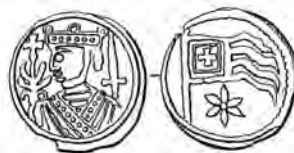
Fig. 9. Den såkaldte »dannebrogsmønt« præget af Valdemar den Store. Forsiden har i halvfigur kongen i profil med sværd og scepter, nærmest en slags lilje-vækst, hvoraf korset vokser frem, mens bagsiden har korsfanen. Man kan godt argumentere for, at møntens billedsprog viser hen til kongens korstog mod venderne, blandt andet erobringen af Rügen.

i øvrigt med en meget beslægtet udførelse (fig. 11). Det samme gælder i Lund, men her selvfølgelig med fremhævelse af ærkebisp Uffo (fig. 12). Det ser ud til, at man i Lund gjorde en slags oprør mod al denne uniformitet, og sidst i Valdemars regeringstid vendte