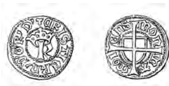
Fig. 18. Christiern I.s hvid fra Malmø opnåede en stor udbredelse, også i de nærmeste nabolande. Det var i forholdet til de svenske sølvmønter og de nordtyske hansestæders mønt ikke nogen særlig lødige mønt. Den trængte frem i kraft af »Greshams lov«, hvorefter den ringere mønt forjager den bedre. Men den kunne bruges ved beskednere former for kapitaldannelse, også i 1500-tallet. Derimod viser centraliseringen af udmøntningen til ét møntsted, at regeringen sandsynligvis har ønsket, at regionaliseringen indenfor møntvæsenet skulle ophøre. Der gik i første omgang et halvt hundrede år, før man igen måtte operere med flere møntsteder.