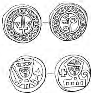
Fig. 12-13. Valdemar Sejrs udmøntninger fra Lund efter 1234. Stilmæssigt synes mønten fig. 12 at svare til de foregående, forsiden har kongens for-bogstav »VV« omkring hans magtsymbol sværdet, mens ærkebisp Uffes latiniserede navn VFO står langs hans ærkebispstav. Mønten på fig. 13 har ingen indskrift, men opbygningen af motiverne svarer til den hævdundne, forsiden har kongebilledet, bagsiden har ærkebisen, som har stiftets helgen Laurentius' martyrsymbol, risten, foran sig. Mønten dateres af et fund til sent i Valdemar Sejrs regering.

Udmøntningen i Danmark i perioden mellem Valdemar Sejrs død 1241 og Christopher II.s død 1332 kaldes »borgerkrigsmønter«. Det har været en højtt udviklet udmøntning, med forskellige møntsteder, Sjælland, bl.a. Roskilde, et eller snarere flere møntsteder i Nørrejylland, Ribe og Slesvig. Sølvindholdet