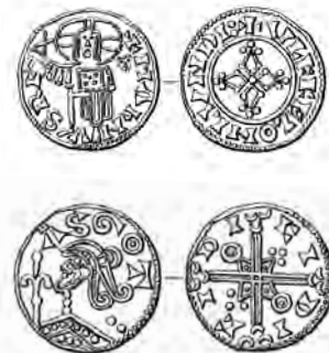
Fig. 1-2. Penninge fra Lund og fra Viborg, begge Svend Estridsen (1047-74), antagelig ca. 1060. Det var ikke alene vægtmæssigt, men, som det ses, også stilmæssigt forskel på udmøntningerne i Øst- og Vestdanmark. Forsiden på Lunde-mønten har en byzantinsk inspireret Kristus-figur, mens forsiden på Viborg-mønten har en herskerfigur, der fra et vesteuropæisk forbillede stilmæssigt har udviklet sig på selvstændig vis. 29

ninge c. 1 gram, vestdanske c. \frac{3}{4} gram), går vistnok tilbage til det mere regelmæssige danske møntvæsens begyndelse på Knud den Stores tid. Men, som sagt, har jeg ikke følt mig kaldet til nærmere forskning i årsagerne til forskellen i vægt på de østdanske og vestdanske penninge. Hvis jeg – på ganske uforpligtende måde – skulle komme med en antydning af årsager, så ville jeg mene, at man i Jylland måske kan have været inspireret af frisisk møntvæsen, de frisiske mønter tenderer til at være lettere end så mange andre af mønterne i det tyske rige. Men vi er ude på – hvad man nok kan kalde det – spekulationernes overdrev. Hvad der får de østdanske mønter fra midt i 1000-tallet til at forblive tungere, er jo ikke lige til at forklare. At man i Sigtuna i tidligt 1000-tal tenderer til at præge endnu tungere mønter, sikkert under indflydelse af de kufiske dirhemer, kan jo ikke forklare forholdene en menneskealder senere i Skåne og på Sjælland. Måske har påvirkningen fra engelsk eller tysk møntvæsen (Köln) været væsentligere?