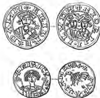
Fig. 5-6. Udmøntninger fra Lund og Randers fra Erik Ejegod (1095-1103). Mønterne fra Lund synes at have en ringere sølvholdighed, mens de jyske mønter tydeligt er af godt sølv. Det er denne jyske udmøntning, der her foreslås at være af halvpenningstandard, og måske efter norsk inspiration.