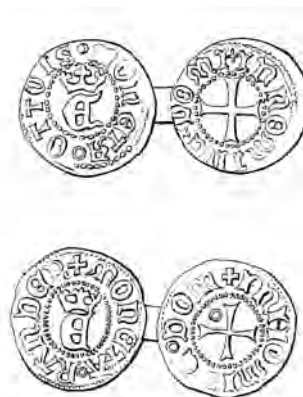
Fig. 16-17. Erik af Pommerns kobbersterlinge fra Odense og Randers. Hvis man dømmes efter mønternes udbredthed, må de være præget i millionvis. Forsiden viser kong Eriks kronede initial, mens den latinske omskrift angiver møntstedet (»moneta«), derefter følger stednavnet, her Odense og Randers. Bagsiden har den fromme devise »In nomine Domini«, »I Herrens navn«, og Randers mønten har i den ene korsvinkel en lille ring. Udmøntningen af disse rene kobbermønter synes at afspejle en bevidst kongelig politik, der tilsyneladende ikke var bange for inflation.

Møntstedet i Lund blev lukket lidt ind i 1440'erne, og i stedet blev produktionen flyttet til Malmø, som i et lille halvt hundrede år, under Christopher af Bajern og Christiern I, var eneste danske møntsted (fig. 18). Der var en kæmpemæssig produktion af danske hvide, små sølvmønter af forholdsvis lav lødighed, som