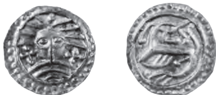
Fig. 8. Sceatta af Wodan/Monster typen, der blev brugt i Ribe i 700-tallet. Målestok 2:1.

Sceattaerne stammer fra det nuværende Holland og England, og man kender snesevis af forskellige typer. 10 Blandt fundene i Ribe udgør en enkelt type, nemlig Wodan/Monster-sceattaen (kaldet således af numismatikere på grund af det skæggede ansigt en face på forsiden og et uhyre-lignende dyr på bagsiden), imidlertid hele 85% af de bestemmelige eksemplarer (fig. 8). En del af mønterne kommer fra udgravninger med fine stratigrafiske lag, der hver