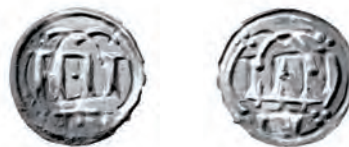
Fig. 11. Penning præget i Hedeby i 900-tallet. Dette eksemplar stammer fra den vestjyske Pilhus-skat, nedlagt efter 983.

Udmøntningen i Hedeby blev genoptaget omkring år 900 efter cirka et halvt århundredes ophør, hvor bl.a. islamiske dirhemer i stor udstrækning var blevet brugt i omløbet. Der prægedes nu på ny efterligninger af Karl den Stores efterhånden temmelig gamle Dorestad-type. Endnu engang er Brita Malmers undersøgelse af møntrækken grundlæggende. Hendes KG 7 stammer fra århundredets første årtier. Dernæst var der måske et ophør i udmøntningen, før KG 8 og 9 blev præget i henholdsvis 950'erne og 960'erne til 980'erne (fig. 11). 36 Fund af disse mønter er almindelige, ikke blot i selve Hedeby, men også adskillige steder i landskabet Angeln, beliggende nord for