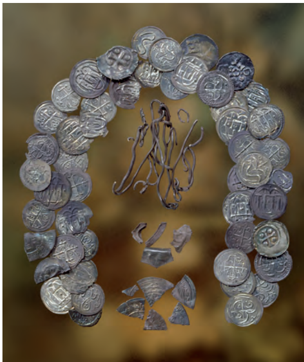
Fig. 13. Pilhus-skatten fra Vestjylland, nedlagt efter 983. De fleste mønter er danske, jf. fig. 11-12. Der ses enkelte tyske penninge samt nogle fragmenter af islamiske dirhemer. I midten sølvgenstande.

en kronologisk udvikling, som vi ikke kan gennemskue. Med denne lille usikkerhed in mente må man imidlertid på forskningens nuværende stade konkludere, at man tilsyneladende har accepteret det umiddelbare naboområdes mønter på lige fod med egne mønter. Den eventuelle møntøkonomi kan således ikke have været perfekt.