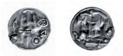
Fig. 10. Penning af Malmers KG 3, sandsynligvis præget i Hedeby i 820'erne. Dette eksemplar stammer fra Lerchenborg/Asnæs-skatten fra starten af 900-tallet.

I Hedeby er der gjort to, måske tre, fund fra 800-tallet. Det første er en lille pung, der blev fundet i vandet. Den er sandsynligvis tabt fra en mole, der blev påvist ved udgravningen. Fundet består af syv mønter, hvoraf seks var KG 3, men ikke nok med det, de var oven i købet samtlige af nøjagtig samme variant, nemlig den med et hus på bagsiden. Den sidste mønt var en karolingisk penning af tempeltypen, præget 822-840. Alle stykkerne var hele og bar ingen tegn på test eller bøjning. 25 Altså en homogen, lokal møntmasse bestående af én enkelt mønttype og uden tegn på fragmentering eller test. Disse forhold mere end antyder reguleret møntøkonomi. Hvis vi derimod ser på det andet skattefund, der består af mindst syv mønter, nedlagt i en krukke, ser billedet helt anderledes ud. Her er der ud over tre KG 3 ligeledes fire islamiske mønter, der er fragmenterede, bøjede og testede. Yngste mønt er fra 867 eller derefter. 26 Altså et typisk vægtøkonomifund, dog med en ikke helt vanlig stor andel af lokale mønter. Endelig kendes et lille fund af to sammenkorroderede mønter, der efter beskrivelsen meget vel kunne være KG 3. 27