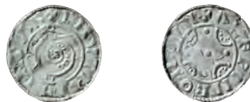
Fig. 15. Penning af den såkaldte orm-type fra den sidste del af Knud den Stores regering (1018-1035), hvor der blev indført en specifik type for hvert møntsted.

Men selvom den nationale udmøntning allerede fra 900-tallets sidste år var omfattende, var den langt fra dominerende i møntomløbet. Skattefundenes sammensætning viser, at engelske og tyske