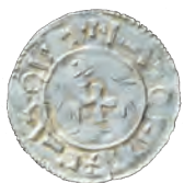
Fig. 6. Bagsiden af sølv-penning præget i Lund under Knud den Store. Adskillige knivhak (pecks), foretaget for at teste sølvetets lødighed.