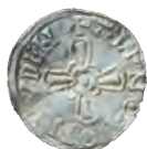
Fig. 7. Bagsiden af sølvpenning præget i Lund under Knud den Store. Kraftigt bøjet for at tjekke sølvetets lødighed. Stammer fra Hågerup-skatten fra Fyn, nedlagt efter 1048.

og kronologiske oprindelse, vil et møntfund fra en møntøkonomi derfor være forholdsvist homogent og dermed let genkendeligt.