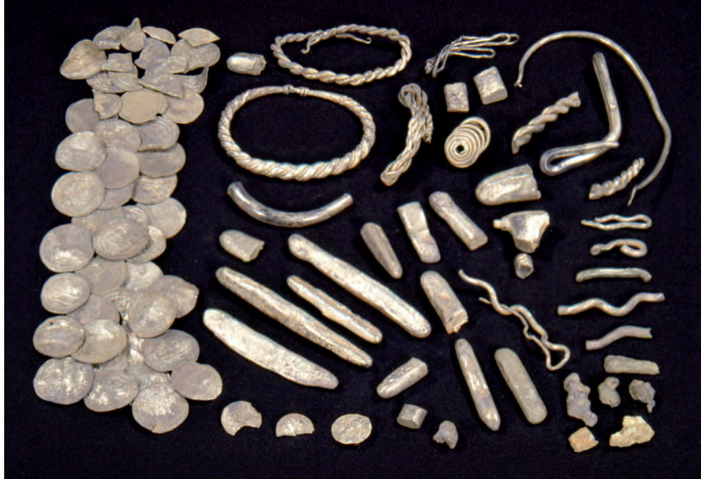
Fig. 3. Typisk vægtøkonomiskat fra Sigerslevøster i Nord-sjælland, nedlagt efter 921. Islamiske mønter til venstre, tre engelske mønter fornedet, sølvbarrer i midten og smykker foroven og til højre.

i en god og stabil mønt og derfor kræver et ordnet møntsystem. Det findes der eksempler på uden for Danmark i senere perioder, f.eks. senmiddelalderens Vendiske Møntforening, der sammenbandt de nordtyske Hanse-stæders møntvæsen. 7