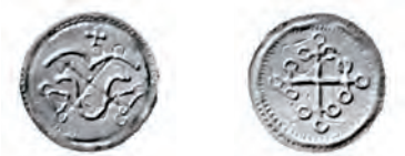
Fig. 12. Penning med korsmotiv præget under Harald Blåtand. Dette eksemplar stammer fra den vestjyske Pilhus-skat, nedlagt efter 983.

Flere forskere har bemærket, at danske mønter i denne periode spiller en langt større rolle i møntmassen end i perioden umiddelbart før, der var helt domineret af islamiske mønter. 42 Faktisk udgør danske mønter flertallet i de fleste af periodens skattefund. Dominans af lokale mønter er et tydeligt indicium