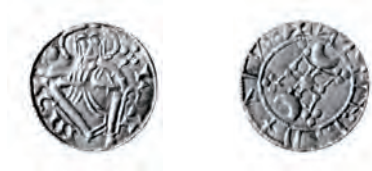
Fig. 16. Penning med rune-indskrift præget i Lund i slutningen af Svend Estridsens regering (1047-1074).