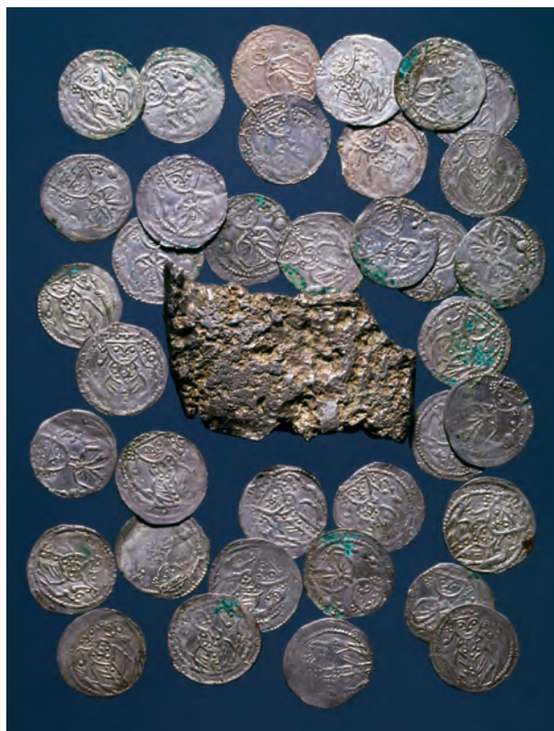
Fig. 2. Typisk møntøkonomiskat fra Glumsø på Midsjælland, nedlagt efter 1157. Alle mønterne er af samme type, præget i Roskilde. De blev – lidt usædvanligt for perioden – fundet sammen med en sølvarre.

Den regulerede møntøkonomis forudsætning er en social konvention om accept af mønternes værdi. I praksis foregår det oftest ved, at samfundets magt-haver udsteder sine egne mønter, som han udsender til en kurs, der overstiger deres metalværdi. En del af forskellen går til dækning af udgifterne ved møntprægning, en del – den såkaldte slagskat – som afgift til møntudstederen. Heri lå møntudstederens motivation for systemet: det gav indtægt. Set fra møntbrugernes synspunkt var fordelene, at en mønt med en accepteret fast værdi var mere praktisk anvendelig end en mønt, der hele tiden skulle vejes og tjekkes. Sy-