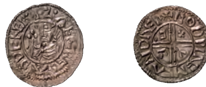
Fig. 14. Penning præget ca. 995 i Svend Tveskægs navn. Efterligner de samtidige engelske mønter. Første danske mønt, der bærer kongens og folkets navn.

Omkring 995 påbegyndtes, sandsynligvis i Lund, en udmøntning af efterligninger af engelske mønter. Nogle enkelte bar den nye konge, Svend Tveskægs (986/987-1014) navn (fig. 14), mens de fleste bibeholdt forbilledernes indskrifter i mere eller mindre korrumpeteret form. En tilsvarende udmøntning fandt sted i Sigtuna i Sverige og – i meget mindre skala –