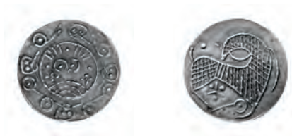
Fig. 9. Penning af Malmers KG 6, sandsynligvis præget i Ribe midt i 800-tallet. Dette eksemplar stammer fra det sjællandske Tørslev-fund, nedlagt efter 940.

Fundmaterialet fra Ribe og omegn er både kompakt og homogent. 21 Kompakt på den måde, at ti 800-tals-penninge fra Ribe og tre fra det nærliggende Okholm udgør et meget stort antal mønter i forhold til andre nordiske pladser fra 800-tallets første halvdel, hvor antallet af fund generelt er minimalt før masseimporten af islamiske mønter mod århundredets slutning. Og homogent, da 11 ud af 12 bestemmelige mønter er KG 5 eller 6. Undtagelsen er en skibsmønt fra Okholm. Den trettende mønt er for dårligt bevaret til at kunne bestemmes. I denne forbindelse bør man notere sig, at der i Ribe og omegn ikke er fundet en eneste karolingisk penning, som – skønt fundene ikke er mange – ellers var den almindeligste mønttype i Danmark på det tidspunkt. 22