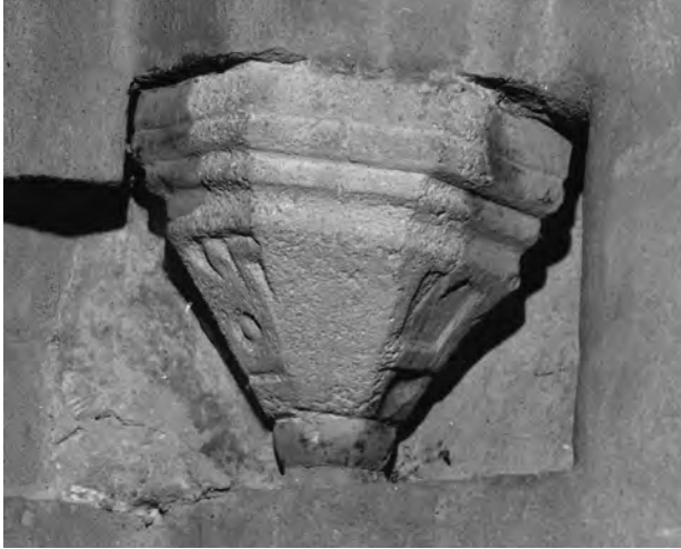
Fig. 4. Konsol III. Foto P. Kujanpää 2008.