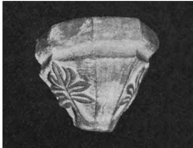
Fig. 9. Konsol VIII. Rinne 1941.