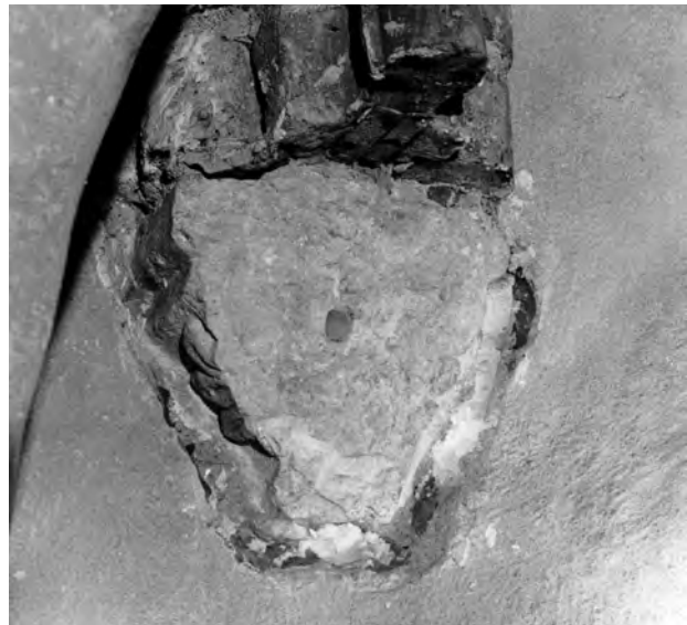
Fig. 3a. Konsol II. Foto P. Kujanpää 2008

III. Bildmotiven på denna konsol är till en del rekonstruerade på 1920-talet och är därför svårtolkade. Till höger, ser man en krona eller två fåglar med stjärtar-