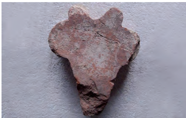
Fig. 11. Formtegel funnet vid utgrävningarna i sakristian 1923. Format 25x19x8,5 cm. Då hittades även rester av tre motsvarande formtegel. Foto K. Drake 2008.

Likka Kronqvist daterade gråstensdomkyrkans sakristia till slutet av 1280-talet. 17 Han utgick då ifrån att den murade domkyrkan började uppföras av biskop Johannes, som kom till Åbo 1286, och att arbetet avbröts 1290 då han blev ärkebiskop i Uppsala. Den följande biskopen för Åbo stift valdes i januari 1291 i domkyrkans sakristia, alltså sakristia 2 enligt Kronqvist. Denna datering kan inte accepteras. Mycket talar för att bygandet av gråstensdomkyrkan inleddes först i slutet av 1300-talet eller omkring år 1400. 18 Kalkstenskonsolerna skulpterades möjligtvis i detta skede, men de kan även vara äldre än så. De kan till exempel ursprungligen ha varit avsedda för en annan byggnad och sekundärt inköpta för gråstenskyrkans behov. Men i varje fall hör de hemma i slutet av 1300-talet, eftersom denna typ av konsoler togs i bruk omkring år 1360. 19