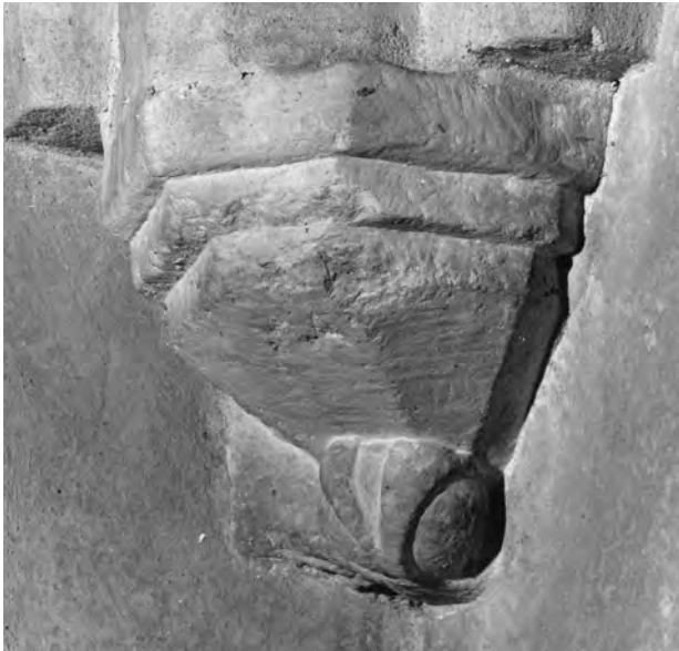
Fig. 5. Konsol IV.