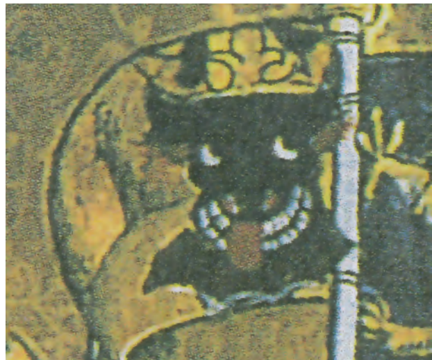
Fig. 3b. Furstätten Mecklenburgs vapensköld. Efter L.-O. Larsson 1997, Kalmarunionens tid.