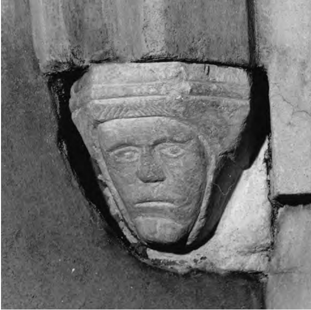
Fig. 7. Konsol VI.

VI. Bildmotivet är ett manshuvud, men knappast en helgonbild, som man kunde vänta sig. Ansiktet är bistert och innefattat i en huvudbonad. De sneda strecken ovanför pannan antyder att det är fråga om en hjälmbrynja. Ingen astragal (fig. 7).