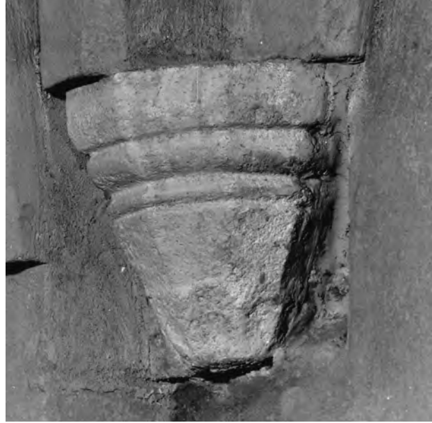
Fig. 8. Konsol VII. Foto P. Kujanpää 2008.

VIII. Konsolens grundform är den samma som i de föregående. Echinus försedd med en slät framsida flankerad av två breda palmer. Ingen astragal (fig. 9).