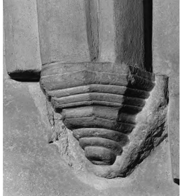
Fig. 6. Konsol V.

na mot varandra. Mittpartiet är tomt och på vänstra, norra, sidan ser man små nischer i två plan (fig. 4).