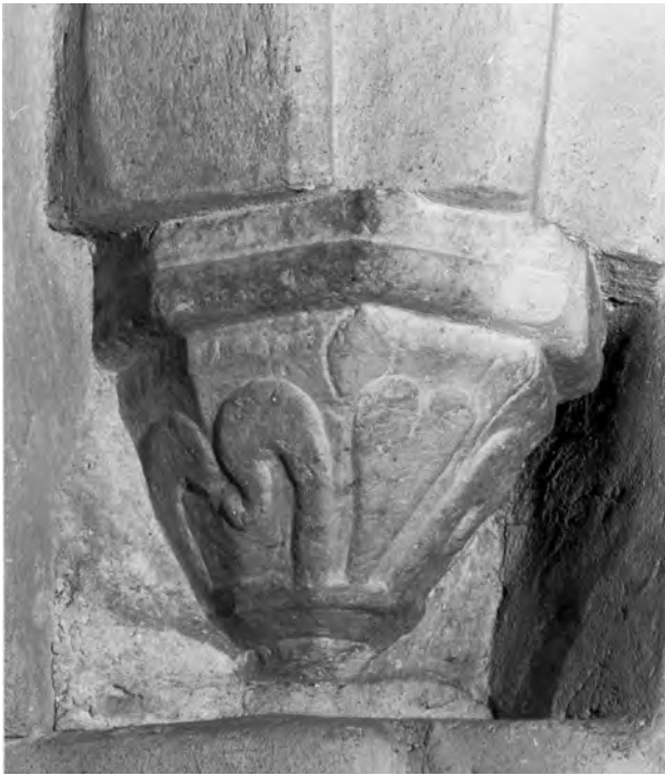
Fig. 2. Konsol I. Foto P. Kujanpää 2008.

flikar ger en antydning om bildmotivet (fig. 3a). Ett borrhål visar att konsolen tydligen har förstörts då sakristian byggdes om 1883. Därförinnan var konsolen synlig i den fyra meter breda nisch, som hade utformats då sakristia 3 uppfördes. Nischen murades igen 1883 och rekonstruerades 1923. Det bortbrutna bildmotivet har tolkats som ett tjurhuvud, den mecklenburgska ättens sköldmärke (fig. 3b). 7 De tre flikarna skulle i så fall vara en del av den veckiga tjurhalsen.