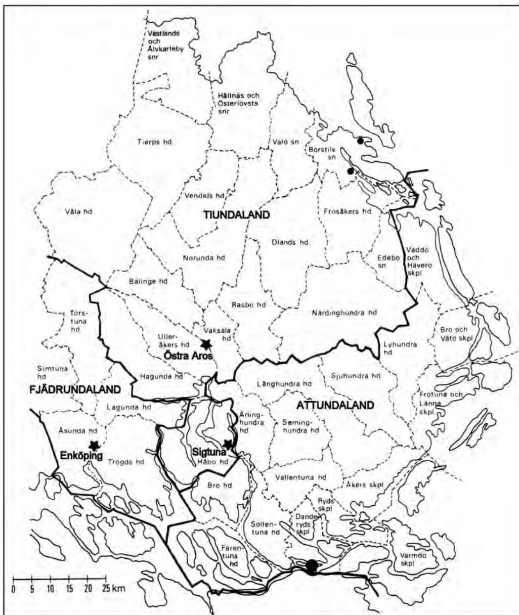
Fig. 1. Upplands folkland och de tre tidiga städerna. Kartunderlag Bonnier 1887.