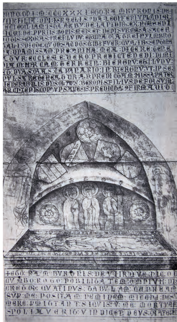
Fig. 5a-b. Ramborg Israelsdotter, Västeråker, Uppland 1327-31.