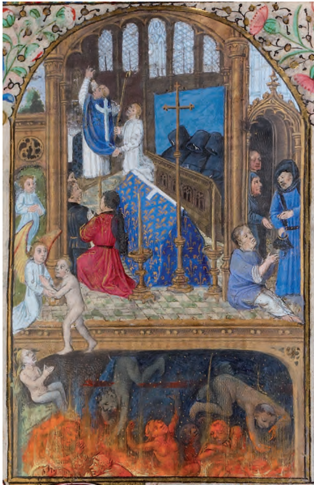
Fig. 1. Begravelsesmesse med sjeler frigjort fra skjærsilden, Fransk timebønebok, Coëviltmesteren, 1460-årene. MS W. 274, f. 118. Detalj.

Forbønnen er en form for bønn, hvor de levende ber for sjelene til de avdøde, det vil si at man henvender seg til Kristus eller en av helgenene for at de skal formidle forbønnen videre. Forbønnen kan enten ut-