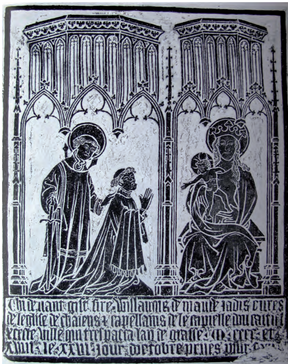
Fig. 8. William de Maude, Tournai, Belgia. 1418.