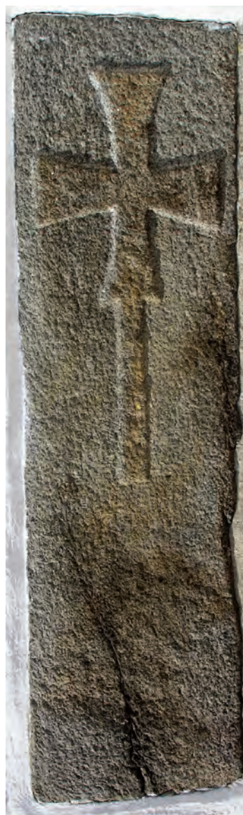
Fig. 2. Korsgravsten, Bodils kirke, Bornholm.

De eldste kristne gravminnene som er bevart i Norden er vanskelige å datere, men de synes å være fra siste halvdel av 1000-tallet i Götaland og ellers fra 1100-tallet. 6 Motivene er dyre- eller rankeornamentikk og vanligvis en form for kors. Oftest er det ingen innskrift. Formålet var å vise en kristen identitet og bevare liket i fred frem til dommedag. Denne type motiver forble vanlige også i gotisk tid. Dette er gravminner som kan ha fungert i en lokal kontekst hvor avdøde var godt kjent og ætteidentiteten kan ha sikret, at han ble identifisert og husket. 7 Dette er uansett gravminner uten noe klart performativt aspekt (fig. 3).