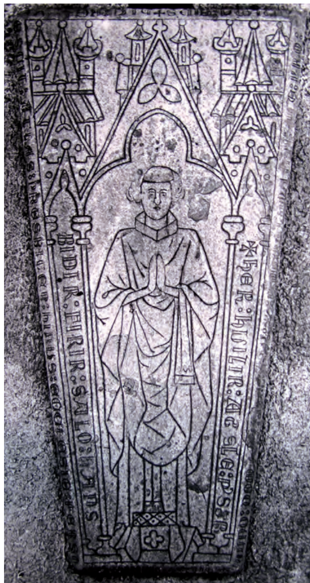
Fig. 4. Astle prest, stenplate, Sakshaug kirke, 1250-1300. Vitenskapsmuseet, Trondheim.