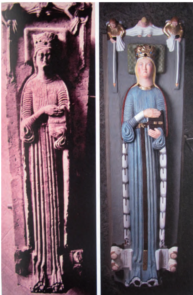
Fig. 3. Dronning Katarina, Gudhem klosterkirke, ca 1250.

Gravminner med avdøde i skulptert eller innrisset helfigur kommer i Norden fra midten av 1200-tallet av. På kontinentet finnes de første eksemplene allerede på slutten av 1000-tallet men også der er det først på 1200-tallet at gravminner med avdøde i hel-