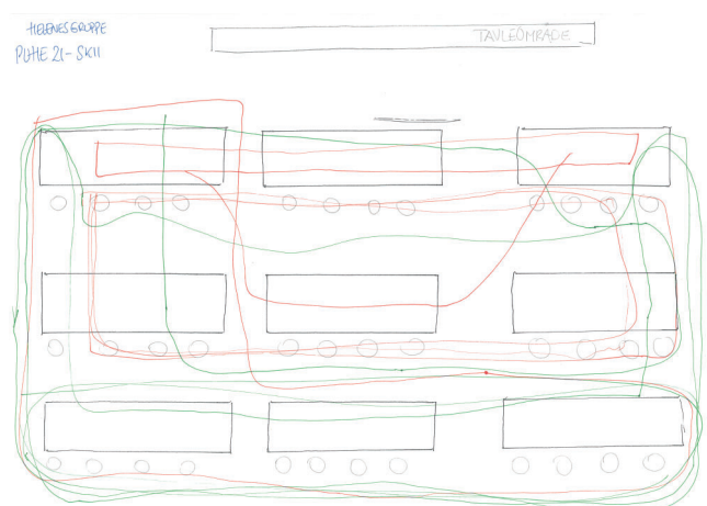
Billede 3. Studerendes frihåndstegning af placeringer og bevægelser i undervisningslokale.

Vi vil her ultrakort berøre nogle af de analytiske indsigter om, hvordan pædagogstuderendes studieliv og læreprocesser udfolder sig i nyere campusarkitekturs rum og indretninger og derigennem tydeliggøre, hvordan uddannelse, studieliv og læring kan betragtes som rytmiske aktiviteter, som plantegningsinterviews er velegnede til at indfange. Vi dykker ned i dele af de studerendes fortællinger om sansninger i relation de tre forskellige lokaleopstillinger, og hvordan der cirkulerer forskellige sansninger og affekter sammen med de tre lokaleopstillinger. Med afsæt i de tre lokaleopsætninger tegner og fortæller de studerende om placeringer i undervisningslokalet, og derigennem får vi tegninger og fortællinger om, hvordan placeringer hjælper til at koble sig