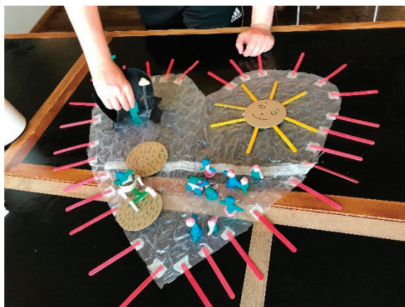
Procesfoto af arbejdet med Grundværdier

Efter et kort oplæg, der etablerede et fokus på Fonden Krobakkens værdier og dermed på den organisatoriske kontekst for udviklingsprocessen, fik deltagerne spørgsmålet: Hvad er det vigtigste i dit arbejde? Som inspiration og kreativt input fik de hver et Go-card 10 at svare ud fra. Herefter drøftede deltagerne deres svar i de teams de arbejder i og kobledede efterfølgende svarene til Fonden Krobakkens værdier. De blev således klogere på hinandens syn på organisationens værdier, de fik diskuteret eventuelle nuancer i værdisæt og værdiernes afspejling i praksis – denne øvelse var indledningen til en større multimodal samskabelsesproces.