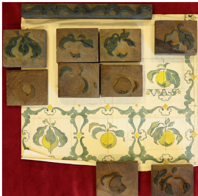
Fig. 7: Tegning på bølgepapir med 'VAS' [Vejle Amts Sygehus] indtegnnet. Borten er tegnet i flere variationer og med varierende midtermotiv. Tilhørende trykblokke er lagt ved tegningen for at vise, hvor mange blokke – trykgange – der hører til gardinet.

Der findes ikke oplysninger om, hvordan Ejnar Hansen farvede sine bloktryk, men til en avis fortæller han i 1920 om de baner, der hænger i Foreningen Dansk Kunsthåndværks Udstilling i Den Frie Udstillingsbygning på Østerbro i København, at de "har været kogt i Sæbe, indtil Farven nøjagtig nåede den Tone, som han ville have frem. Mere Farve kan der ikke gaa af, idet Farven ikke er noget løst påtrykt, der kan fjernes ved Sol eller Luft eller Vask,