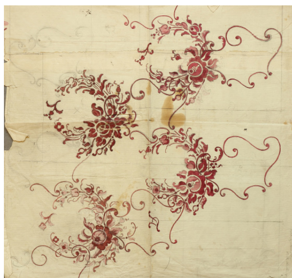
Fig. 17 og 17.1: Gardin og skitsetegning med samme mønster, ens krans med blomsterhoved, blade og stilke, hvorfra udgår slyngede linjer i rokokostil, som forbinder kransene. Motivet har nr. 9 i kataloget og trykkes med rød eller grøn farve på tyndt stof, 95 cm bredt.