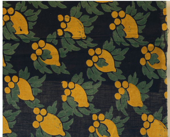
Fig. 9.1: Gardin, trykt på blårlærred, der svarer til en anden tegning med mørkeblå bundfarve og gule citroner. Motivet har Ejnar Hansen således varieret. Gardinet findes ikke i kataloget, men som nr. 14 i prislisten.