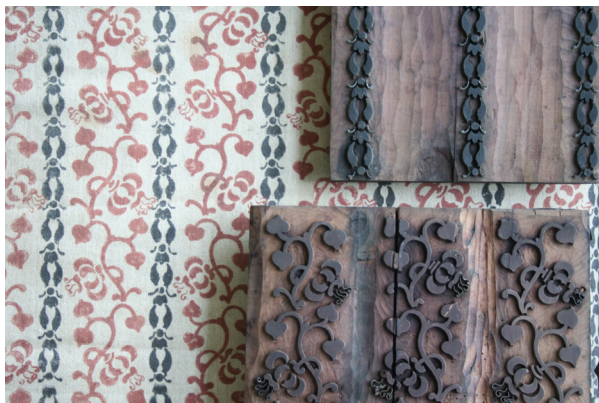
Fig. 12: Gardin med tilhørende trykbløkke. Gardinet har nr. 12 i kataloget og leveres med farverne engelskrødt og sort på blårlærred, 67 cm bredt. Gardinet leveres også uden den sorte smalle stribe som nr. 13, hvorved de røde clematis fremtræder tydeligere. Det var dette gardin, Wenck i 1920 bestilte en prøve af.