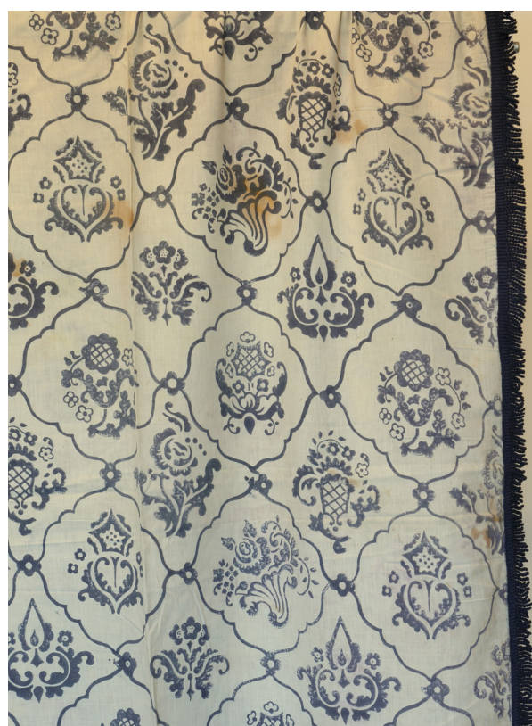
Fig. 8 og 8.1: Skitsetegning og gardin med Ejnar Hansens foretrukne skråtstillede felter med svungne kanter. Rapporten er med forskellige rokokoagtige blomster som midtermotiv. Findes som nr. 7 i kataloget og leveres med blå farve på tyndt stof 95 cm bredt.