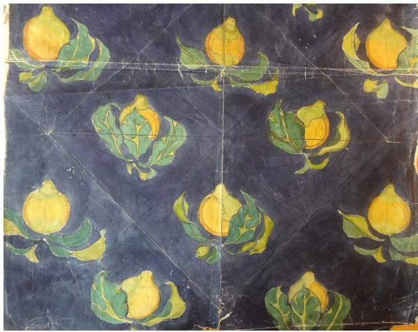
Fig. 9: Farvelagt tegning på bølgepapir med mørkeblå bund og citroner i skråtstillede rækker. Samme citron, der er brugt på gardinet til VAS.