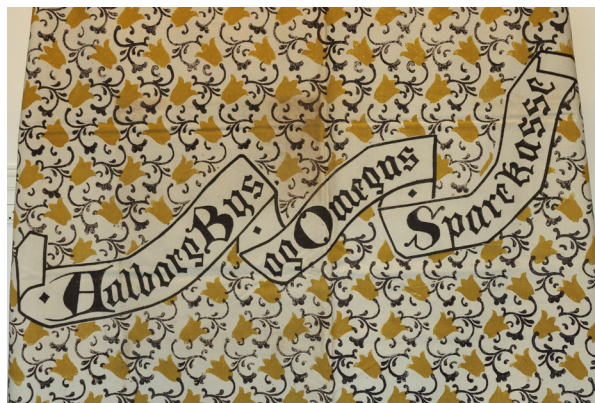
Fig. 13 og 13.1: Gardin med påskeliljer og tilhørende to trykbløkke. Gardinet har nr. 3 i kataloget og var en bestilling med indsat skrift: 'Aalborg Bys og Omegns Sparekasse'. 'Gardinet er trykt på groft lærred, 145 cm bredt. 'Anvendt med For og sorte Frynser som Trækgardin. Udføres med gule Klokker, grønne eller sorte Ranker uden Skrift, paa tyndt 95 cm bredt, Stof og paa indigoblaa Bund med gult og grønt.'