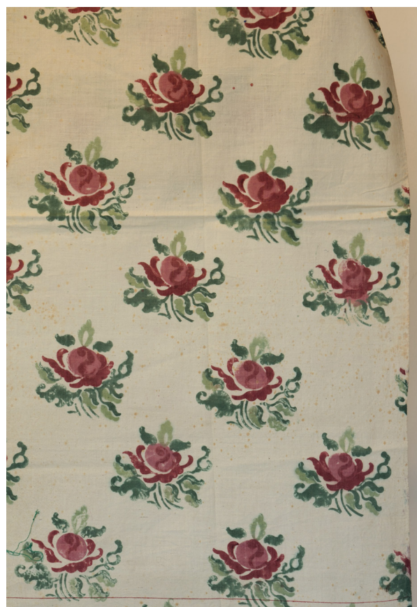
Fig. 11 og 11.1: Gardin og to trykblokke. Ifølge kataloget nr. 5, trykkes gardinet med to røde og to grønne farver på tyndt stof, 95 cm bredt. Det var flere af denne type, der leveredes til Ollerup gymnastikhøjskole i 1920.

Sommeren 1920 er travl, idet Arne også skaffer kontakt til professor Wenck [Statsbanernes ledende arkitekt], der er i gang med at bygge en elevskole med store vinduer [tegning i brevet af vinduet] 2,50 meter høje og 1,40 meter brede, der skal have sidegardiner og kapper. I givet fald skal det være rokokkomønsteret i rød farve på svært tvistlærred [blårlærred]. Wenck vil også gerne have en prøve tilsendt af nr. 13 med rød farve på svært tvistlærred. Der er tale om en ordre på 16 fag gardiner med frynser. Arne har givet en pris på kr. 70 pr. fag. Wenck vil dog lige undersøge priser og forslag hos Olesen [firmaet C. Olesen, Kastrup, København]