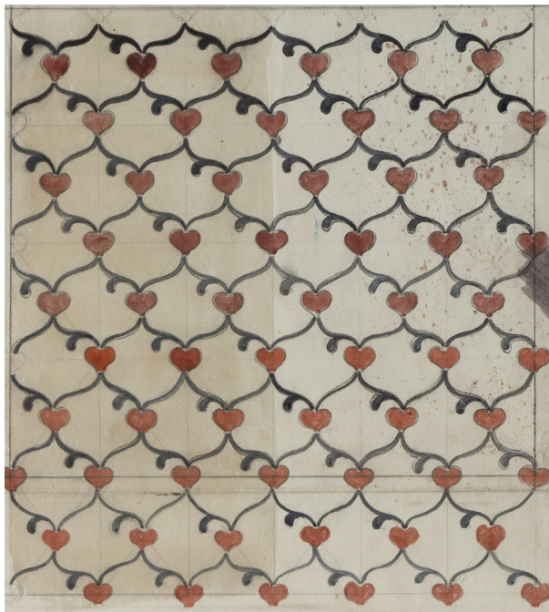
Fig. 5: Tegning på bølgepapir, sign. 'Vejle D. 17.-1-19 Ejnar Hansen 2 Blokke, N 4'. Et meget enkelt mønster med lidt skæve hjerter. Findes i kataloget som nr. 11.