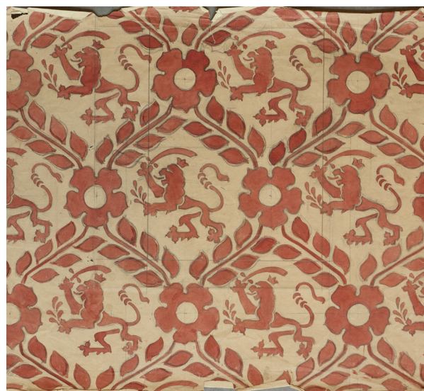
Fig. 3: Tegning på bølgepapir. En variation over de rombformede felter og med fjerkanter. I feltet en oprejst løve. På bestilling indsættes f.eks. foreningsnavn som 'DKS' i den lille runde krans. Findes som nr. 1 i kataloget og som nr. 4 med englehoved i stedet for løven.