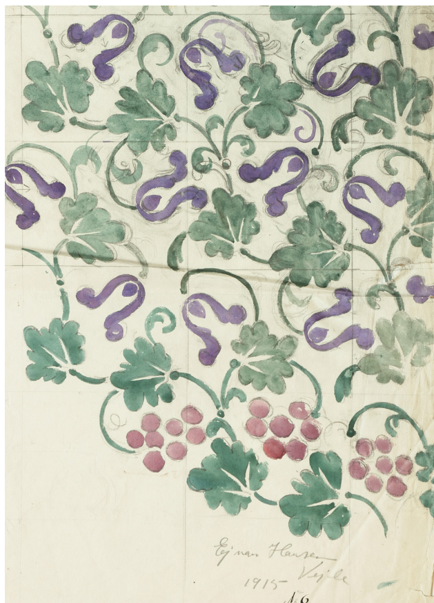
Fig. 4 Skitse på manifold: slyngede stilke, bredt blad, blomst i silhuet og frugter. Sign. 'Ejnar Hansen, Vejle 1915 No 6'. Motivet findes i flere variationer.

Et fladedækkende mønster med stiliserede clematis, slyngeformede stilke og fligede blade er malet med enten en farve, f.eks. mørkeblå, grå eller grøn, men der findes også udkast, malet med røde blomster og grønne stilke med blade. På en anden tegning er der strøet gule påskeliljer over hele fladen, der synsmæssigt er forbundet med grønne eller sorte stilke. Til en bestilling eller forespørgsel på gardinprøve til Vejle Amts Sygehus findes forskellige udkast til en bort, der både går vandret og lodret. Der er tre forslag til indramninger af borten, hvert med forskellige former for midtermotiv i de firkantede felter. Ved andre tegninger er midtermotivet klippet ud, og der er forsøgt at sætte et andet motiv ind for at se, hvordan det tog sig ud. Ejnar Hansen har fabuleret frem og tilbage over hvert eneste mønster eller rapport.