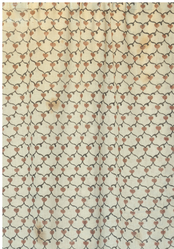
Fig. 5.1: Gardin, der svarer til tegningen. Ifølge kataloget oplyses, at det er trykt med engelsk rødt og sort, leveres på tyndt stof i 95 cm bredde eller blårlærred, 67 cm bredt.