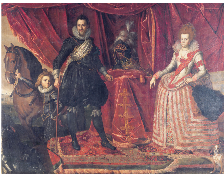
Fig. 1: Maleri af Christian IV og dronning Anna Cathrine, nok malet som dobbeltportræt omk. 1612 efter to enkeltportrætter. Portrættet af dronningen var fra ca. 1600 og malet af ukendt kunstner.

De kongelige regnskaber for årene 1588-1660 indeholder flere udgiftposter for tekstiler, possement, kniplinger, dragttilbehør og andet indkøbt i årene, hvor Anna Cathrine var dronning, men om nogen af disse kniplinger eller dragttilbehør som hatte, rosetter, engelske strømper og andet, skulle bruges sammen med de fem sæt klæder indkøbt i Brussel, fremgår desværre ikke.