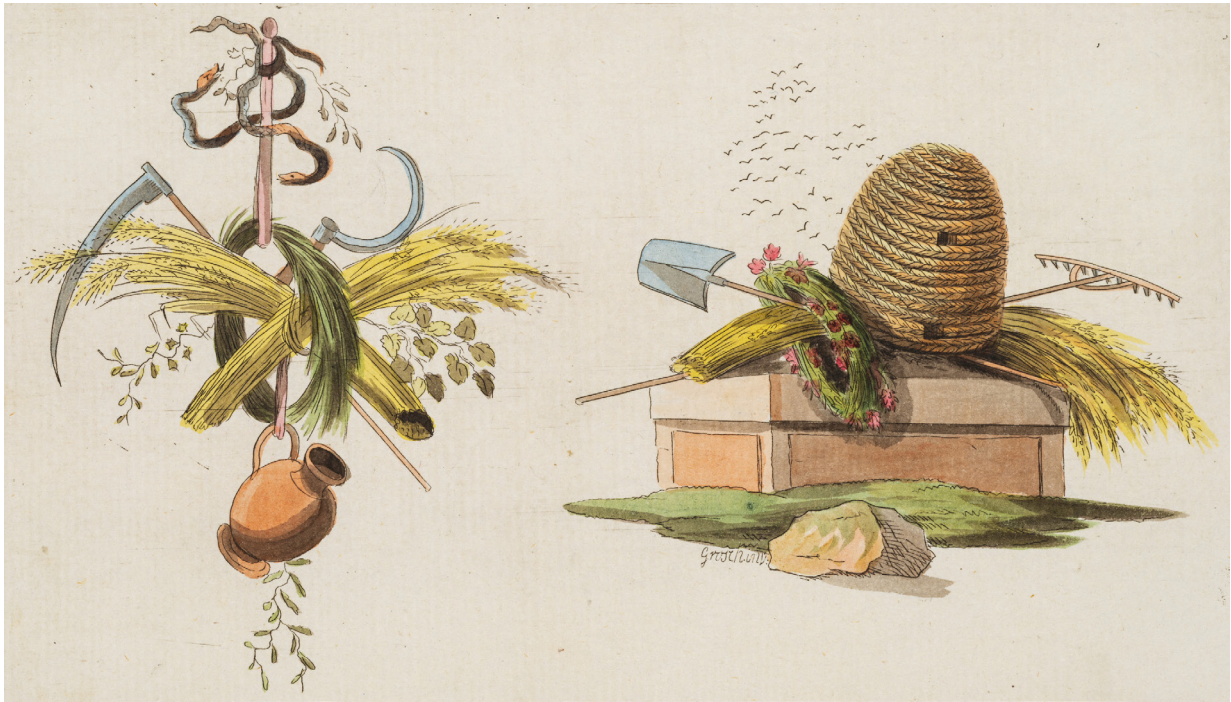
Fig. 2: Tegning, 10,5x18,5 cm, i mønsterbog, beregnet til silkebroderi. Motiverne er symbol på fælles flid og sparsommelighed, til venstre med kornneg, segl og le til at dyrke jorden, og til højre en bikube med sværmende bier. En blomster- eller bladkrans symboliserer udødelighed, fromhed og herskerstatus. Henrik August Grosch: Haandbog til Brodering og Tegning, første Deel , 1794. Designmuseet.

franske filosoffer, hvor målet var at bevidstgøre den store almue, både på landet og i byerne, til at tage del i samfundsudviklingen og forbedre produktionen ud fra devisen om, at alle har ret til det gode liv. Da kvinderne udgør halvdelen af befolkningen, skal de også med i udviklingen, og eftersom de altid har taget sig af familiens og husholdets fremskaffelse af beklædning og boligtekstiler, var det nærliggende at inddrage tekstiler som middel til bevidstgørelse.