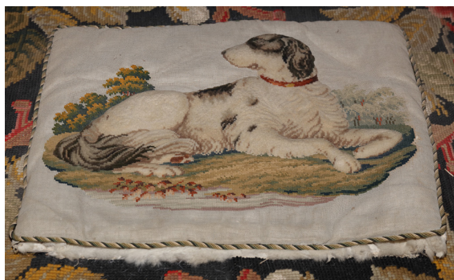
Fig. 14: Fodpude af hvidt stout, broderet med uldgarn i korssting med motiv af en liggende hund. Ifølge kunsteliten burde man ikke sidde og trampe på sin hund. Motivet er derfor ikke egnet til pudens formål. Jægerspris Slot.

Det duer ikke med europæisk indflydelse af mønstre, motiver og former, eller at den nationale udbredelse sker gennem ukontrollerede kanaler som f.eks. Nordisk Mønster-Tidende. Sådanne broderier formidler ikke dansk national bevidsthed efter C. Nyrops mening.