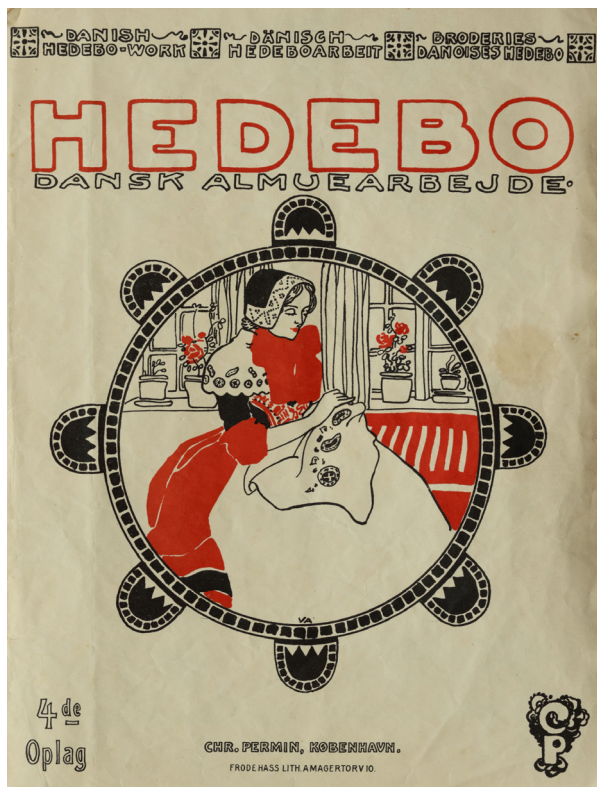
Fig. 10a: Hefte, 28x21 cm, udgivet ca. 1905 af broderifirmaet Chr. Permin, København. Omslaget, tegnet af arkitekt Valdemar Andersen, signalerer danskhed til overflod i farver og med den populære udklipshedebo overalt.