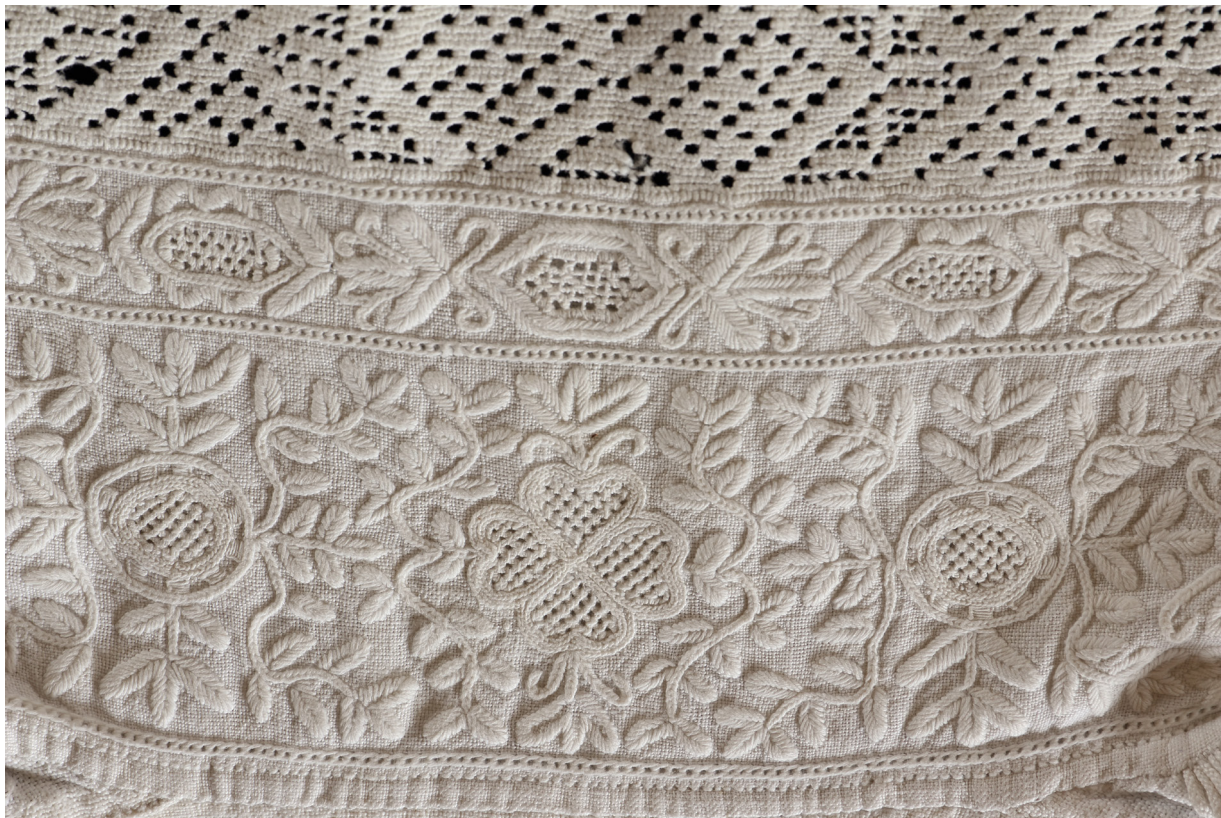
Fig. 7: Udsnit af særkekrave, 12x16 cm, broderet med hvidsøm og kantet med en syet blonde. Særken er syet af hjemmefremstillet hørlærred, broderet med do. hørtråd. Motivet består af traditionelle, lidt stiliserede blomstergrunde, kantet med kædesting og omgivet af slyngede bladranker med blade udfyldt med tyksyning. De slyngede bladranker kendes fra f.eks. Peter Quentels mønsterbog fra 1529. Privateje.

sælger broderier til de københavnske borgerfruer, som er betaget af det smukke hørlærred, pyntet med reliefagtige broderier.