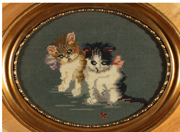
Fig. 6b: Ovalt skilderi, 27x34 cm, med stramajbroderi af de to kattekillinger fra Nordisk Mønster-Tidende . Privateje.

Fig. 6a: Side fra Nordisk Mønster-Tidende med to kattekillinger på stramaj, beregnet til et vægbillede eller pude med en sødmefyldt tekst: 'Alt, hvad der bevæger sig, fængsler en Killing og de to paa Billedet er meget betaget af Situationen'. Nordisk Mønster-Tidende 1931 nr. 3. Aller Media A/S .