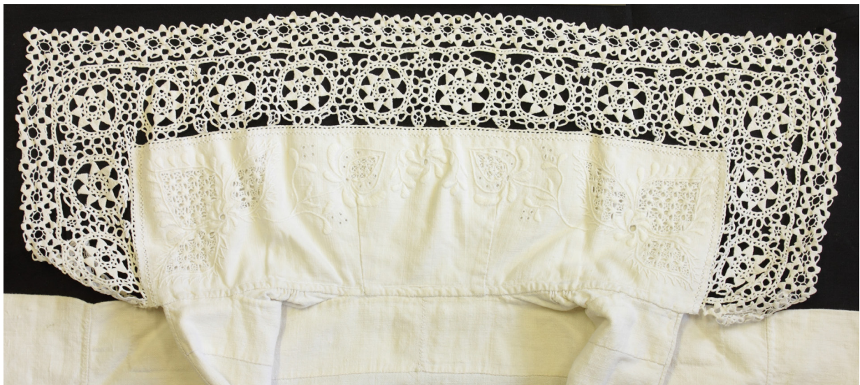
Fig. 11: Særkekrave med en bred bort af hedebo knipling, syet sammen af hedeboringer og stjernefigurer. Hedeboringer syes med knaphulssting som ringe ved brug af en hedebo pind. Museet Sønderkov, HBV16x70.

Bernhard Olsen er begejstret for maske- og de første udgaver af kniplingssyning, da den er helt efter kunstindustriens program og udviklet med rod i historisk broderi, udformet efter de givne råmaterialer fra den hjemmedyrkede hør samt uld fra egne får, forarbejdet i hjemmene til