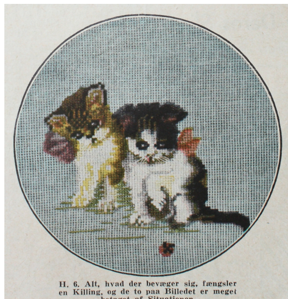
H. 6. Alt, hvad der bevæger sig, fængsler en Killing, og de to paa Billedet er meget betaget af Situationen.

Fig. 6a: Side fra Nordisk Mønster-Tidende med to kattekillinger på stramaj, beregnet til et vægbillede eller pude med en sødmefyldt tekst: 'Alt, hvad der bevæger sig, fængsler en Killing og de to paa Billedet er meget betaget af Situationen'. Nordisk Mønster-Tidende 1931 nr. 3. Aller Media A/S .