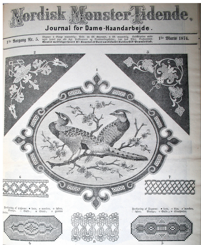
Fig. 5: Nordisk Mønster-Tidende 1874 nr. 5: Forsiden har tætsiddende mønsterforlæg. Ovalen i midten med de to fugle er i kunstsyning, omgivet af en kartouche [udskåret ramme] i nyrenæssancestil, er tænkt til at pryde en skrivemappe. Fuglene sys med fladsyning i silkegarn med flere nuancer. Kartouchen er applikeret af sort fløjl, kantet med point-russe sting. De to trekantede hjørner er med molsapplikation. Hæklede borter og korsstingsbånd er andre modeller.

Der bringes modeller, velegnede til børn, som de selv kan sy til gaver. Teksterne bliver mere og mere følelsesladede og handler om at sy broderier til de forskellige årstider og højtider, at hygge om familien og at tænke over farvesammensætningerne. Til hvert af boligens rum, der