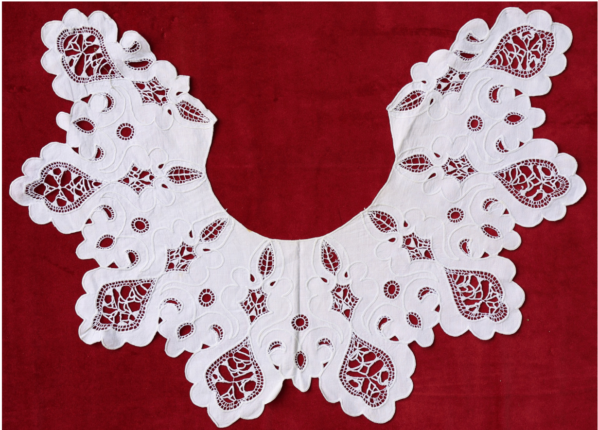
Fig. 15: Krave i udklipshedebo af maskinvævet hvidt lærred, broderet med hvid bomuldstråd. Kravens bølgeformede kant er formet efter de udklippede dråbeformede figurer, udfyldt med "edderkopper" og markeret med tungestingsrækker. Broderet på Ollerup Folkehøjskole omkring 1920. Museet Sønderkov HBV-sag 1837.

og behjertede husflidsledere, der mener, at bønderpiger ikke skal bruge deres tid på finere broderier, men på at lappe og stoppe familiens og husholdets tøj 19 .