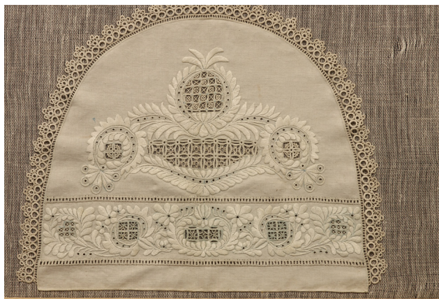
Fig. 13: Tehætte af fint hørlærred, broderet med glansfuld hørtråd i "ny hedebo", bestående af små kvadratiske baldyringsgrunde, omgivet af blade i tyksyning.

Emma Gad, hendes udstillinger og medlemmernes arbejder får ofte omtale i dagspressen, Kvindernes Blad og i Louiseforeningens [Dansk Kunstflidsforenings] blad. Emma Gad skriver selv i forskellige tidsskrifter om foreningen og skolen.