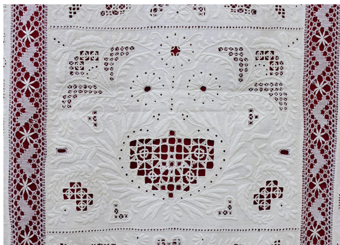
Fig. 9: Parti fra stolpeklæde, Hedeboegnen, udført af hørlærred, broderet med hørråd i baldyring, bestående af åbne grunde, hvor trådene er trukket ud og syet over med knaphulssting, hvorved det kan virke som et ”gitterværk”, omgivet af blade, broderet med tætte fladsyningssting. Stolpeklædet er broderet med årstallet 1843, senere syet sammen ved hjælp af kniplinger med to andre stolpeklæder til en dug. Privateje.

i en moderne ånd, syet af amatører fra beskedne landsbyer med sans for det ornamentale og en stilrigtig graciøs placering. Det er almindeligt i de nordiske lande, at fornemme fruer fra staden synes om almuens arbejder og derfor køber dem...”. 8 Desuden roser Carl von Lützov de danske nationaldragter på ” Kostumefigurer ”.