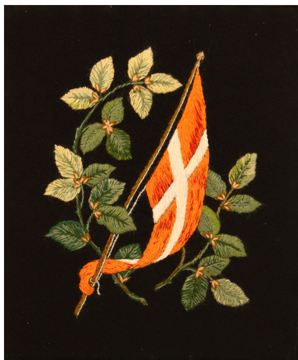
Fig. 1: Broderet Dannebrogflag, ophængt i ramme som et maleri, der fortæller, at beboerne er national- og dansksindet. Udført i slutningen af 1800-tallet på sort uldstof, og broderet med rødt, hvidt og grønt uldgarn. Privateje.

Den danske nationale kamp faldt sammen med den nationalromantiske bevægelse, der prægede Europa gennem 1800-tallet, hvor de enkelte stater søgte efter deres egen historie og rødder. Denne var en følge af oplysningstiden, der fra midten af 1700-tallet var præget af tyske og