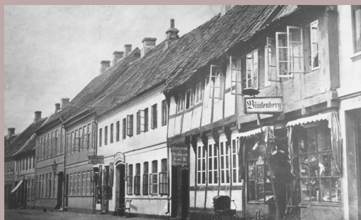
Nederdammen 33 i Ribe – en kulturhistorisk fortælling om huset og dets beboere fra 1650 til 1976