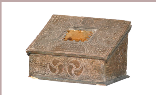
"Fri os fra Det Onde" – et pilotprojekt om Danmarks magiske beskyttelsesmærker