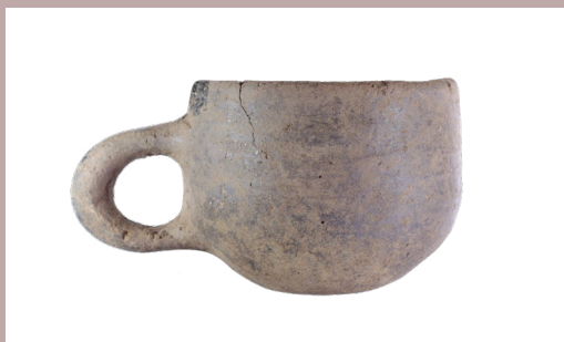
Mad til dagligdag og fest – om fødevarer og landbrug i ældre jernalder ved Tjæreborg Nord