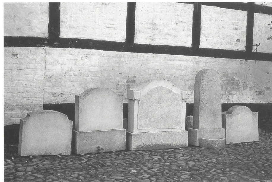
Fig. 2. De fem gravsten, der nu befinder sig på Den antikvariske Samling, er eksempler på hver sin type. Der er tale om uferdige sten - stenhuggerens del af arbejdet mangler. ASR 1242.

Fra lageret i Høm er der nu indbragt eksemplarer af fem forskellige gravstensmodeller. Ingen af