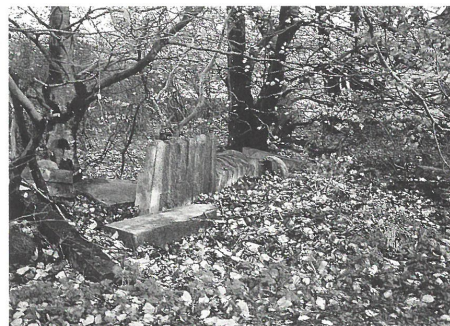
Fig. 1. Et restlager af bl.a. gravsten ses gennem elmetræets nedfaldne blade. De mindste er helt skjult.

Oplysningen vakte fagfolkernes interesse, og vi kørte til Høm og besøgte dette lager. Det ligger midt