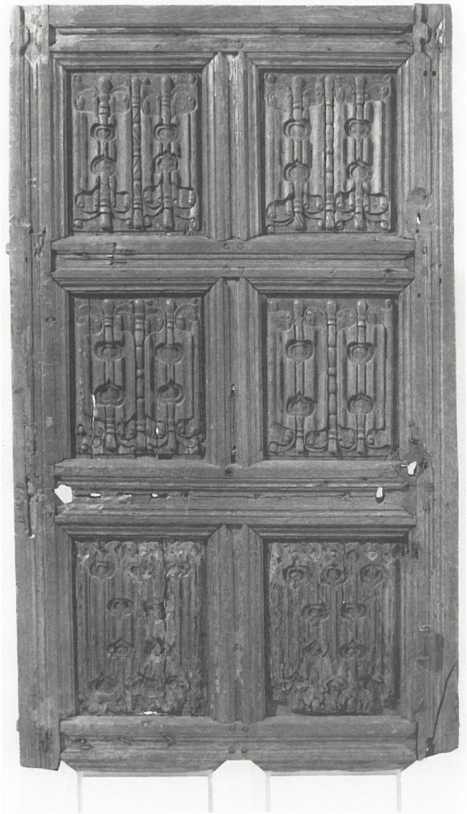
Fig. 1. Dør fra "Maren Spliids hus", dendrokronologisk dateret til tidligst i 1560'ernes begyndelse.

Døren, fig. 1, er nu 135 cm høj og 78 cm bred, og