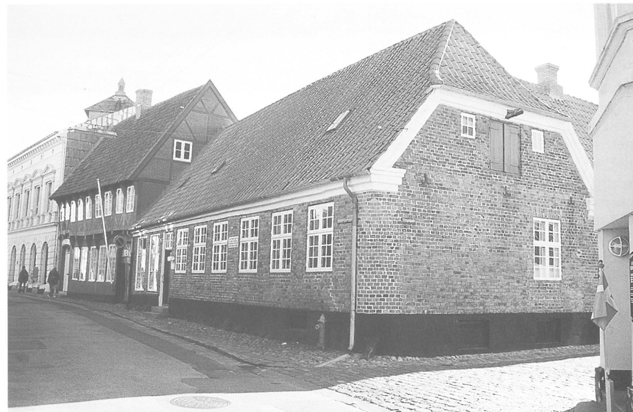
Fig. 3. Grundmuret hus fra 1847 i Sønderportsgade 3 i Ribe, "Maren Spliids hus".

og 1. oktober 1845 slog lynet ned i tårnet i Vester Vedsted Kirke, hvilket resulterede i, at det udbrændte totalt, mens resten af kirken fik mindre skader. I forlængelse af genopbygningen af tårnet og renoveringen af kirken og kirkerummet i øvrigt blev materialer og genstande, der ikke kunne genanvendes, solgt på en auktion den 4. december 1847. Ved renoveringen var kirkens adgangsforhold blevet ændret. Våbenhuset i syd blev revet ned, syddøren tilmuret - norddøren var tilmuret allerede i midten af 1700'erne - og den nye indgang etableret gennem tårnets vestmur. Herved var to døre blevet overflødige. I genopbygningskontrakten fra 1845 står opført, at fire nye døre skulle udføres: de to lige omtalte samt sakristidøren og døren i sakristiets østvæg. Ifølge auktionsprotokollen 10 solgtes fem døre heraf en, der kun omtaltes som gammel, mens de øvrige enten havde jernbånd eller vinduesglas. Det er derfor ikke usandsynligt, at den ekstra dør, der afhændedes ved auktionen, kan have været en gammel dør, der havde ligget på loftet. Den købtes af Anders Jessen fra Tandrup. En anden relevant og interessant oplys-