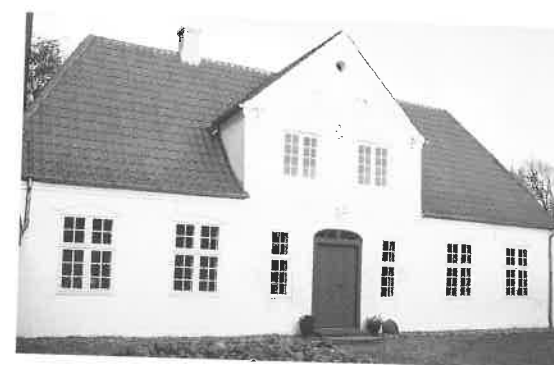
Fig. 3. Hovedbygningen.

år ældre taksation ved oplysningen om, at nordlængen nu er på 14 fag - hvoraf de 10 er til beboelse og resten stald og lo - medens vestlængen er reduceret til 10 fag. Nordlængen oplyses nu at være af grundmur, medens vestre og søndre længe fortsat fremtræder i en blanding af bindingsværk og grundmur. Man må derfor tro, at den ændrede fordeling af fag i hhv. nord- og vestlænge skyldes, at vestlængens nordlige del er blevet omsat i grundmur sammen med nordlængens resterende bindingsværk.