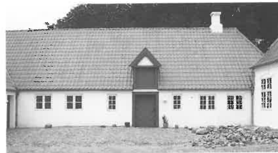
Fig. 9. Nordlængen efter opførelse af nye vestfag og kvist samt reablering af dør.

Contemporary stove in reestablished hall.