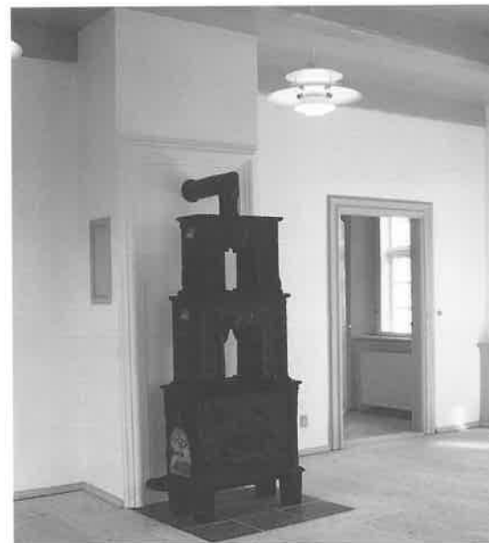
Fig. 10. Samtidig ovn i reableret sal.

Produktionsskolen blev hurtigt en succes med deraf følgende pladsmangel. Denne pladsmangel lod sig afhjælpe ved nybyggeri på de nedrevne bygningers plads samt ved istandsættelse og delvis nyindretning af de fredede bygninger. Man befandt