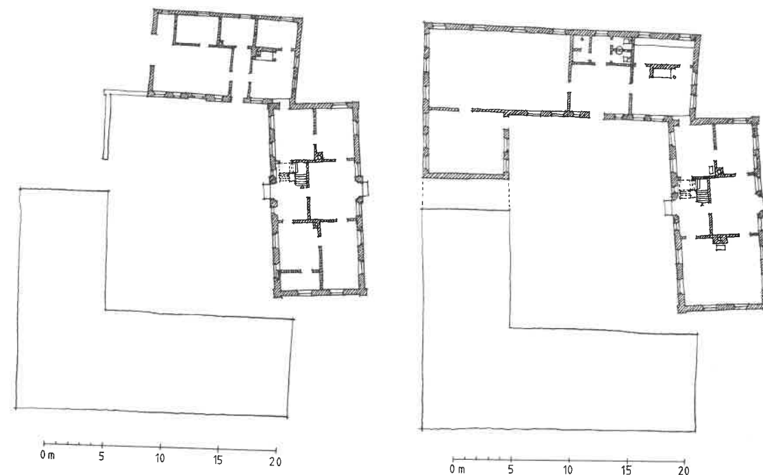
Fig. 2. Plan - før og efter. Tegning: SMS.