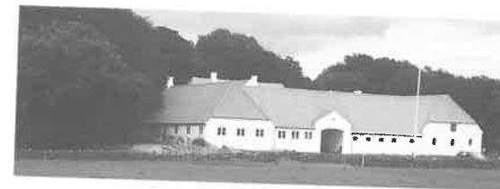
Fig. 7. Lustrupholm set fra vest efter reetablering af avlsbygninger.

Lustrupholm seen from the west after partial demolition of the north and west wing.