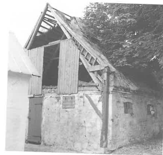
Fig. 5. Rester af vestlængens bindingsværk. Bemærk det store kopbånd mellem port-stolpen og bjælken. Bemærk også den oversavede portoverligger samt taphullet fra kopbåndet mellem portstolpe og overligger. Foto: Nat. Mus. 1961. Neg. nr. R 12148.

Hovedbygningens indretning er den oprindelige, og det samme gælder det meste af rumudstyret: Enfyldingsdøre med tilhørende gerichter og indstemte kasselåse, forstuens treløbs mæglertrappe med brædebalustre og overetagens "chatol", som i kvistværelset mod haven camouflerer den indbyggede kasse, der er nødvendig for at opnå tilstrækkelig frihøjde over trappens midterste løb. Under restaureringen dukkede desuden en velbevaret alkovefront op bag senere beklædning på kvistværelsets sydflunke. Lågerne i både alkove og chatol har affrisede, marmorerede fyldinger. Selve alkoven synes imidlertid at udelukke tilstedeværelsen af en samtidig, d.v.s. oprindelig skorsten i underetagens sal. Hovedbygningens nordøstre rum viste sig desuden at indeholde to tilmurede, indvendige skabe - ét mellem vinduet og den nordligste tværskillevæg (hvilket forklarer, hvorfor der kun er ét vindue på denne side af midterpartiet) og ét ved siden af nordgavlens vindue. Alle lofter har været bjælkelofter med fladstafprofilerede bjælker, og alle skillevægge er pudsede bindingsværksvægge. Alle vægge har oprindeligt fremtrådt kalkede.