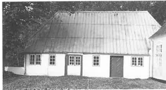
Fig. 8. Nordlængen efter nedrivning af de vestligste fag og efter sløjfning af kvist og flytning af dør.

The north wing after demolition of the western bays and attic and removal of door.