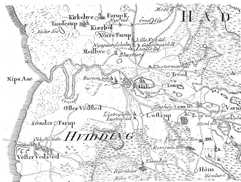
Fig. 1. Oversigtskort. Udsnit af Videnskabernes Selskabs kort fra 1804.

ste af amtets herregårde. Estrup ved Vejen var blevet næsten fornyet i 1721, og Hesselmed vest for Varde var genopført efter brand i 1745. På Søviggaard nordvest for Varde blev den nuværende hovedbygning opført i 1766, og på omtrent samme tid blev en beslægtet hovedbygning opført på Visselbjerg sydvest for Varde (nedrevet i 1975). I 1768 afsluttedes en gennemgribende ombygning af Sønderkov ved Brørup. I sidste halvdel af 1770'erne blev Nørholm nordvest for Varde opført. I midten af 1780'erne blev Bramming Hovedgaard og Lundrup ved Varde opført, og på Endrupholm nord for Bramming blev en fornyelse af gårdens bygninger afsluttet kort efter 1800.