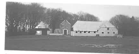
Fig. 6. Lustrupholm set fra vest efter delvis nedrivning af hhv. nord- og vestlænge.

Hovedbygningen og nordlængen blev i 1945 fredet efter bygningsfredningsloven, og voldstedet blev fredet som fortidsminde efter naturfredningsloven i 1973.