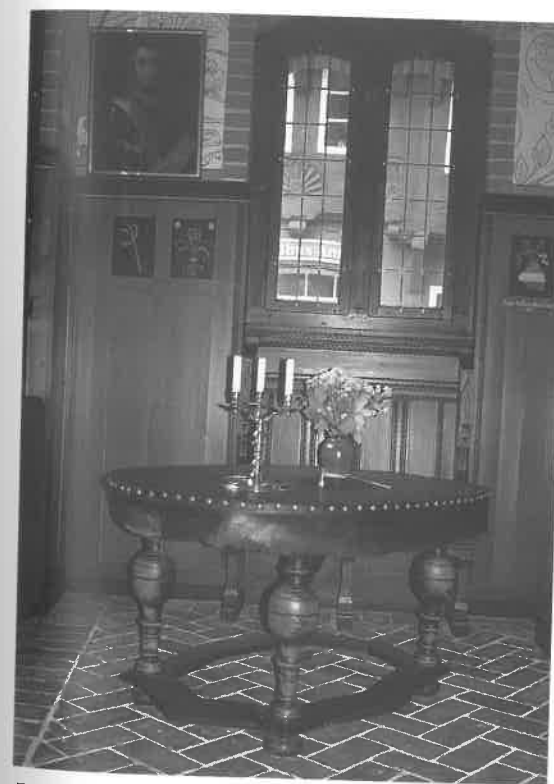
Fig. 5. I 1708 blev det gamle rådhus i Grønnegade fraflyttet, og i 1709 rykkede man ind i den bygning, der i dag kaldes "Det Gamle Rådhus". En af nyanskaffelserne var et bord, sandsynligvis dette ovale bord med den lederbetrukne bordplade.

In 1709 the city council moved into "The Old Townhall". This table was probably bought at that time.