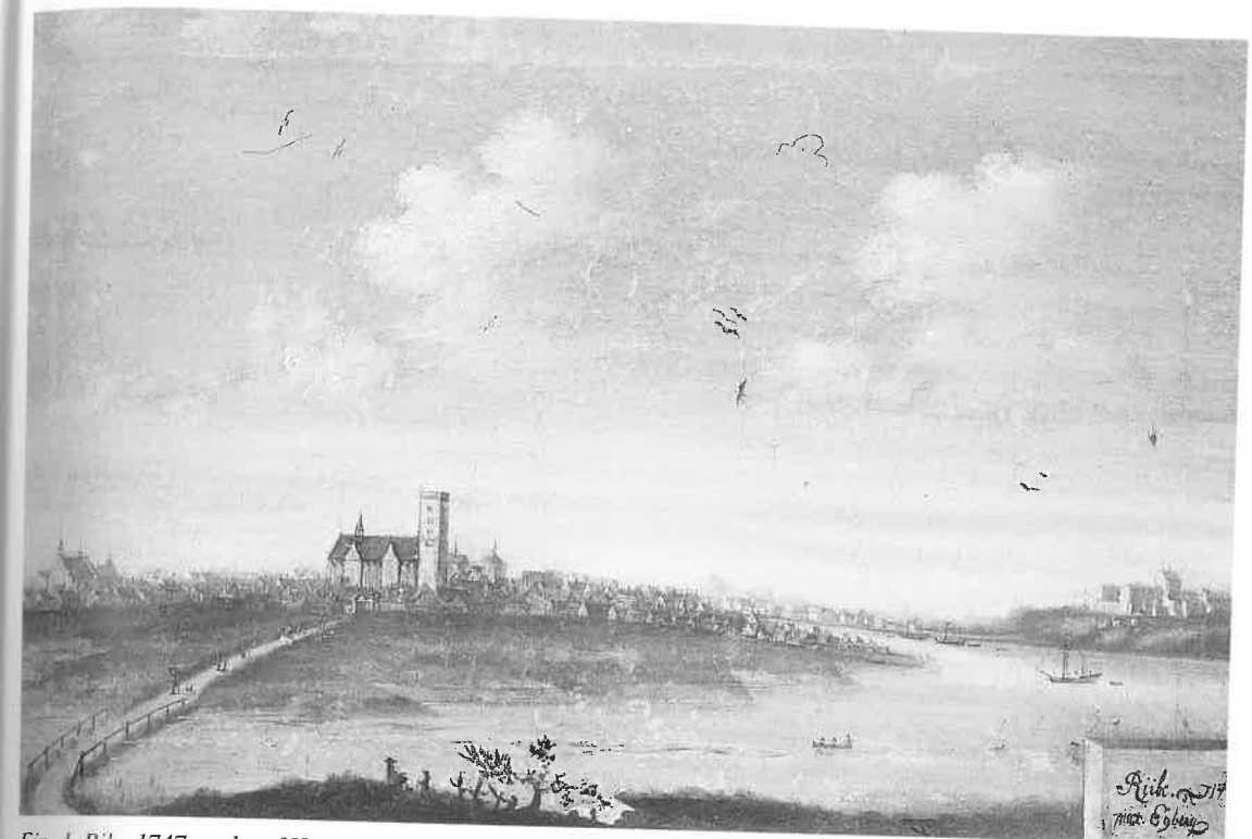
Fig. 1. Ribe 1747, malet af Hans Heinrich Eegberg.

Hertil kom, at også militæret i begyndelsen af 1700-tallet udgjorde en stor økonomisk belastning for den danske befolkning i såvel fredstid som under krigene. Ikke blot havde Danmark en stor flåde, men riget var også blevet et af de mest militariserede lande i Europa: hvor der sidst i 1600-tallet var én soldat for hver 50 indbyggere, var der i begyndelsen af 1700-tallet én soldat for hver 25 indbyggere. Kun Sverige og Preussen havde en lignende høj grad af militarisering. Militæruddgifterne udgjorde selv i fredstider mindst halvdelen af statens udgiftsbudget, og indkvarteringsbyrderne lå tungt på de danske købstæder 4 . Af byernes korrespondance med kongen og den centrale administration fremgår det, at de ofte forsøgte at slippe for denne byrde - eller det mindste at få den lettet lidt. Dette gjaldt også