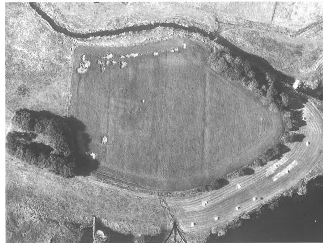
Fig. 4. Luftfoto fra 1963 over området hvor Seem Kloster har ligget. Søgegrøfterne var placeret på den ydre halvdel af næsset.

Air photograph from 1963 of the area Seem monastery has been situated. The excavation ditches were placed in the outer half of the headland.