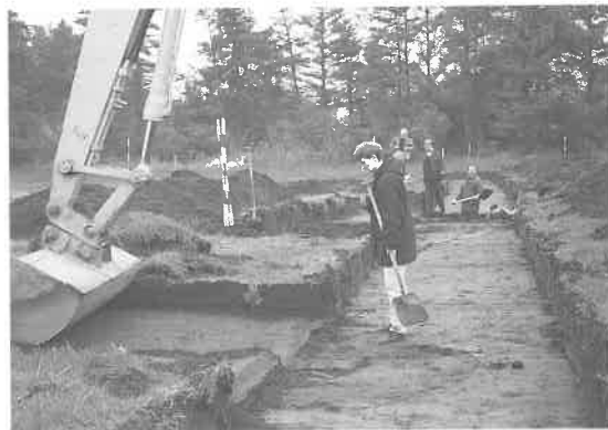
Fig. 2. Den antikvariske Samlings inspektørgravning på Lustrupholm torsdag d. 24. september 1998.

The excavation by the curators of the Antiquarian Collection at Lustrupholm on Thursday 24th of September 1998.