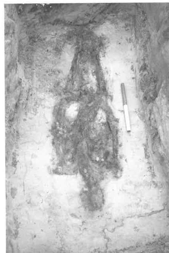
Fig. 3. En af de to undersøgte grave ved Munkesøen viste sig at rumme en 'hoveddrumsgrav'. Over den døde lå et trælæg, der hvilede på tværgående træstykker.

The excavation by the curators of the Antiquarian Collection at Lustrupholm on Thursday 24th of September 1998.