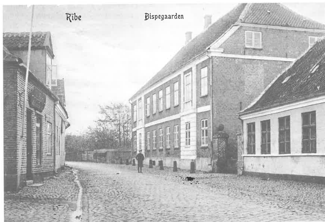
Fig. 8. Korsbrødregård, nuværende bispebolig i Ribe, Korsbrødregade. Facade omtrent som ved opførelsen omkring 1801.

Korsbrødregård in Korsbrødregade, Ribe. Jetzige Bispenresidenz. Die Facade sieht fast wie im Baujahr um 1801 aus.