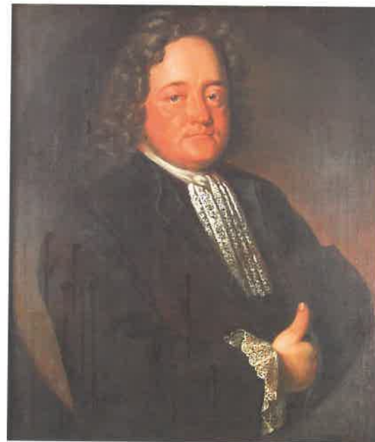
Fig. 2. Rasmus Hansen Roager, død 1720. Usigneret portræt. Privateje.

Rahrs Hof in Ribe. Ein sehr gut erhaltenes Ribe-Hof in Sønderportsgade 37. Jetzt mit Privatwohnungen eingerichtet.