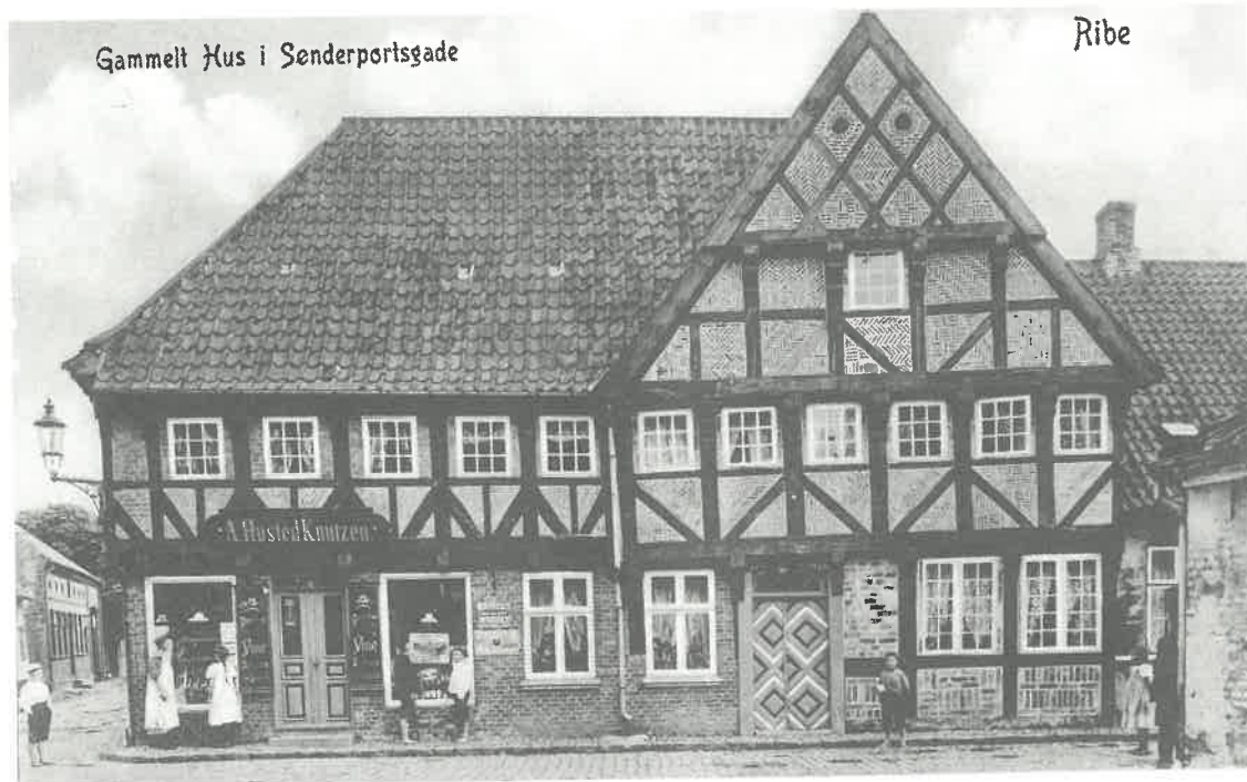
Fig. 1. Den rahrskes Gård, Sønderportsgade 37 i Ribe. En sjældent velbevaret og restaureret Ribe-ejendom. Nu indrettet som ejerlejligheder.