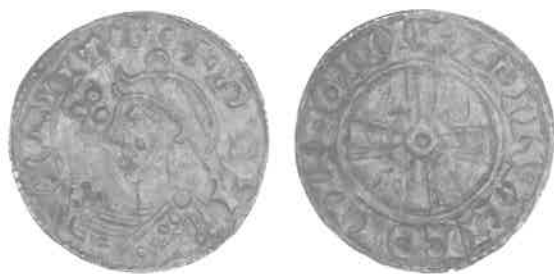
Fig. 5. Expanding Cross-efterligning uden kendt fundsted, 2:1. Den kongelige Mønt- og Medaillesamling.

Expanding Cross imitation without recorded find spot, 2:1. The Royal Collection of Coins and Medals.