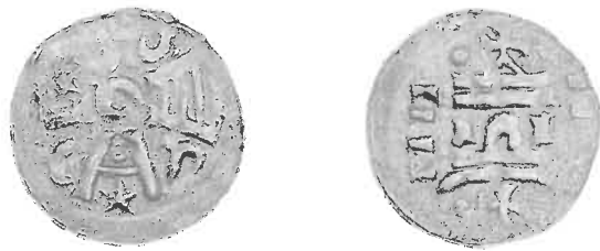
Fig. 10. Bardowiek, agrippiner, obol (halvpenning), 2:1.