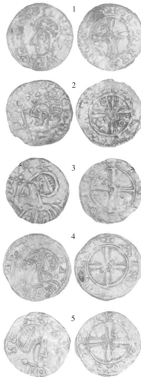
Fig. 4.1-4.5. Expanding Cross-efterligninger fra Danelundskatten, 2:1.

Danelundskattens mønter udviser imidlertid en række besynderligheder (fig. 4). For det første er portrættets stil primitiv. Der er dog så megen variation på stilen af de ægte engelske mønter, at dette i sig selv ikke skulle være alarmerende. Men derudover er mønterne så dårligt præget, at man faktisk sjældent kan læse hele indskriften. De ægte engelske mønter er næsten altid velprægede og fuldt læselige. For det tredje giver de stumper af indskrift, man kan læse, ingen mening. Det er bare en række bogstaver samt trekanter og streger, der ikke danner ord. På de engelske mønter er indskrifterne altid fuldt læselige. For det fjerde er vægten alt for lav: de 47 hele mønter vejer mellem 0,35 og 0,73g med et gennemsnit på 0,52g. For de ægte engelske mønter findes flere vægtstandarder, nemlig ca. 1,63-1,77g, ca. 1,12g og ca. 0,8g 12 , dvs. betydeligt højere end Danelundmønterne. For det femte forsvandt de engelske Expanding Cross mønter gradvist fra omløbet i England efter indførelsen af en ny type ca. 1053 13 , så det er ikke videre sandsynligt (om end ikke helt umuligt), at en stor gruppe af disse mønter skulle have overlevet helt til 1080'erne, da Danelundskatten blev nedlagt. Sidst, men ikke mindst virker metallet som en legering med lav sølvholdighed – der er tydelige tegn på korrosionsnedbrydning af mønten