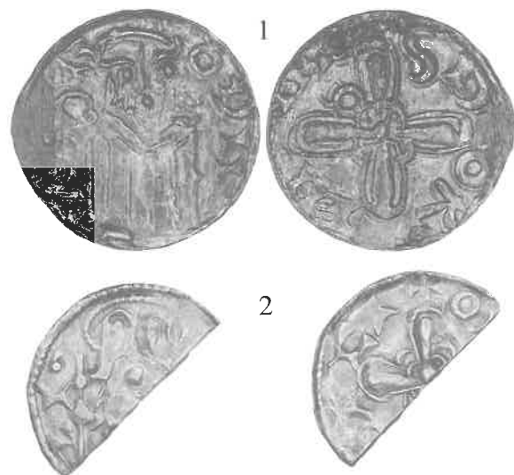
Fig. 7.1-7.2. Harald Hen (1074-80), penninger, ukendt jysk møntsted, 2:1.

Sven Estridsen (1047-74), penny with runic inscription, 2:1.