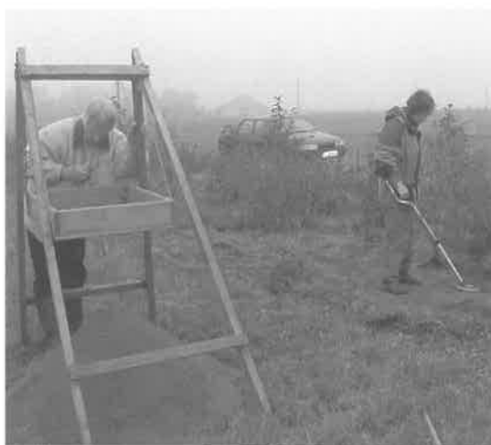
Fig. 2. Ved bjergningen af skatten blev der både anvendt metaldektektor og sigtning af jorden, så alle smådele kom med, både metal og tekstil.

During the recovery of the hoard, the archaeologists used metal detectors as well as sieving.