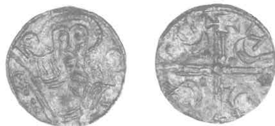
Fig. 6. Sven Estridsen (1047-74), runemønt, 2:1.

Dernæst følger tre mønter fra Harald Hens (1074-80) tid. Læsningen af den ene er uden problemer; den tilhører kongens regulære udmøntning i Lund, hvor der er en helgenfigur med korsstav til højre og et såkaldt køllekors på bagsiden 22 . Rundt om korset læses møntmesternavnet Othalric