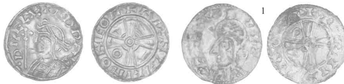
Fig. 3. England, Edvard Bekenderen (1042-66), penning af typen Expanding Cross, 2:1. Møntmester Arngrim i York. Dette eksemplar stammer fra en skat fundet i 1861 i Lyngby i Nordjylland.

Den mest spændende gruppe mønter i Danelundskatten er ubetinget dem, der er præget efter engelsk forbillede. Gruppen udgør 63 ud af fundets 72 mønter, dvs. næsten 90% af det samlede antal. Forbilledet er den engelske type Expanding Cross, der blev præget i kong Edvard Bekenderens (1042-66) navn (fig. 3). Forsiden viser kongens buste med diadem i profil mod venstre med kongenavn og -titel i omskriften. Kongen holder et scepter foran sig. Bagsidens kors bliver bredere og