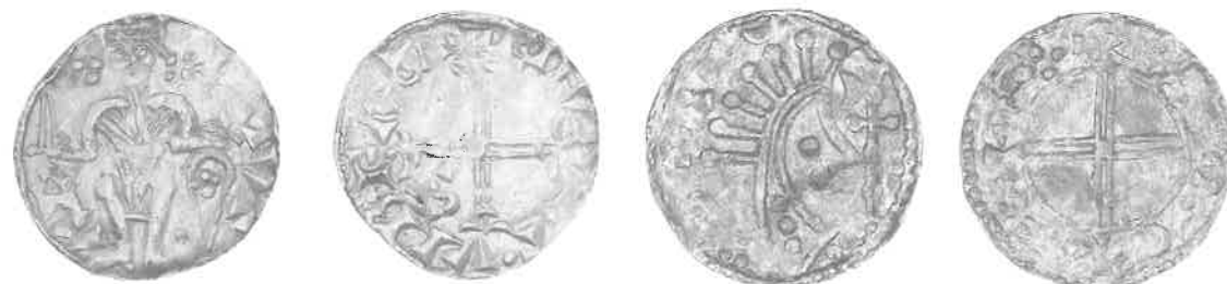
Fig. 8. Knud den Hellige (1080-86), penning, møntmester Edvard i Viborg, 2:1.

samt møntstedet LVI, dvs. Lund. Vægten 0,91g falder fint indenfor, hvad man forventer for denne type 23 . De to andre mønter er en variant af samme type med bispestav til venstre i stedet for korsstaven på forsiden. Denne type kendes fra møntstederne Lund, Thumatorp i Skåne og Viborg 24 . På stykkerne fra Danelund giver indskrifterne imidlertid ikke mening, og det er ikke muligt at bestemme prægestedet. Et af stykkerne har en ring i en af korsarmene på bagsiden (fig. 7.1). De allerede kendte Viborg-eksemplarer viser også en sådan ring. Det samme gør et eksemplar med forvirrede indskrifter, der for nogle år siden dukkede op på Grædstrup Kirkegård mellem Horsens og Silkeborg 25 . Fundstederne Grædstrup og Danelund sammen med den tydelige henvisning til Viborg på tilsvarende stykker tyder på, at hele denne gruppe mønter med cirkel i en korsvinkel og forvirrede indskrifter stammer fra Jylland, uden at man præcist kan afgøre møntstedet. Det kan faktisk dreje sig om endnu en Ribe-udmøntning, men her er vi ude på hypotesernes ikke-underbyggede gebet. Henførelsen til Harald Hens tid bygger i øvrigt udelukkende på typesammenfaldet med denne konges Lundudmøntning. Mønterne kan teoretisk også stamme fra Haralds efterfølgers, Knud den Helliges, tid.