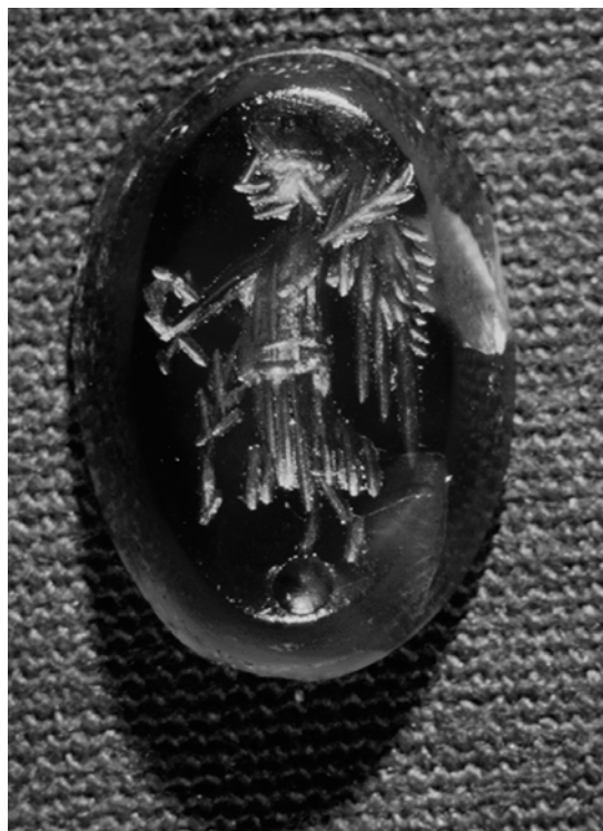
Fig. 4. Karneol gemme, Victoria. Kat. nr. B 6. ESM 2249x77.

Graven er på grund af sit indhold foreløbigt dateret til ca. 300, hvilket ikke modsiges af gemmen, der kan sammenlignes med gemmer med et lignende Victoriamotiv, som dateres til det 2. årh 7 .