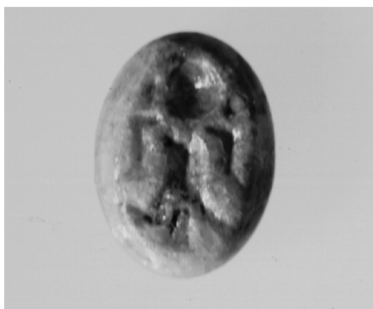
Fig. 3. Glaspaste, "mandsling". Kat. nr. A 9. ASR 1357x45.

A9. Glaspaste, fig. 3 (inv. nr. ASR 1357x45, blok B, anlæg A4, lag 4, felt MID, 8. årh., fundet