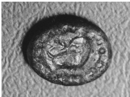
Fig. 2. Glaspaste, ørn med palmegren i næbbet. Kat. nr. A 8. ASR 9x508.

A8. Glaspaste, fig. 2 (inv. nr. ASR 9x508 felt MSP, fase C, ca.725 - 750/60, fundet ved Posthusudgravningen 1990-91). Halvgennemsigtig, i modlys ravfarvet glasmasse, 13,5 x 1,1 x 0,4 mm. Formen er oval med flad overside, afrundede sider