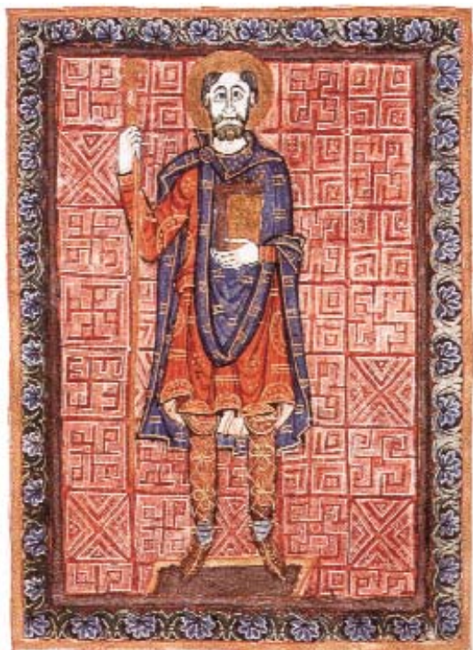
Fig. 2. Heinrich der Zänker, illustration fra kontinentalt manuskript fremstillet i Regensburg i slutningen af 900-årene. På hertugens højre skulder ses en lille fibel, der holder på hans kappe. Denne fibel er af samme type som f.eks. katalog nr. 16, der er fundet på Gl. Hviding – en cirkulær fibel med central indfatning omgivet af små fordybninger (efter Hedegaer Krag 2003 s. 68).

Heinrich Zänker, Illustration eines kontinentalen Manuskripts am Ende des 10. Jahrhunderts in Regensburg hergestellt. Auf der rechten Schulter des Herzogs kann man eine kleine Fibel sehen, die seinen Mantel zusammenhält. Diese Fibel ist als Typus mit Kat. Nr. 16 identisch, die in Gl. Hviding gefunden ist – eine kreisförmige Fibel mit zentraler Einfassung, von kleinen Vertiefungen umgeben.