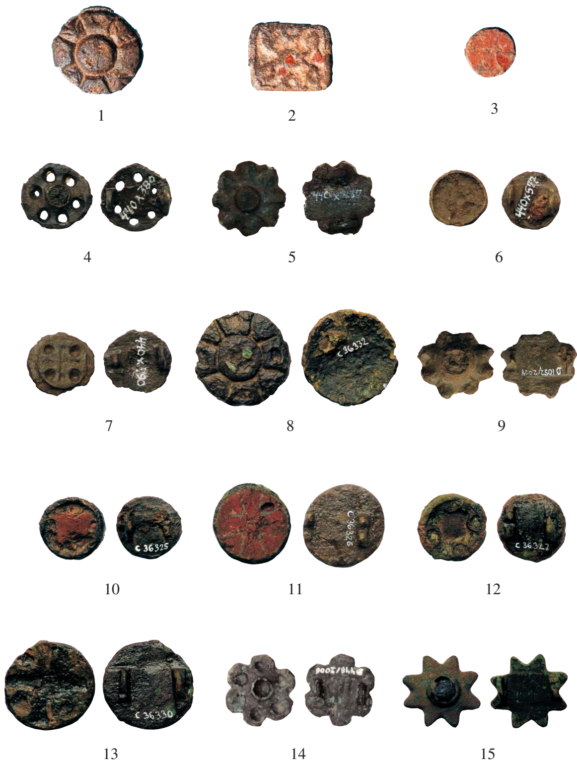
Tavle 1-2. Fiblerne fra Sydvestjylland, numrene refererer til kataloget. 1:1.