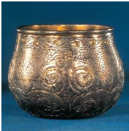
Fig. 3. Det såkaldte Ribe-bæger er produceret kort før år 800 på det europæiske kontinent, men det er fundet i 1908 i jorden ved Ribe Bys Nørremark i forbindelse med markarbejde.

Der sogenannte Ribe-becher ist kurz vor 800 auf dem europäischen Kontinent hergestellt worden, ist aber auf einem Feld im nördlichen Ribe 1908 in Verbindung mit Feldarbeit gefunden worden.