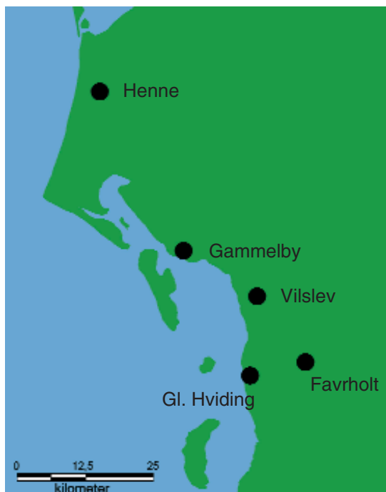
Fig. 1. Fundsteder for emaljefibler i Sydvestjylland. Tegning: Claus Feveile.

forskellige former for indlægninger af glas. Emaljefiblerne dateres overordnet til vikingetiden og den tidlige middelalder, og de har deres nærmeste formgivningsmæssige paralleller på det europæiske kontinent, hvor de betegnes som fibler af karolingisk-ottonske typer. 1 Jævnligt dukker de nu op i det ganske land, men intet steds er koncentrationen så stor som på Ribe-egnen, hvor der alene på lokaliteten Gl. Hviding, sydvest for Ribe, er fremkommet intet mindre end 22 eksemplarer. 2 Til sammenligning kan lokaliteten Sebbersund i Nordjylland nævnes. Her ses den næststørste forekomst af disse fibler med blot otte eksemplarer. 3 Gl. Hviding er dog ikke alene i området om denne forekomst, både lokaliteterne Vilslev, Henne, Gammelby og Favrholt har også leveret deres eksemplarer, og i alt er der i Sydvestjylland fundet 27 stk. (se tavle 1-2, kat. nr. 1-27).