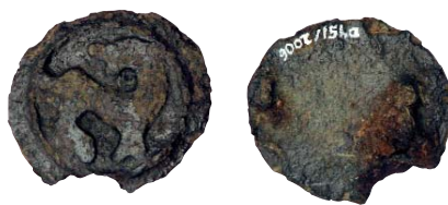
Fig. 4. Cirkulær skivefibel fundet på Gl. Hviding (inv.nr. ASR1375x13). Denne tilhører ikke de karolingisk-ottonske fibler, men er derimod med større sandsynlighed produceret i det nordiske område. Den har artsfæller blandt de danske fund. Blandt disse kan det, hvor bevaringsstilstanden tillader det, fastslås, at her er tale om et dyr i den såkaldte Jellingstil, dvs. en nordisk dyrestil fra 900-årene. Største diameter 2,3 cm. 1:1.

Det kan dog ikke udelukkes, at nogle af fiblerne kan være hjemligt produceret efter udenlandsk forbillede. Det hjemlige tekniske niveau var bestemt højt nok. Men hvis vi antager, at det er tilfældet, ville man formentlig ikke benytte sig af det, med mindre man tillagde genstandstypen nog-