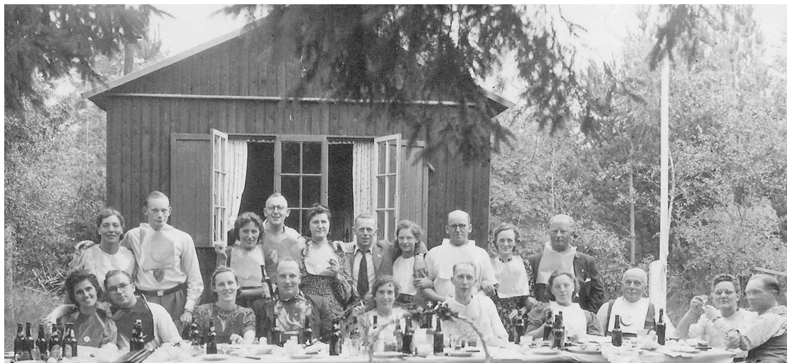
Fig. 4. Jagthytten i plantagen set fra vestsiden en fin sommerdag. Foto: Tilhører Jørn Rasmussen. Ribe.

Hunting lodge in the plantation, seen from the west on a fine summer day