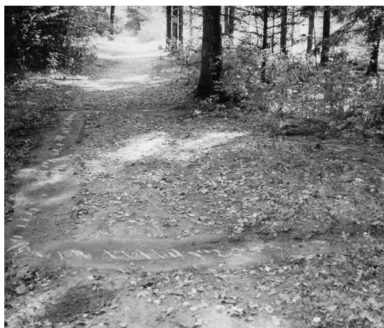
Fig. 5. I dag er kun hyttens fundament tilbage.

På mange punkter stemmer kilderne overens. Men da flere af dem er nedfældet på skrift længe efter, at begivenhederne har fundet sted, gengiver personerne sikkert ikke blot, hvad de selv har observeret, men også hvad de senere har fået fortalt – med mulige omfortolkninger og efterrationaliseringer til følge.