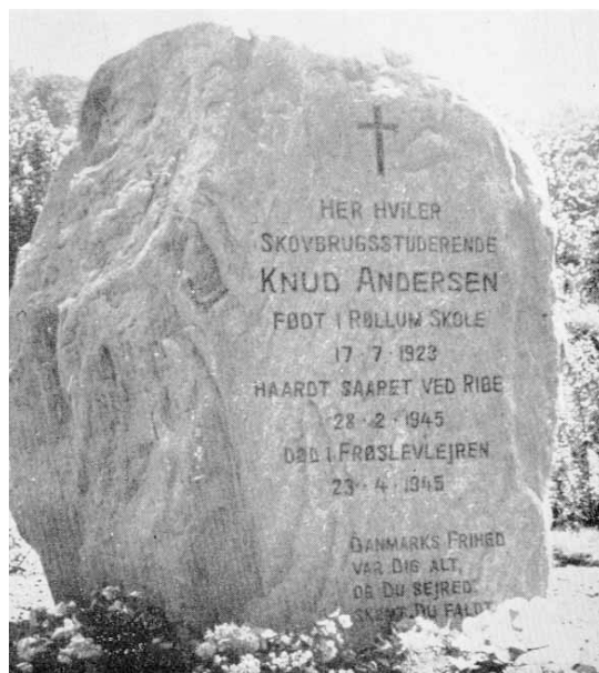
Fig. 7. Gravstenen på Ensted kirkegård.