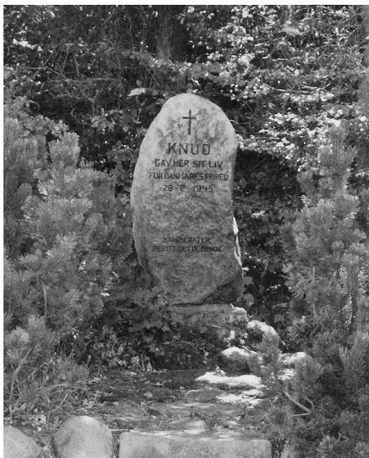
Fig. 1. Stenen ved Tange Plantage.