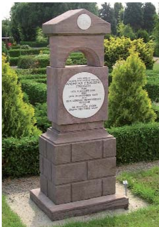
Fig. 7. Andreas Frausing Fridschi's gravmonument. 1807.

Das Grabmal für Andreas Frausing Frisch. 1807.