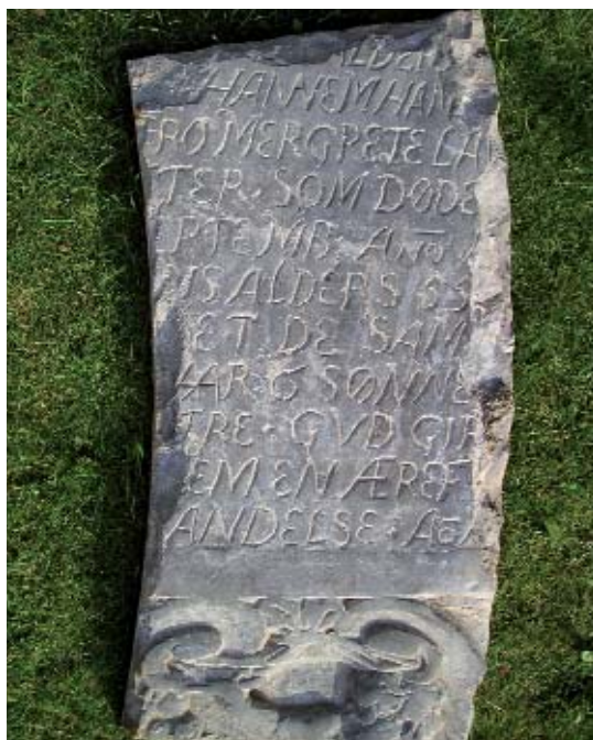
Fig 2. Fragmentet af Bagge Pedersens gravsten. 1621.

I 1681 blev han selv nedsat her. På ligtavlen omtales hans "ældgamle og højjagede herkomst", og han lovprises som en "ret sanddru Råd- og Handelsmand, som elskede Ret og Retfærdighed, belønnet af Gud med Nåde og Velsignelse, højjag-