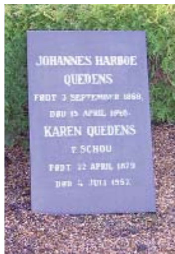
Fig. 8a-c: Johan H. Quedens Gravmonument fra 1877. Anton Christian Quedens gravmæle fra 1910. Johannes Harboe Quedens gravmæle fra 1948. De to sidste bestående af enkle marmorplader.

Johan H. Quedens Denkmal aus dem Jahre 1877. Anton Christian Quedens Denkmal aus dem Jahre 1910. Johannes Harboe Quedens Denkmal aus dem Jahre 1948. Die letzten zwei aus einfachen Marmorplatten bestehend.