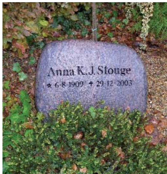
Fig. 10. Anna Stouges gravsten på kirkegården i Tange. 2003.

Selve livet ansås altså som en slags fostertilstand, der lå forud for det egentlige liv og den nye genfødsel i himlen. I digtet bruges netop billedet med blebørnene som et symbol på det hjælpeløse og ufuldkomne menneske.