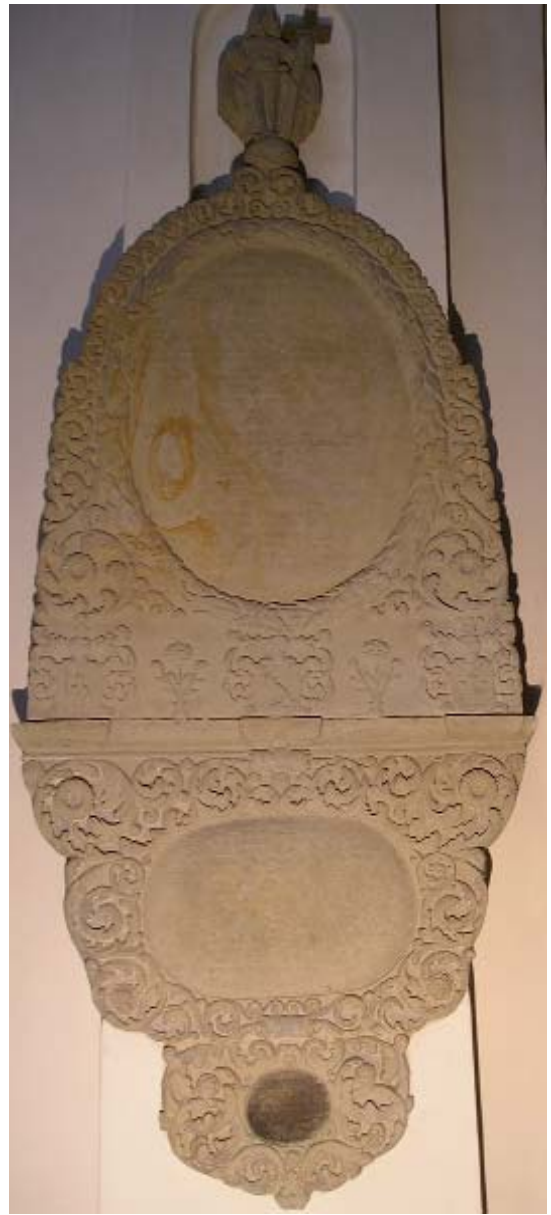
Fig. 5. Epitafiet over Mads Pedersen Fridsch, Peder Jensen Baggesen og Sophie Dorthea Bruun. 1721.

Epitafium für Mads Pedersen Fridsch, Peder Jensen Lauridsen und Sofie Bruun. 1721.