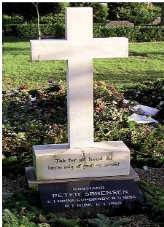
Fig. 9. Peter Sørensens gravmonument. 1960.