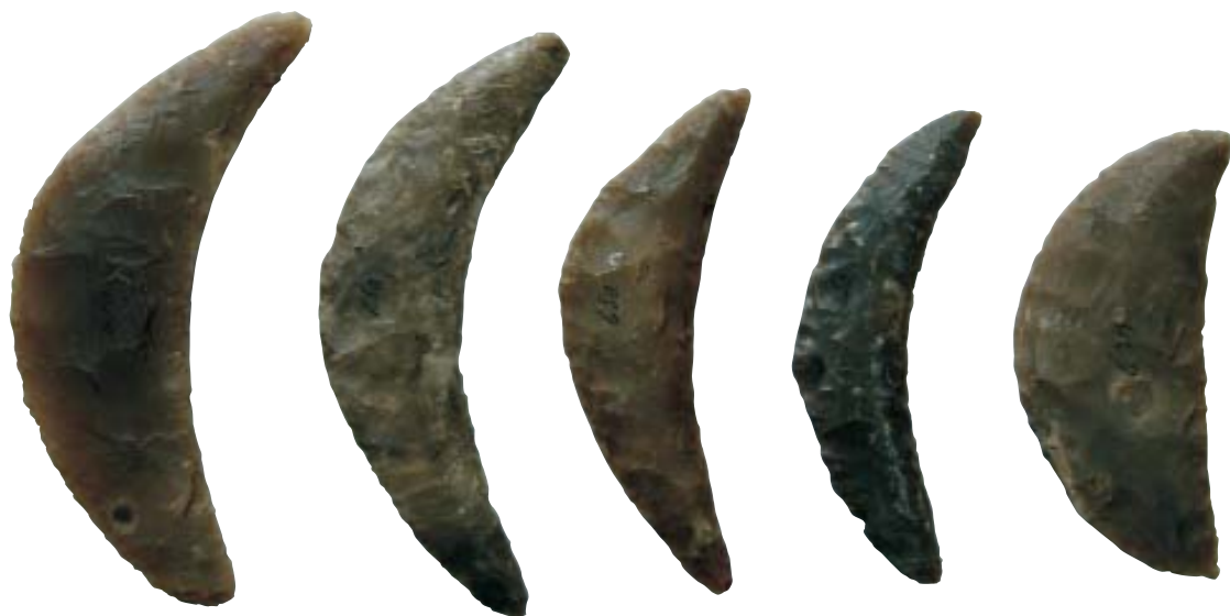
Fig. 1. Fem fladehuggede segle af den halvmåneformede type. Største længde: fra 11-14,7 cm. Fire af seglene har gloss på æggen (ASR M650, nr. 650).

Protokollens beskrivelse af seglenes placering da de blev fundet viser, at de omhyggeligt er blevet lagt dér, den ene inden i den anden. Der er tale om et offerfund, og der kendes mange lignende eksempler. 3 Skikken med ofringer af redskaber,