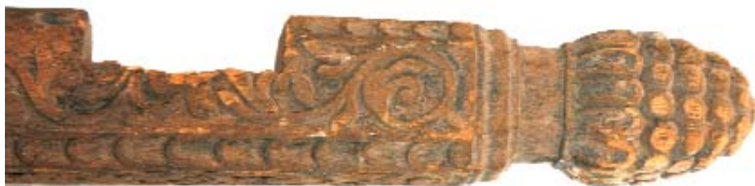
Fig. 6: Toppen af stolpen med drueklasen og udskårne sider og hjørner. Det indsnit der ses, er sandsynligvis lavet sekundært i forbindelse med stolpens brug som plankeværkspæl. Der er en tilsvarende sekundær udskæring længere nede samt spor efter forsøg på at lave endnu en. Der er endnu rester af søm fra plankeværket.

Die Spitze des Pfostens mit Traubenklase und ausgeschnittenen Seiten und Ecken. Der sichtbare Einschnitt stammt wahrscheinlich von der sekundären Verwendung des Pfostens als Pfahl eines Zaunes. Weiter nach unten gibt es einen ähnlichen Ausschnitt zusammen mit Spuren von dem Versuch, noch einen zu machen.