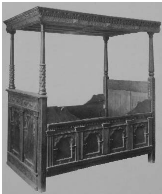
Fig. 7. Himmelseng fra 1623 fra Raklev Sogn ved Kalundborg. Efter Waagepetersen 1980, s. 47.

verne er typiske for træskærerarbejder fra renæssancen. Af sengens konstruktion er der følgende spor: Der er en udsparring med tre naglehuller til sengegavlen (fig. 5, 2). Hvordan gavlens underdel har været fastgjort er uklart. Måske har den hvilet på sengebunden, eller har gået helt til gulvet ligesom en seng fra Raklev ved Kalundborg (fig. 7).