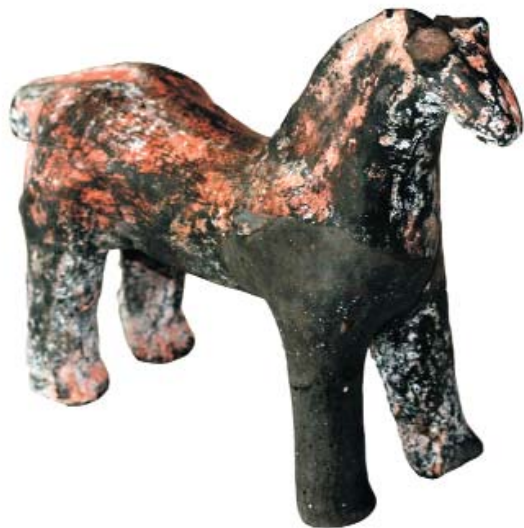
Fig. 4. Hestefiguren er af sortgods, og har rester af rød bemaling. Det ene ben mangler, og er tidligere rekonstrueret. Længde: 12 cm., højde: 8,5 cm. (ASR M1825, nr. 1825).

Fundomstændighederne beskrives ikke nærmere, så det kan ikke umiddelbart fastslås i hvilken forbindelse indmuringen af hesten er sket og dermed dens alder. Den nuværende kirke blev opført i anden halvdel af 1400-tallet som et treskibet, overhvælvet langhus. Således altså også den mur som hesten er fundet indmuret i. I Danmarks kirker argumenteres der for, at figurerne i både domkirkens tårn og S. Katrine kirke kan være anbragt af den tyske muremester N. H. Riemann, der havde en større entreprise ved domkirken 1738-40, og som også stod for den store istandsættelse af S. Katrine 1745-46. 10 Domkirkens store tårn blev fuldendt senest 1333 men er talrige gange siden undergået større og mindre reparationer. Forbindelsen til den tyske bygmester underbygges med en henvisning til et tysk værk om votivgaver i