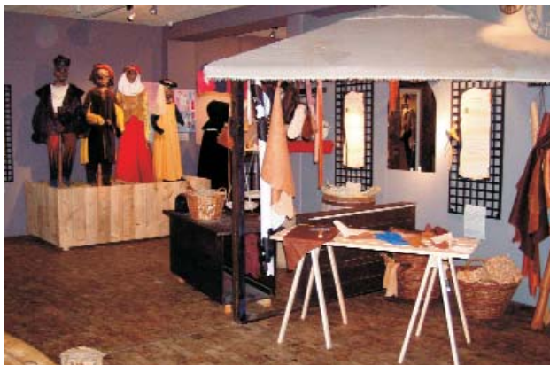
Fig. 1-2. Kig ind i middelalderlegerummet Leg med Kristine og Rolf. I baggrunden ses hele familien som giner. I køkkenet er ildstedet med indlagt lys og lyd.

Ein Blick in den Aktivitätsraum "Kristine und Rolf" in der Ausgabe von 2007. Im Hintergrund sieht man die Familie als Büsten. In der Küche gibt es den Herd mit installiertem Licht und Laut.