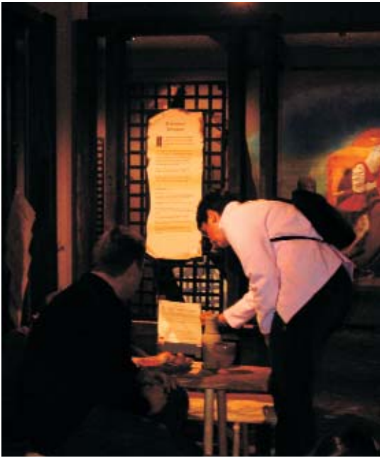
Fig. 5. Teksterne studeres grundigt. Især de voksne har ihærdigt studeret spørgsmål og svar.

Die Texte werden eingehend studiert. Besonders die Erwachsenen haben sorgfältig Fragen und Antworten studiert