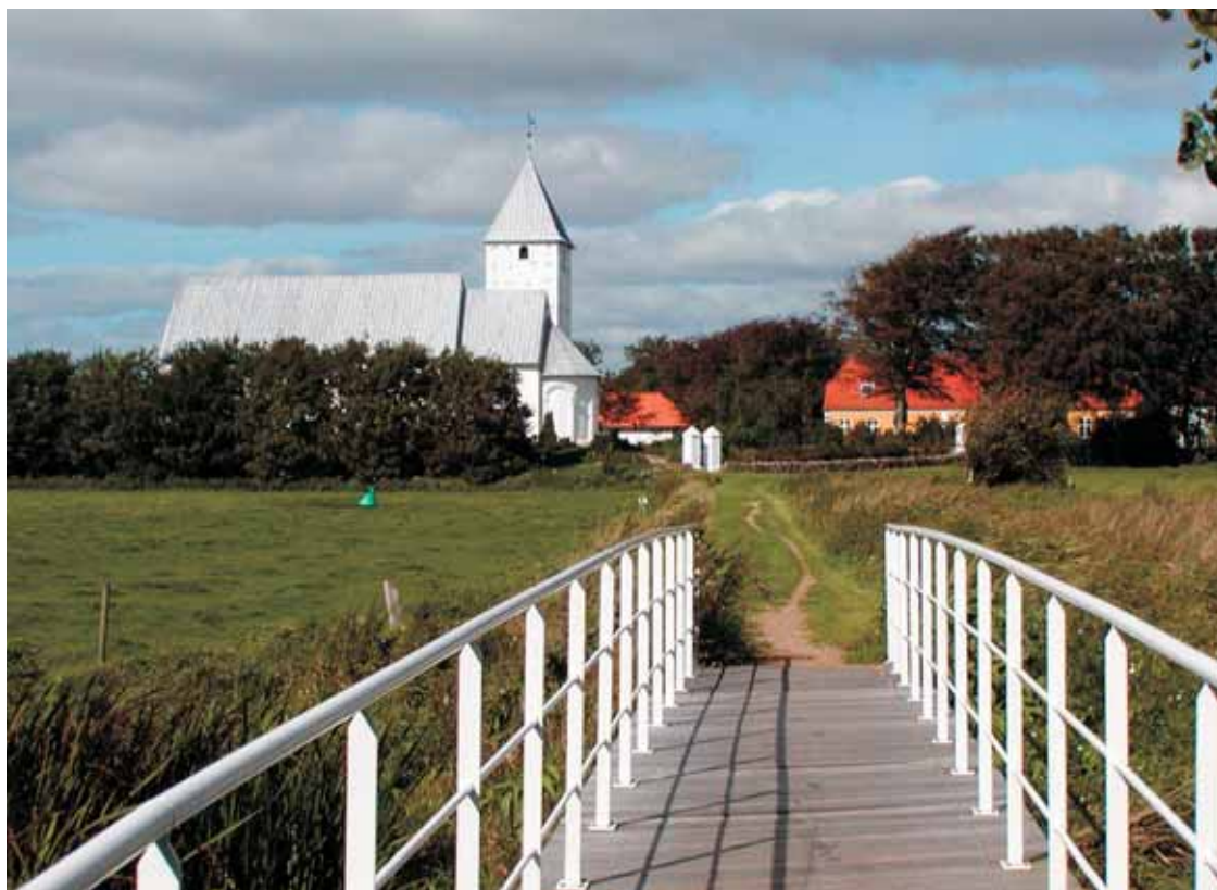
Fig. 4. Udsigten over åen mod Vilslev Kirke ved Vilslev Spang.

The view across the river towards Vilslev parish church and Vilslev Spang.