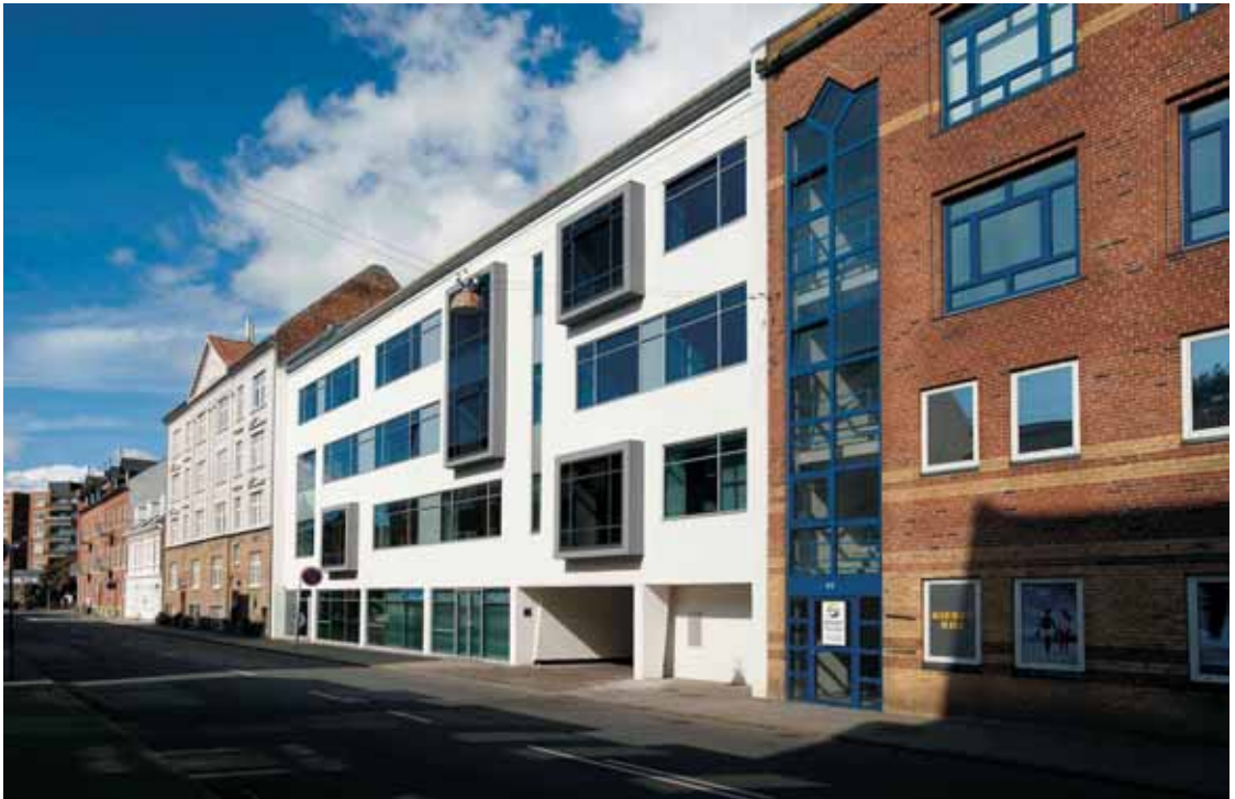
Fig. 8. Skolegade 85 i Esbjerg, som blev præmieret for dristig fornyelse af facaden. Udlånt af Esbjerg Kommunes Byfond. Foto: Poul Madsen, PROFOTO.

Skolegade 85 in Esbjerg, which was awarded for its daring renewal of the building's facade.