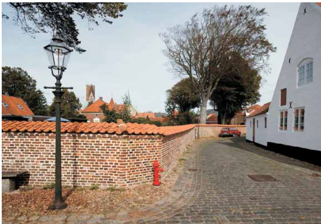
Fig. 2. Muren omkring Stiftamtmandsgården, som blev præmieret i 2009. Udlånt af Esbjerg Kommunes Byfond. Foto: Poul Madsen, PROFOTO.

The wall surrounding the Stiftsamtmands residence in Puggaardsgade, Gravsgade and Bispegade in Ribe. Seen from Gravsgade.