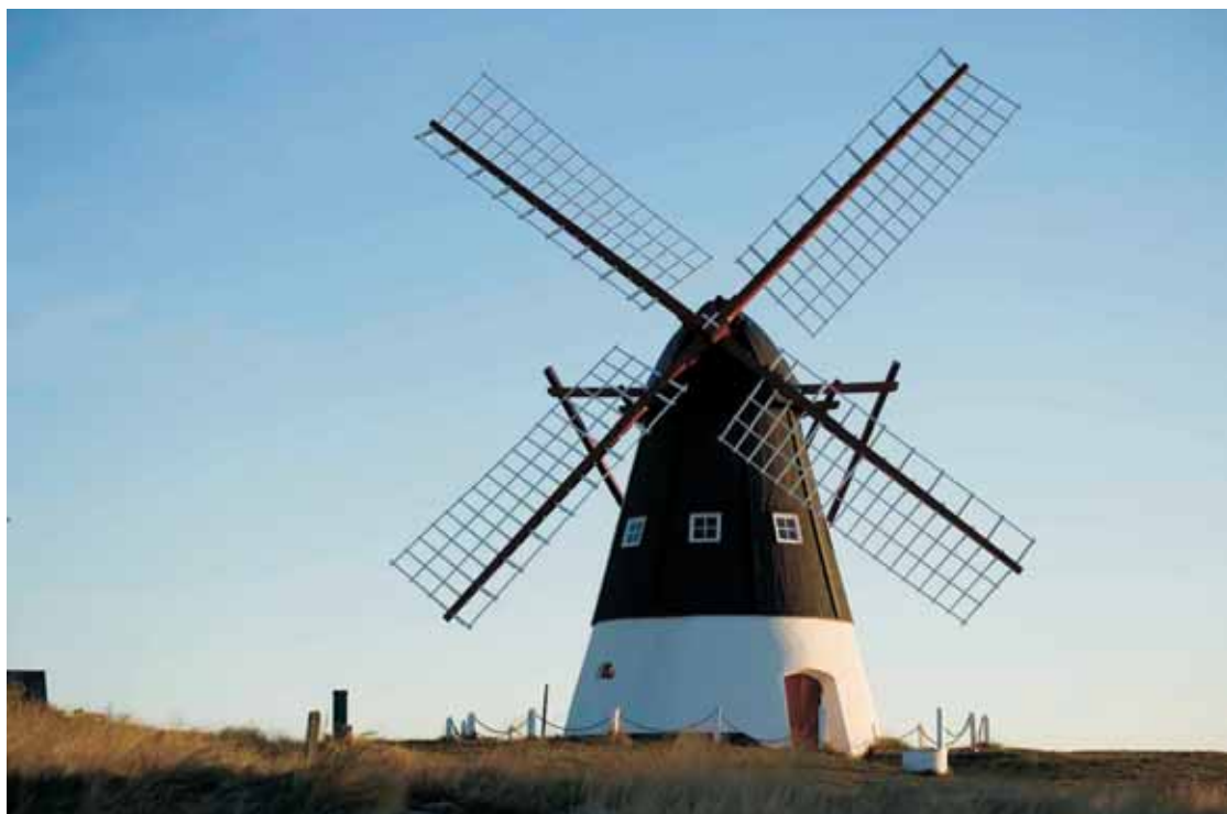
Fig. 3. Mandø Mølle som blev præmieret for fornem restaurering. Udlånt fra Esbjerg Kommunes Byfond. Foto: Poul Madsen, PROFOTO.