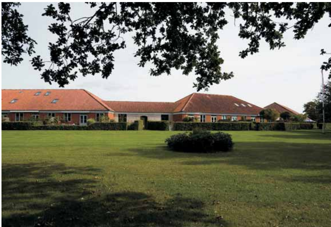
Fig. 6. Nørrelundparken i Ribe set udefra hesteskoen, hvor hver ejerbolig har sin egen lille have. I midten af bebyggelsen er et stort grønt fælles parkareal.

Nørrelundpark in Ribe, seen from outside the horseshoe shaped settlement, where each house has its own small garden. The middle of the site is occupied with a large communal green area.