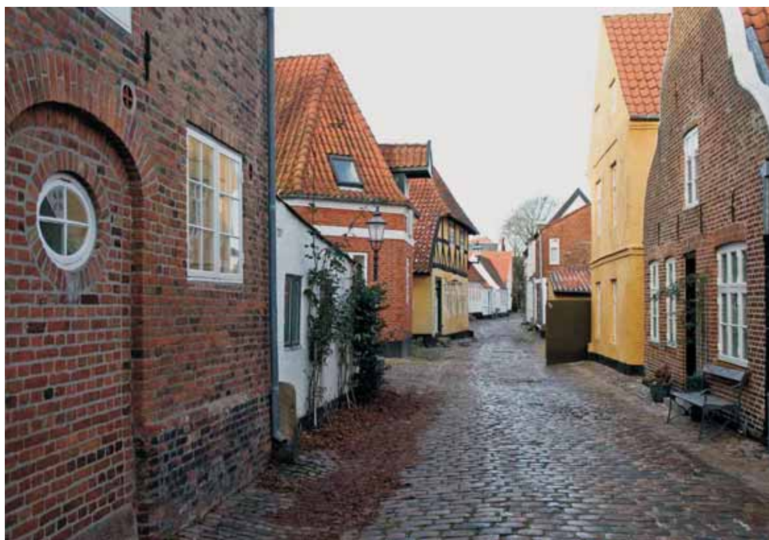
Fig. 1. Fiskergade i Ribe.

Muren blev udtaget til præmiering for smuk bevaring af et unikt bymiljø. Stiftamtsmandsboligen med muren definerer byrummet og har kulturhistorisk og arkitektonisk betydning. Muren kan føres tilbage til 1797, da Werner Jasper Andreas Moltke i 1796 blev udnævnt til stiftamtmand i Ribe. Han fik bygget en ny bolig med tilhørende mur i Puggaardsgade 7 i 1797, som siden blev udvidet med flere tilbygninger fra 1855 til 1870.