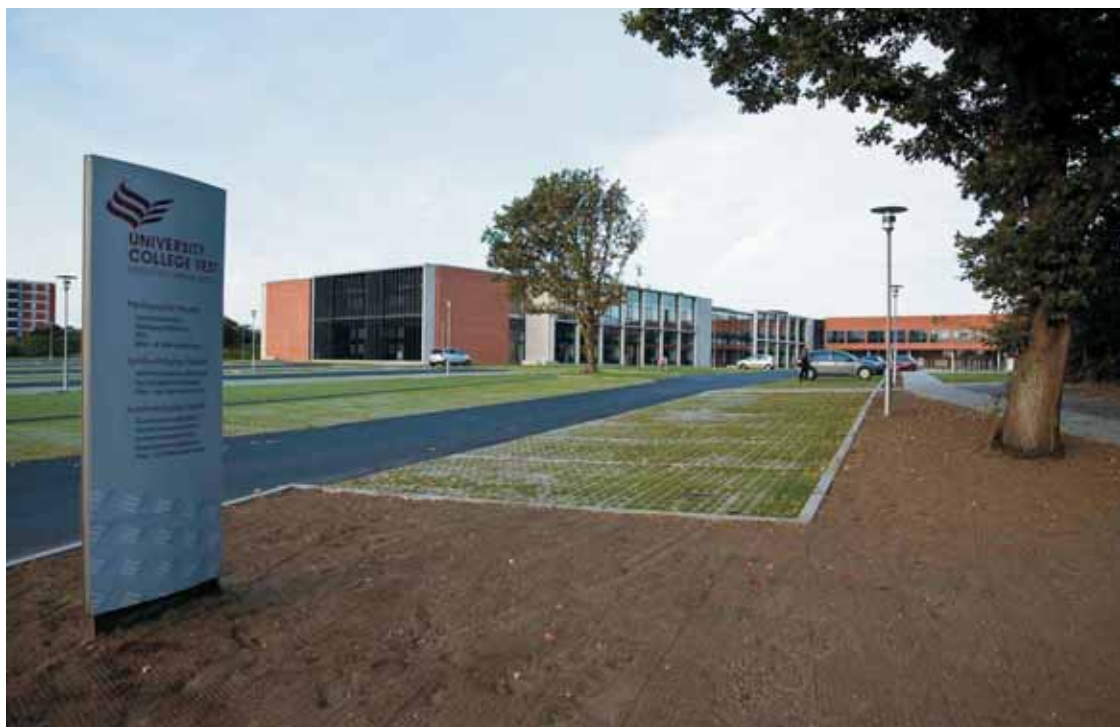
Fig. 7. Professionshøjskolens nye tilbygning, der ved sin placering og arkitektur har åbnet komplekset ud mod Degnevej. Udlånt af Esbjerg Kommunes Byfond. Foto: Poul Madsen, PROFOTO.

The new main building of the Vocational University College, which with its location and architecture has opened the university complex up towards Degnevej.