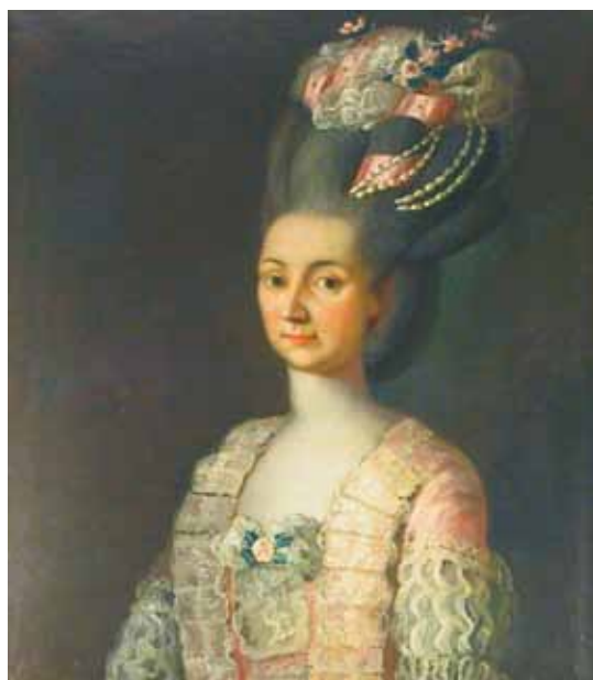
Fig. 5. Protokollen over almisesøgere 1790-97 viser, at mange skyldte penge til madame Rahr. Købmandskenen i Sønderportsgade 37 var da også uden tvivl byens mest velhavende person i 1790’erne. Hendes mand havde både været engageret i handel på Vest- og Sydeuropa og hval- og sælfangst i Nordatlanten. Madame Rahr valgte efter nogle år at hellige sig den hjemlige tømmerhandel, men derudover tjente hun store penge på investering i fast ejendom og pengeudlån. maleri i privateje.

De emner, som blev forelagt kancelliet, kan opdeles i to kategorier. Den første handler om mulig-