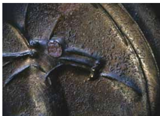
Fig. 4. Hjortens øje er blevet repareret og udfyldt, her set fra fadets underside.

The springing stag. Especially the areas around the legs and the mouth have been worn smooth by the many years of polishing.