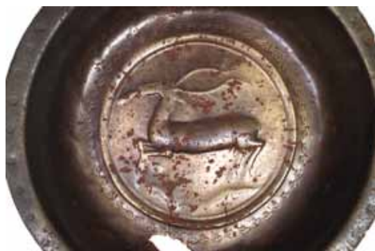
Fig. 3. Den springende kronhjort. Især ved benene og foran munden er motivet udvisket af de mange pudsnings.

The springing stag. Especially the areas around the legs and the mouth have been worn smooth by the many years of polishing.