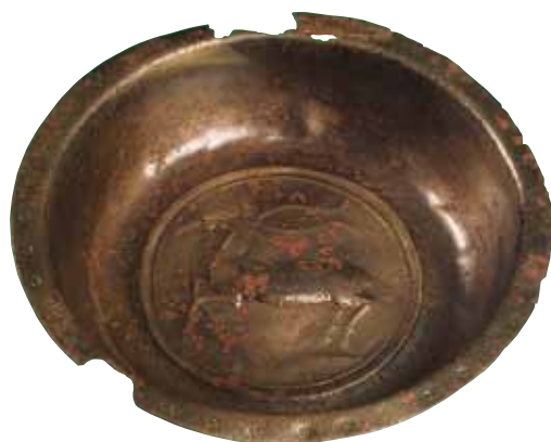
Fig. 1. Molling fra Krogsgård.

Da fadet blev fundet, var det dækket af et irgrønt lag med masser af aftryk af plantefibre, som om