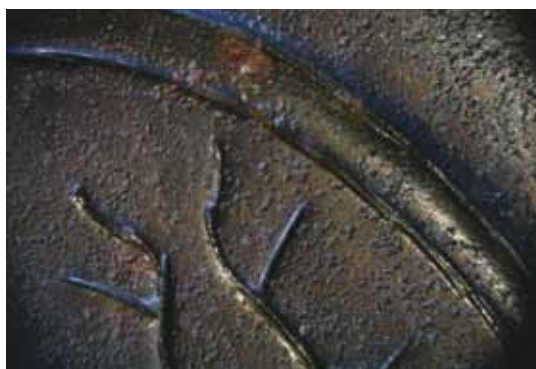
Fig. 5. På undersiden affadet kan man se spor efter håndværkerens pundsel, som omkring den cirkulære vulst er ført i overlappende buer.

Fadet er meget slidt i partiet omkring den sprin-