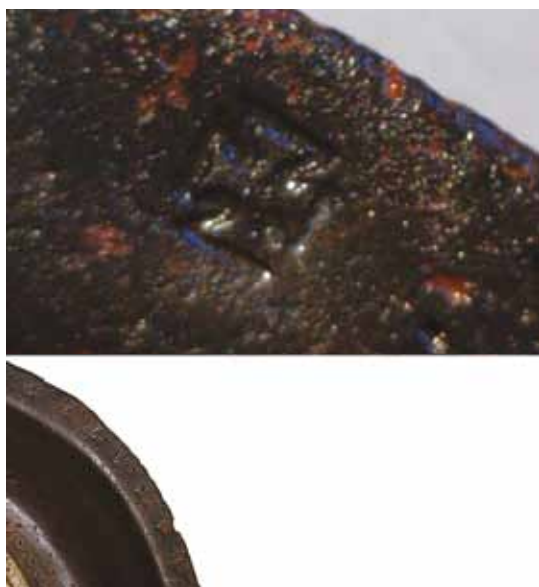
Fig. 7. På den flade fane findes med ca. 2 centimeters mellemrum indstemplede malteserkors, nederst udsnit af fanen og øverst et enkelt malteserkors.

On the flat rim there are embossed Maltese crosses with ca. 2 cm intervals. Bottom: A section of the flat rim. Above: A single Maltese cross.