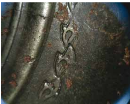
Fig. 6. Et udsnit af det cirkulære bånd af springende delfiner. Håndværkeren har ikke været helt præcis i sin pundsling ved de to midterste delfiner. Flere steder er kanterne af delfinerne udvisket på grund af slid efter pudsnings.

From the bottom of the dish you can see traces of the artisans puncher tool, as around the circular lip, which is led in overlapping bues.