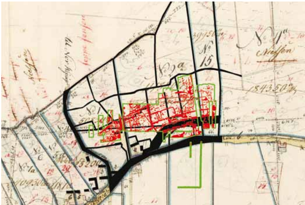
Fig. 2. Udgravningen indsat på Original 1-kortet fra 1795. Veje m.m. på det gamle kort er tydeliggjort med sort.

The excavation site superimposed on an Original 1-landmap. All roads etc. have been highlighted in black on the old map to ease visibility.