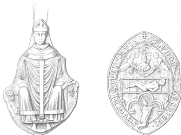
Fig. 2a og 2b

Valdemar Sejrs retmæssige arving, Valdemar den Unge, døde tidligt, og kongens næstældste søn Erik Plovpenning (1241–1250) blev kro-