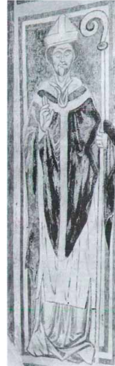
Fig. 1a og 1b

Christoffer I og ærkebiskop Jacob Erlandsen malet under den første store ærkebispespejdelighed o. 1260. Kalkmalerier i Karise kirke ved Fakse. Efter: www.denstoredanske.dk .