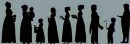
En silhuettør kommer til byen