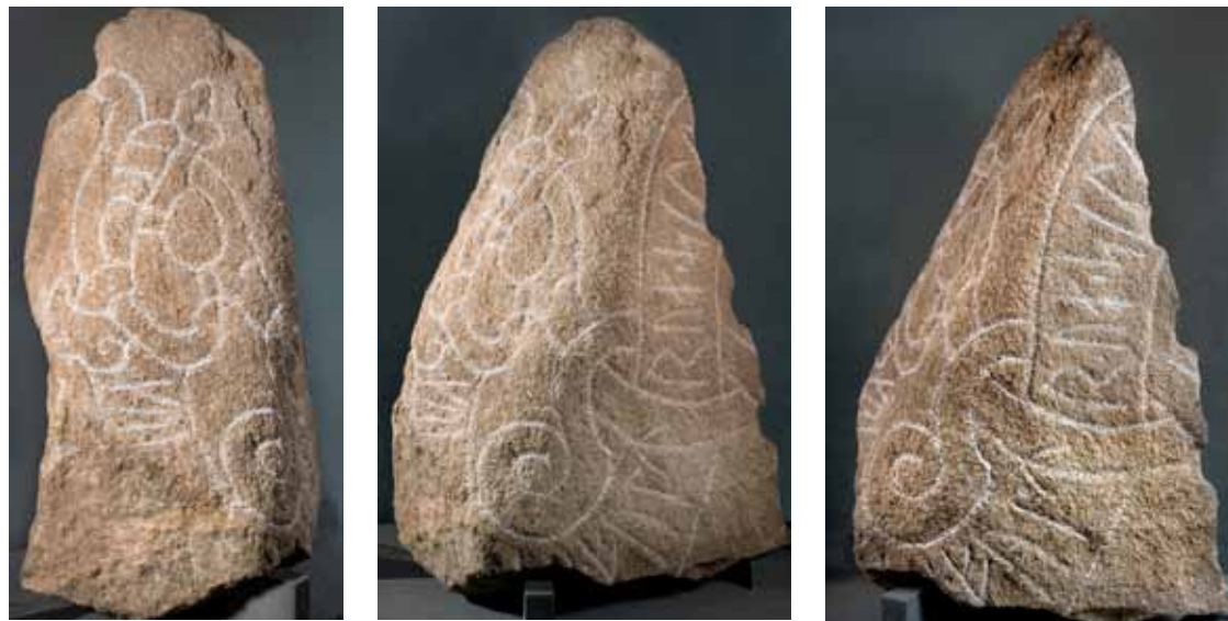
Fig. 4 a–b.

Photos of the three sides of the runestone.