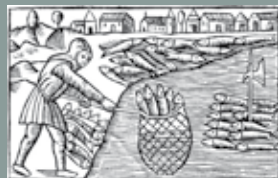
1200-tallets ærkebispes- stridigheder i lokalt perspektiv