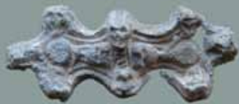
Udgravningerne i sct. Nikolajgade