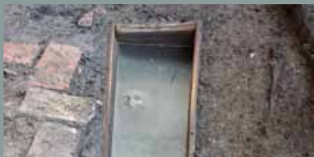
Højmiddelalderens grave på Lindegården i Ribe