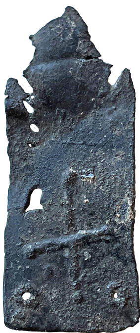
Figur 10. Bagsiden af pilgrimsmærke kat. 37, som viser en korslignende figur.