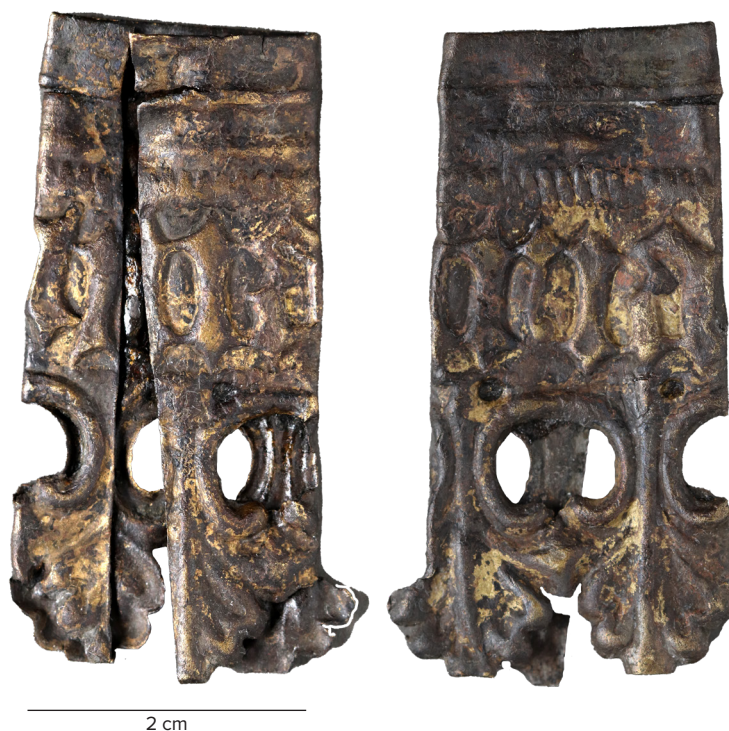
Figur 4. Pyntebeslag (7237X694) af kobberblik fra 1400-tallet fundet på Nytorv. Omskriften læses "MARIA".