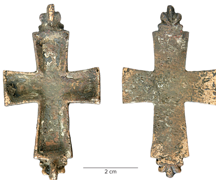
Figur 1. Den ene halvdel af et relikviekors (5698X1303) af kobberlegering. Højde 6,5 cm. Fundet i Algade 9 i husrester fra omkring år 1100. Sammen med den manglende halvdel har det udgjort en beholder, der har indeholdt en splint af Kristi kors. Korset er måske hjembragt fra middelhavsegnene eller Østeuropa af en tidlig pilgrim i 1000-tallet.

Allerede i 1000-tallet begyndte danskere at drage på pilgrimsrejser til de kristne helligsteder i udlandet (fig. 1). I første omgang var det særligt de helligste steder, som Betlehem og Jerusalem i Det Hellige Land samt Rom med apostelgravene, der trak. Senere opstod utallige andre steder, hvoriblandt særligt apostlen Jakobs grav i Santiago de Compostela i Spanien blev et af de helt store mål. Valfartsmål i de nordiske lande er der også et tidligt eksempel på, og allerede fra 1030'erne kunne man besøge Olav den Helliges grav i Trondheim. I år 1027 besøgte Knud den Store Rom, hvor han ifølge Knytlingesaga 7 etablerede et herberg for danske pilgrimme, og senere i århundredet døde Roskildebispens Svend Nordmand i 1088 på Rhodos på vej til det Hellige Land. Også kongen Erik Ejegod døde ganske tæt på målet i det Hellige land, men dog på Cypren i 1103. Inden havde han fået oprettet to herberger for danske pilgrimme i Lucca og ved Piacenza, der lå på vejen til Rom. 8 Fra senere i middelalderen er der eksempelvis kendskab til, at kongerne Valdemar Atterdag og Erik af Pommern besøgte Jerusalem, mens Christian I besøgte Rom – dog vist mest i politisk øjemed. 9