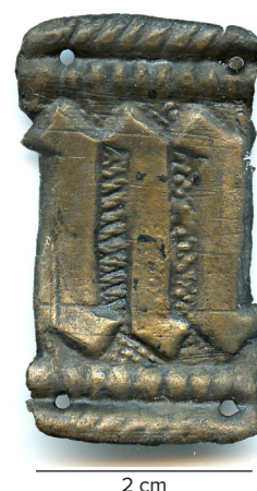
Figur 3. Pyntebeslag (6713X135) af blik af kobberlegering fra 1400-tallet fundet i Vingårdsgade. Højde 3,7 cm. Gengiver bogstavet "M", der sikkert er en reference til Jomfru Maria. Måske har det prydet et bælte.