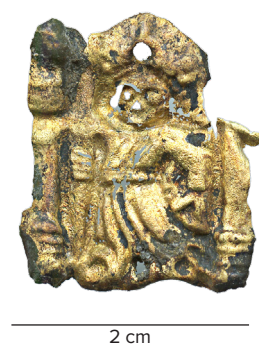
Figur 6. Pyntebeslag (7237X612) af kobberblik fra 1400-tallet fundet på Nytorv. Forestiller en person med en bredskygget hat og med en lang stav i sin højre hånd – måske skt. Jakob som pilgrim.

være en ægte muslingeskal, der var forsynet med et par huller til ophængning. 13 Bortset fra muslingeskallerne har disse let forgængelige mærker næppe overlevet i jorden til i dag. Dette forhold må naturligvis medregnes i forbindelse med det aktuelle tema om Aalborgpilgrimmenes rejser.