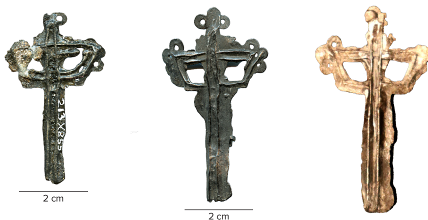
Figur 12. Kat. 52 og 53 samt et tilsyneladende identisk mærke fra Silkeborg (Museum Silkeborg, sag-/genstandsnr. 10/2004 1-147). Alle har samme karakteristiske, dobbelte ribber på bagsiden.

fund. 73 Udbredelsen af de næsten identiske mærker i Danmark og Nordtyskland indikerer et hjemsted i det danske eller nordtyske område. 74 Det er dog også blevet betvivlet, om de overhovedet har været solgt som egentlige pilgrimsmærker. 75 De to mærker kat. 52 og 53 er på bagsiden forsynet med små, dobbelte ribber, der måske skal give mærket ekstra styrke. Det identiske mærke fra Silkeborg har de samme ribber, og det må formodes, at alle tre mærker er støbt i samme form (fig. 12). Karakteristisk for alle tre mærker er desuden deres lidt sjuskede støbning. Mon ikke der især for disse er tale om et jysk produkt?