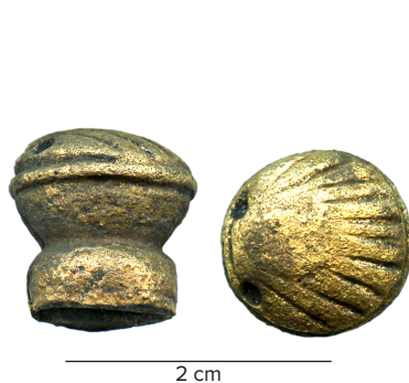
Figur 5. Knivendebeslag (7237X298) af kobberlegering ca. 1450-1525 fundet på Nytorv. Udformet som en "Ibsskal", der var et almindeligt symbol på pilgrimsfærd.