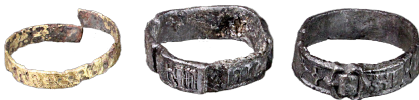
Figur 2. Tre fingerringe fra 1300-1400-tallets Aalborg, alle med indskrifter. En påkalder sig formentlig de hellige tre konger: „MEL...IOR+.A.....“ (6206X595), mens de to andre påkalder sig Jomfru Maria: „+MARIA..HELF...“ (5698X202) og „AVE MARIA GRACIA PL“ (6713X1046).

Pilgrimsmærkerne blev typisk støbt i en blanding af tin og bly, men der kendes også til mærker af mere forgængelige materialer som papir og pergament. Symbolet på valfart til Jerusalem var en palmegren, mens mærkerne fra Santiago de Compostela, som blev middelalderens almindelige symbol på valfart, også afveg ved at