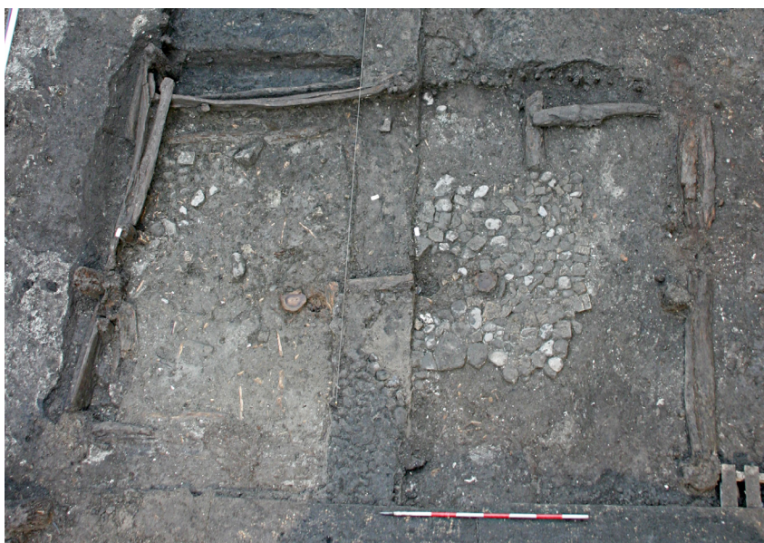
Figur 11. Rester af hus med træbygget kælder fra 1400-tallet. Udgravet i Algade 9 i 2007/2008 (ÅHM 5698). På kælderens stenpikkede gulv fandtes et pilgrimsmærke fra Kliplev (kat. 40).

har været tale om et gavlhus, som har ligget ved hovedgaden. Det var opført i bindingsværk, og også kælderens var på noget sjælden vis bygget af træ. Placeringen ved hovedgaden taler for, at beboerne har tilhørt den socialt bedre halvdel af byens befolkning, der i øvrigt har haft råd til at gemme forråd i sin kælder og har haft overskud til at drage på pilgrimsfærd – hvis da ikke Kliplev blev besøgt i forbifarten på en anden rejse sydpå. Troen har dog åbenlyst betydet en del og tilsyneladende ikke kun den rent katolske. I husets gulv fandtes nemlig et nedgravet kokranium, der måske har været et ondt-afværgende "husoffer" (fig. 11).