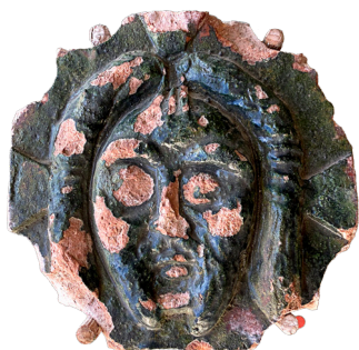
Figur 8. Seglstampe (6295X54) fundet ved husrester fra 1400-tallet i det sydøstlige hjørne af Budolfi Plads. Den har tilhørt en borger ved navn "Nicolai" eller "Nicolaisen" og er lavet af en tinlegering. Diameter: 2,5 cm.