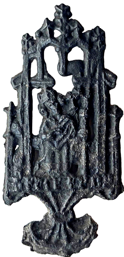
Figur 13. Monstransformet pilgrimsmærke med en siddende biskop (kat. 58). Fotograferet i kraftigt sidelys. Under figuren er en svært tydelig indskrift. De to centrale bogstaver kan med god vilje tolkes som "P P". Måske gemmer indskriften en udgave af stednavnet "Kippinge", der henfører mærket til dette berømte valfartssted på Falster?

nævnte kloster i Præstø. Det er altså muligt, at Aalborg-vedhængene stammer fra et af disse Antonitterklostre. Ligesom med de lettere anonyme krucifikser er det uvist, om de indskriftsløse Taukors overhovedet har været egentlige pilgrimsmærker, eller om de måske mere var generelle Antonitter-symboler, der har fungeret ved siden af de mere regulære mærker til påsying. 78